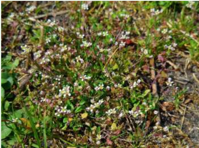
Veld met bloemen.

gen in Catal Hüyük in Turkije in een 8 millennia oud dorp werden zaden van het herderstasje gevonden. Deze voorbeelden duiden erop dat de mens al heel lang het herderstasje eet. Hippocrates, grondlegger van de mo-