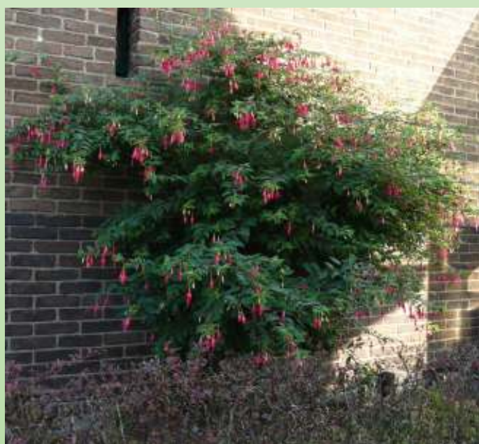
'Jaspers Hardy King'

Zelfs bij temperaturen van 30°C en meer hangt de plant nooit slap. De bloei begint meestal eind mei en houdt pas op als het meer dan -2°C gevoren heeft. Ongedierte en roest heb ik er nog nooit in gezien.