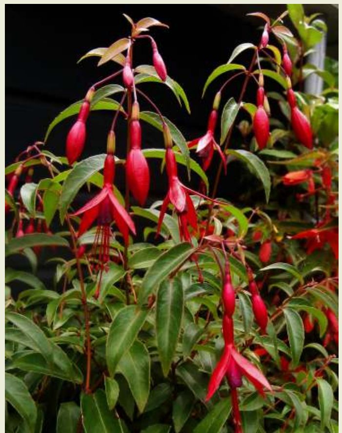
F. regia 'Gerrit'

https://www.nkvf.nl/gerrit_website/R1-Voor_u_uitgeprobeerd.htm , klik dan op de vlaggetjes.