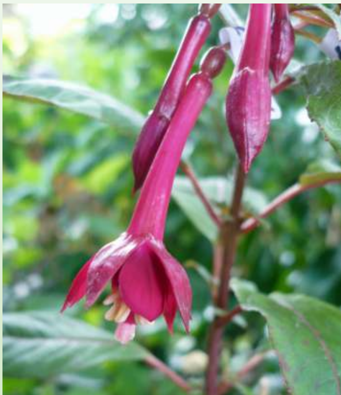
Zaailing N 12-14

Zaailing N 12-14 = I 89-04-02 x F. triphylla PB7760#6. Heeft een goede bloem en een uitstekend wortelgestel. De kwaliteit van het blad is echter onvoldoende door de vorming van storende vlekken gedurende de zomermaanden, waardoor de plant (evenals andere soortgelijke zaailingen) zich heeft gediskwalificeerd om te worden uitgebracht.