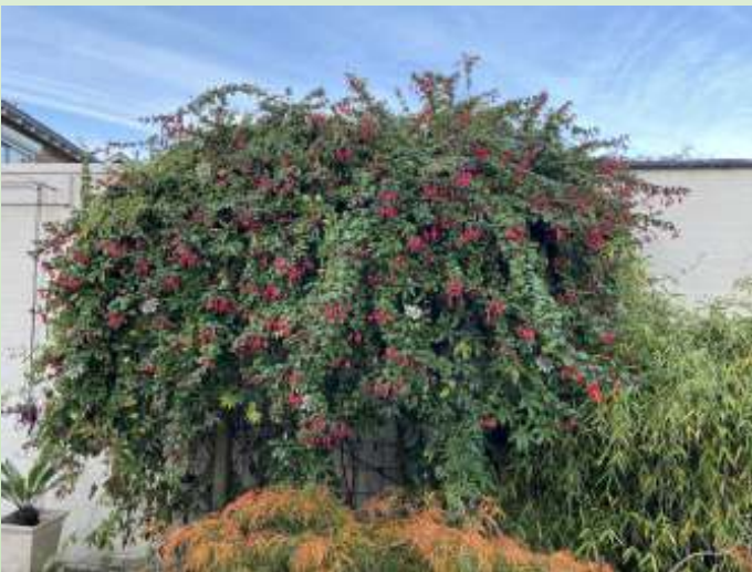
F. regia ssp. regia '84/87'