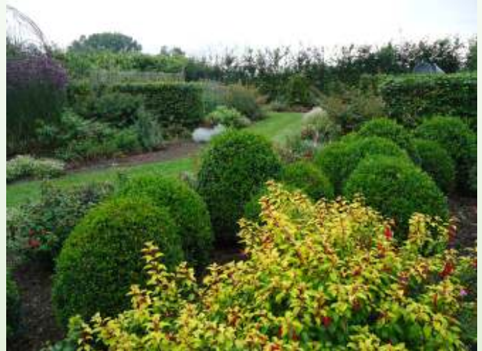
Winterharder tuin bij Kwekerij Van der Velde

Hij heeft ook een F. regia 'Gerrit' staan. Deze plant is ont-