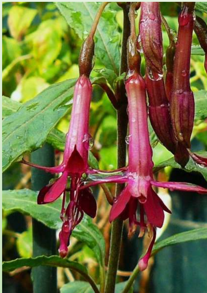
'Jaspers Aubergine Pipes'

Het is zelf geen triphylla maar, indien vruchtbaar, mogelijk wel een plant met potentie voor gebruik bij het maken van paarse triphylla's.