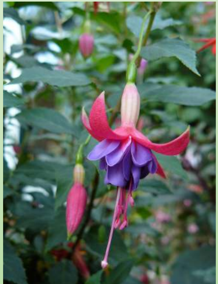
Fuchsia 'Gerrit van Veen'

Gerrit van Veen heeft een boekje uitgebracht in 1992 over de ervaringen die we daar hebben op gedaan. ("Winterharde Fuchsia's", fuchsia's overhouden in border en plantsoen, 1992, Gerrit van Veen). Houd er wel rekening mee dat het een gedateerd boekje is. Een digitale versie staat bij de NKvF op de site onder linken Gelderse Fuchsia infosite. U vindt directe linken aan het eind van dit stukje.