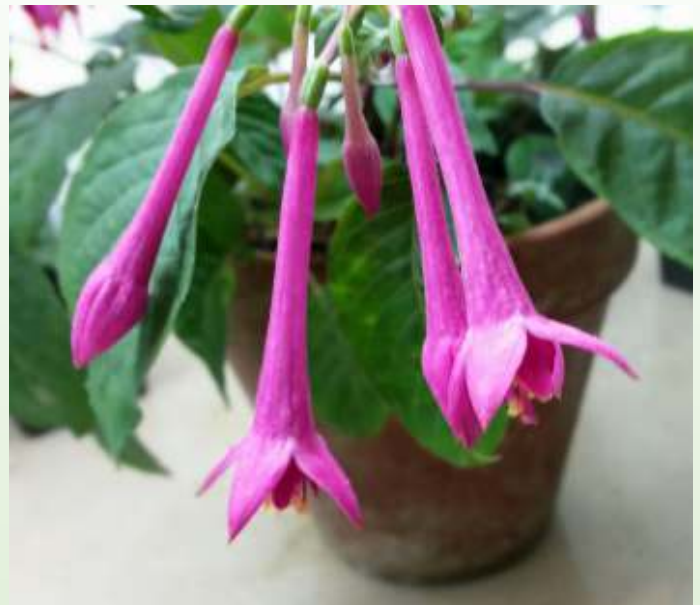
Zaailing N 16-47

Zaailing N 16-47 is afkomstig uit de kruising 'Strike The Viol' x (('Göttingen' x 'Our Ted') x ('Göttingen' x 'Our Ted')) x F. juntasensis . Het genoom van deze zaailing is