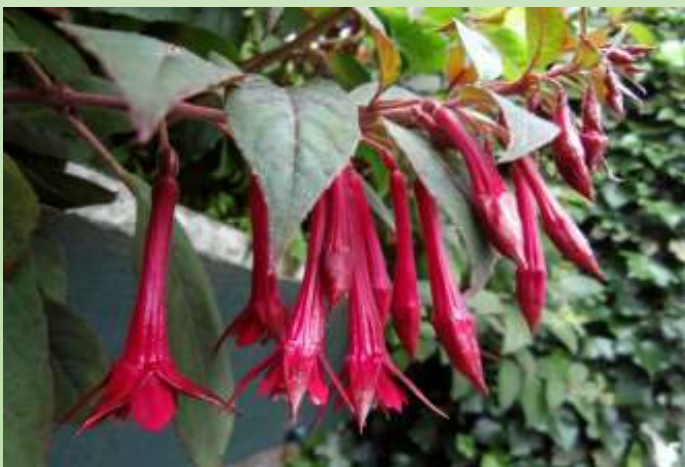
Zaailing HvA 12-05-02

Zaailing HvA 12-05-02 = I 89-04-02 x F. triphylla PB7760#7. Fraaie bloem, maar jammer genoeg ook nu weer een plant met slechte groei-eigenschappen. Uit de resultaten tot nu toe blijkt dat zaailing I 89-04-02 in staat is om triphylla's te produceren met mooie paarse bloemen. Jammer genoeg hebben de zaailingen onvoldoende kwaliteit om een fraaie plant te vormen. Met