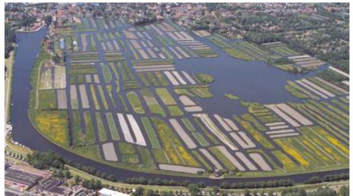
'Rijk der Duizend Eilanden'

U kunt zelfs een veiling meemaken of een rondvaart maken door het Rijk der Duizend Eilanden. Ieder uur zal er een rondvaart zijn en om 14.00 uur een veiling. De kaartjes zijn te koop aan de bestuurstafel van de NKvF in de kap.