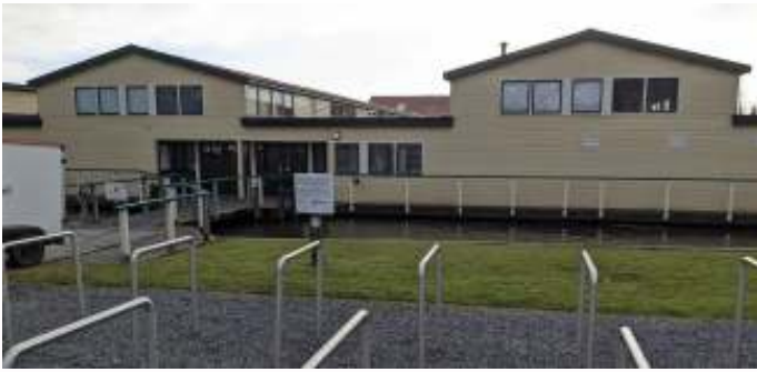
De kap en tevens de ingang

In de najaarsvergadering heb ik de ledenraad gemeld dat de Vriendendag dit jaar zal plaatsvinden bij Museum BroekerVeiling in Broek op Langedijk en ik heb diverse foto's van de locatie laten zien. Van het hoofdbestuur heb ik nu de goedkeuring gekregen om een en ander nader uit te werken.