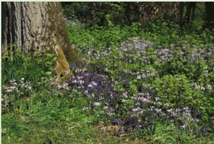
Veld met bloemen

Hondsdrif speelde ook een grote rol in de geneeskunde. In ieder geval neutraliseert het de jeuk van de brandnetelsteek. Omdat Hondsdrif op eenzelfde soort bodem leeft, groeit deze vaak in de buurt van de brandnetels. Net als Grote weegbree ( Plantago major ) en Smalle weegbree ( Plantago lanceolata ) helpt het tegen brandneteljeuk. Kneus de bladeren tot het sap eruit komt en wrijf