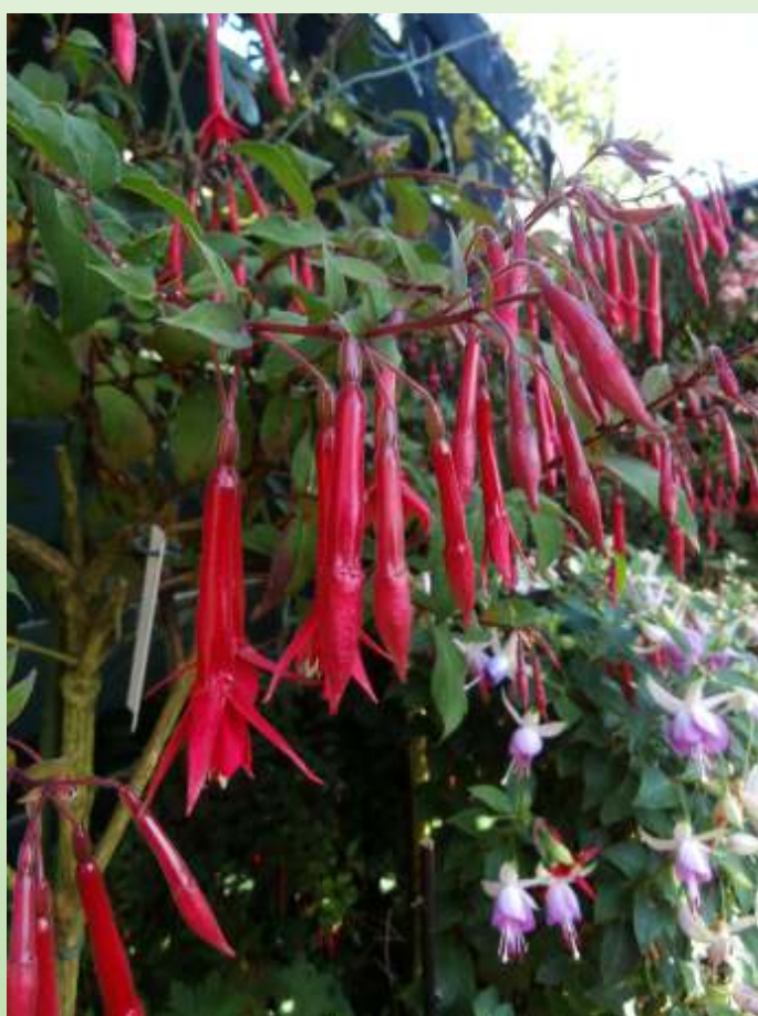
Jaspers Hardy Red Pipes