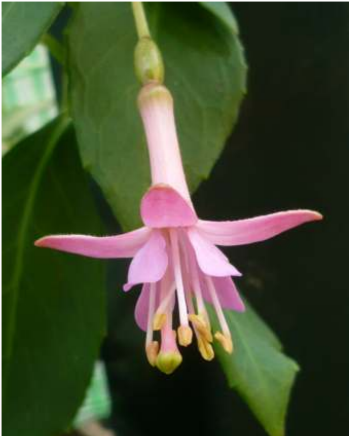
'Straat La Plata'