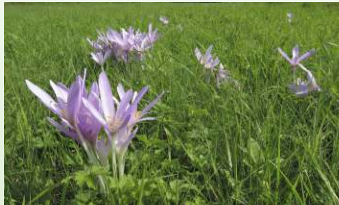
Veld met herfsttijloos.

delijden en schonk een van de mooiste bloemen aan de herfst. En als het voorjaar aanbrak kon de Herfsttijloos uit haar winterisolement gehaald worden en beginnen met bladeren en zaad te vormen. En opdat de dieren de plant niet zouden eten kreeg hij een giftige stof om zich te beschermen.