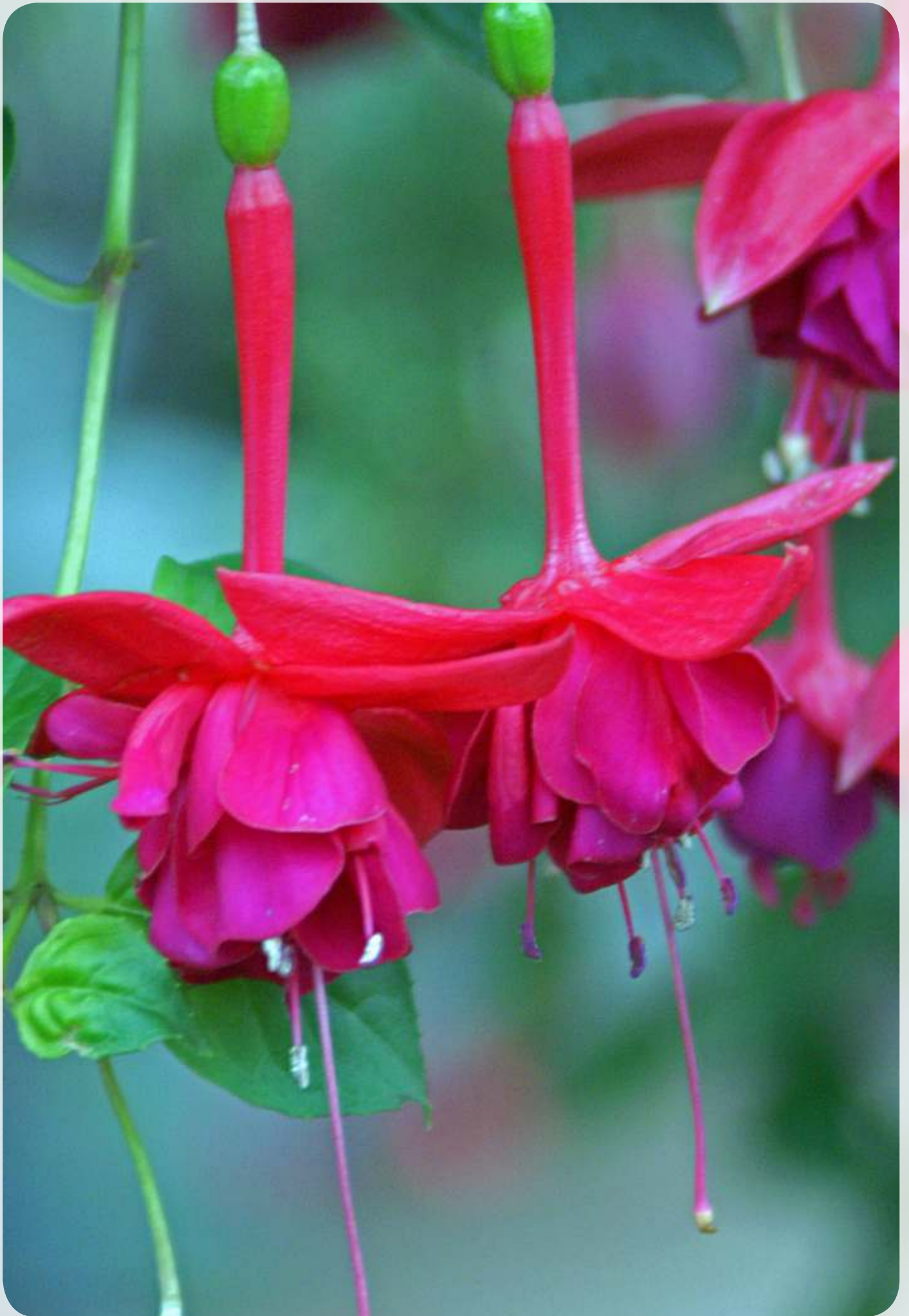
'Mien van Oirschot'