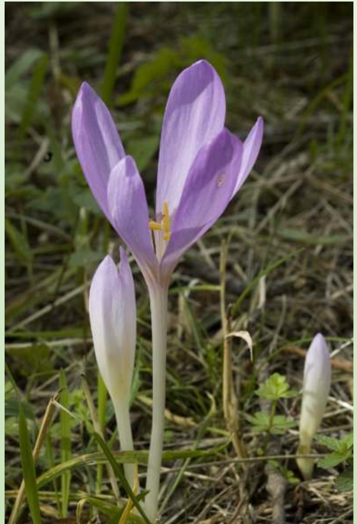
Bloem wilde herfsttijloos.

ken noemden de plant Kolchicon en naar aangenomen wordt zijn zij de vindsters van de plant. De gifmengster/tovenares Medea, dochter van koning Aietes van Colchis woonde daar. Volgens een Griekse sage bediende zij zich van het gif dat in Colchicum voorkomt om de oude Jason te verjongen om dan met hem te kunnen trouwen. Deze Jason, de aanvoerder van de Argonauten, was de veroveraar van het Gulden Vlies, waarbij zij hem behulpzaam was.