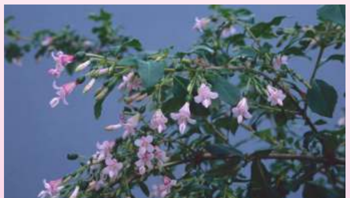
'Straat of Plenty'