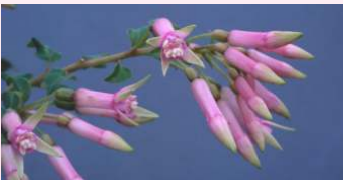
'Straat of Dover'