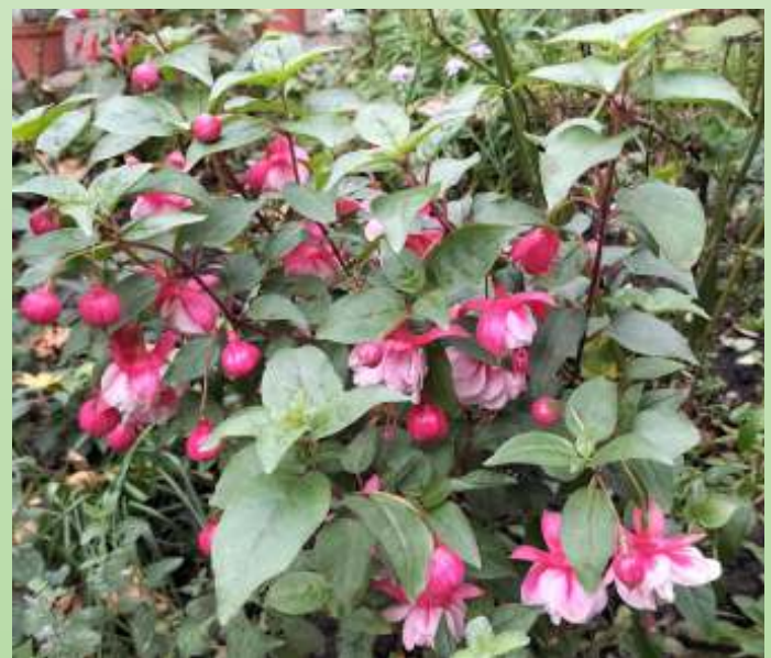
Winterharde fuchsia, naam onbekend