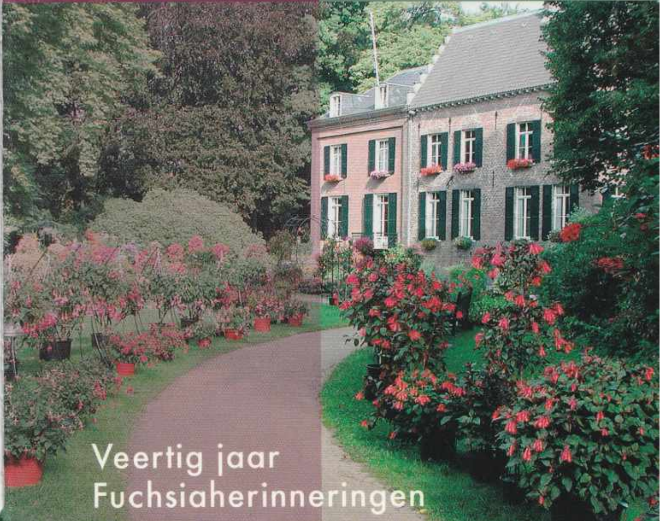
Veertig jaar Fuchsiahерinneringen