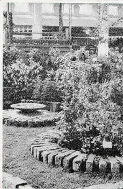
Het "droomtuintje" tijdens NT 1970 te Rotterdam