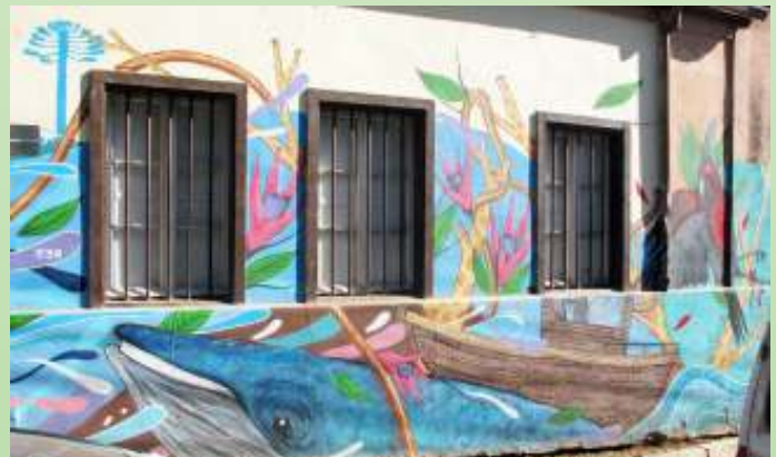
De mythische muurschilderingen getuigen van het oorspronkelijke Chileense volk, de Mapuche, de fuchsia's, de kolibries: de wereld van de Andes.