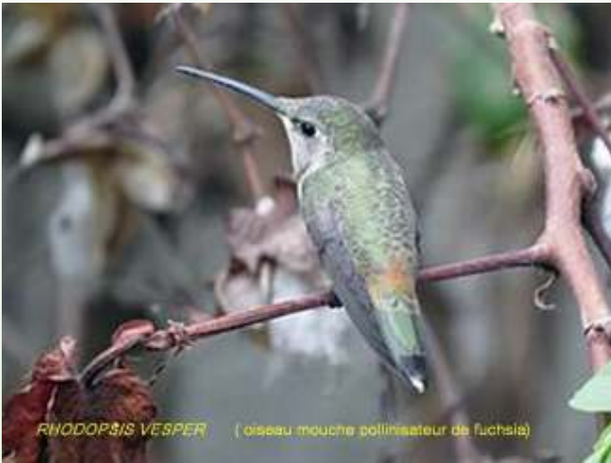
Rhodopsis vesper (deze kolibrie is de bestuiver van F. lycioides )