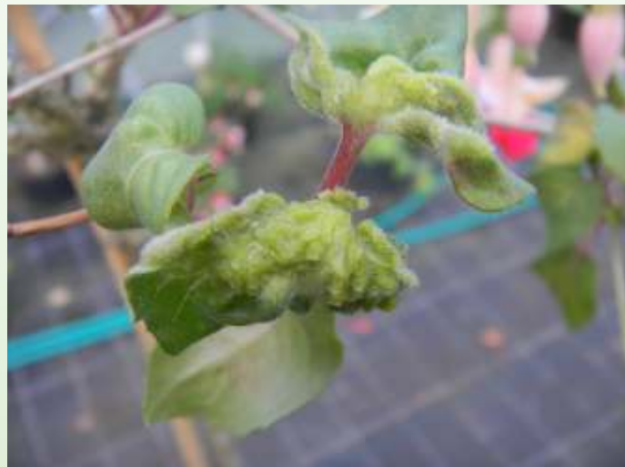
Aantasting van groeipunt door de galmijt. Let op de extreme beharing van het blad, een teken dat u zeker met de galmijt te maken heeft!

De schade die de galmijt onze planten toebrengt wordt meestal in de zomer zichtbaar en dan kunt u het beste als volgt te werk gaan: