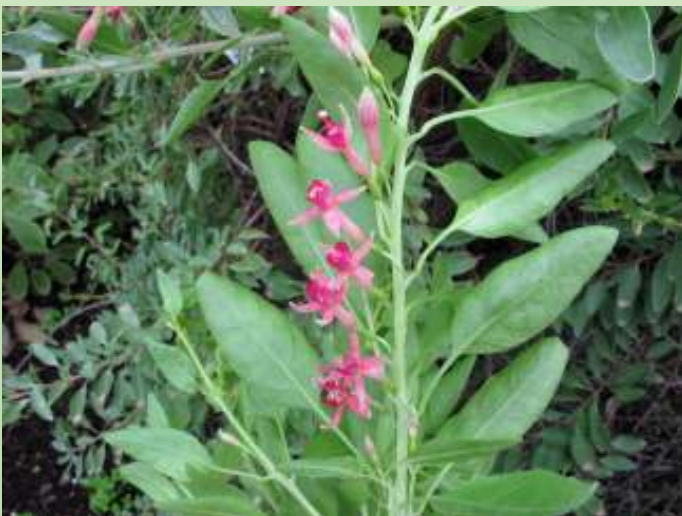
Zonder twijfel tweeslachtige bloemen van F. lycioides . (foto gemaakt in kassen van Chèvreloup)

(red. Alain Leborgne: In het oorspronkelijke verhaal met foto's genomen door Roberto Valenzuela is goed te zien hoe groot de verschillen zijn. Wij hebben hier jammer ge-