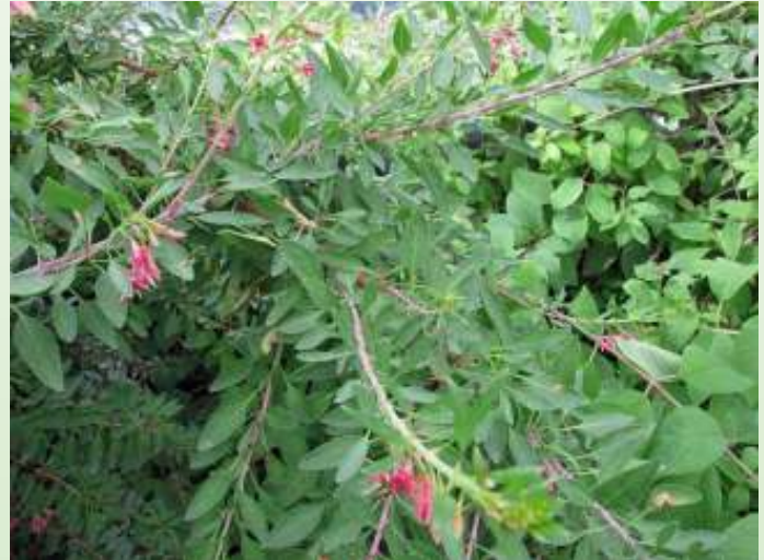
Bloemen en vruchten van F. lycioides (Foto Chèvreloup)

Als 1e voorbeeld was er een 2-slachtige fuchsia F. lycioides met een buitengewoon korte conische bloembuis. De bloembuis en de kelkbladen waren licht rose. 2e voorbeeld: Een foto uit Los Moles van een vrouwelijke F. lycioides met donker rose kelkbladen. En tenslotte in Vina del Mar bij boerderij Vergaran vond Roberto 2-slach-