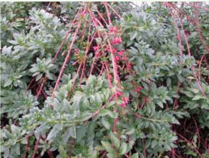
Fuchsia lycioïdes in de kassen van Chèvreloop

Fuchsia lycioïdes , Palo de yegua (Chileense naam)