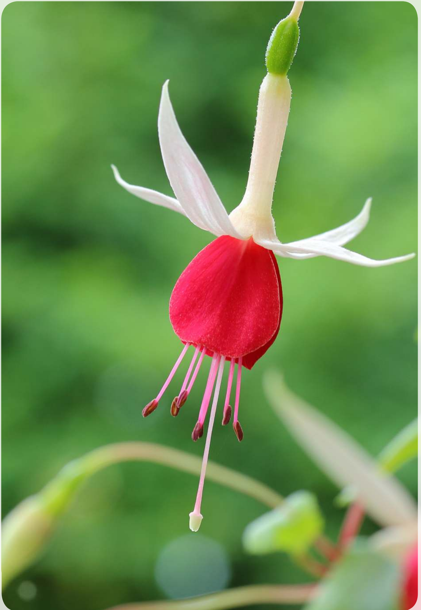
'Land van Beveren'