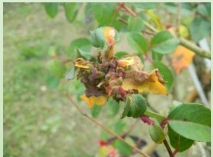
Ernstige aantasting fuchsiagalmijt

fuchsiagalmijt in Nederland sterk in de hand wordt gewerkt en snel zal toenemen. Dat betekent dat we, net als in Amerika, Frankrijk en Engeland waar de overheid al jaren niets tegen deze plaag doet, er mee moeten zien te leven!