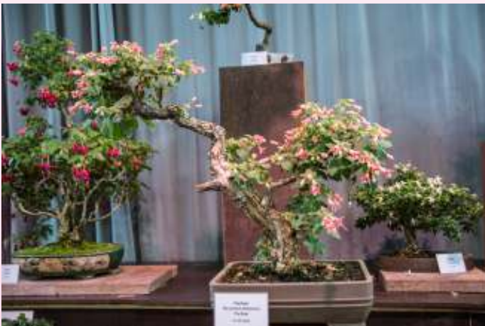
Er waren opvallend veel bonsais op de BUGA fuchsia-tentoonstelling