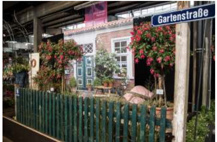
Fuchsia-tentoonstelling in Heilbronn op de BUGA.