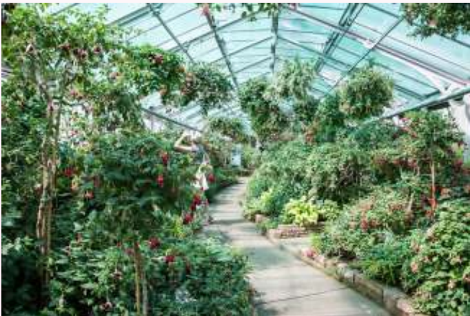
Wilhelma Zoological en Botanischer Garten

Zaterdag 10 augustus was het BUGA-dag met een fuchsia-tentoonstelling en de officiële Euro-Fuchsia-vergadering. De fuchsia-tentoonstelling was anders dan anders opgezet, het thema had kunnen zijn: "Fuchsia's in