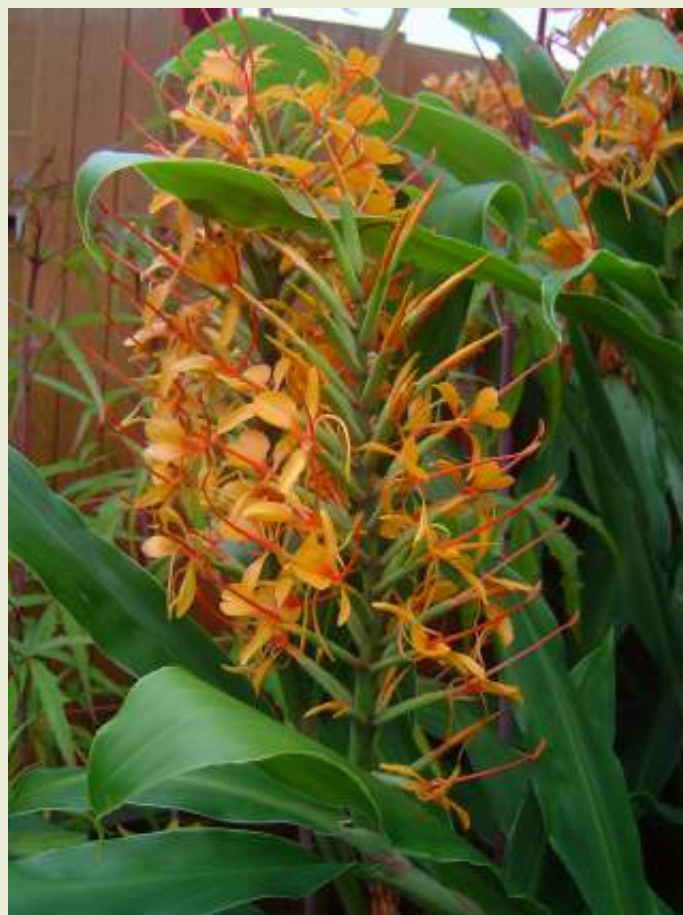
Hedichium coccineum "Tara"