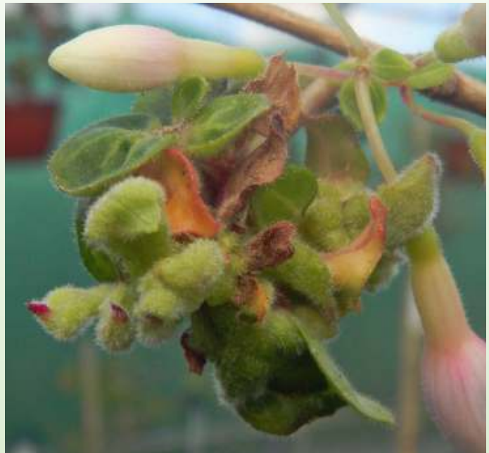
Aantasting fuchsiagalmijt; let op de beharing!

Ik denk het niet. Ik denk dat de verspreiding van de