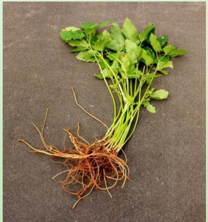
De wortels van zevenblad zijn de schrik van iedere tuinier.

In het Engels komt ook de naam Ground elder voor. Het blad heeft inderdaad wel wat overeenkomst met het blad van de Vlier. Diezelfde herkenning is er in het Duits met de namen Wiesenholzer en Bodenholunder (Holler of Holunder betekent vlier).