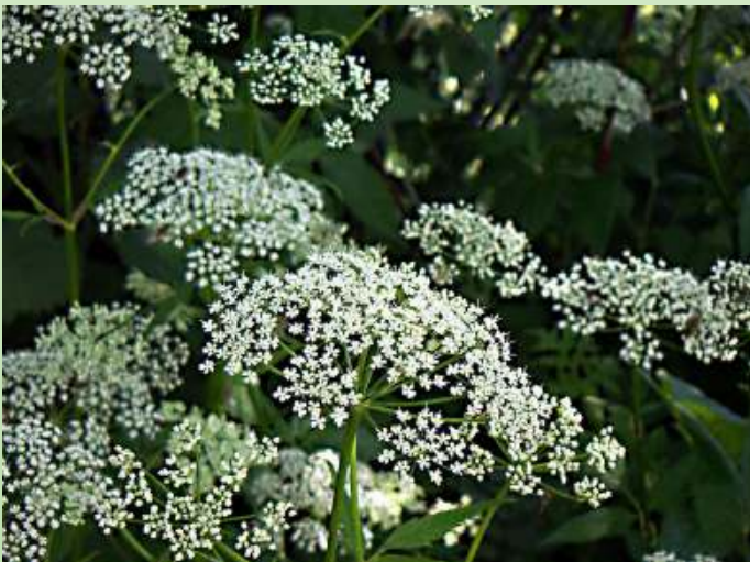
Bloeiwijze van zevenblad