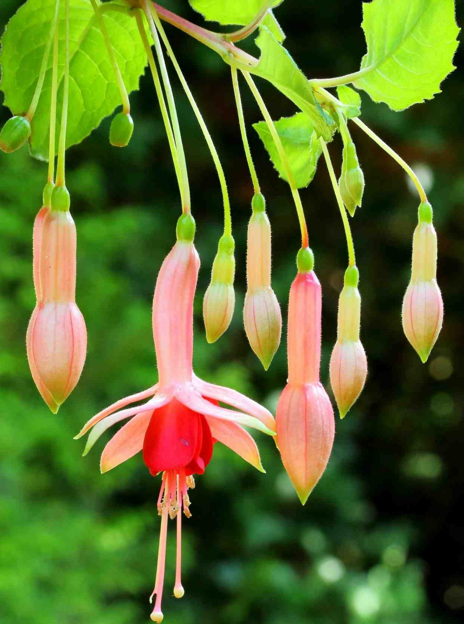
'Belle de Spa'