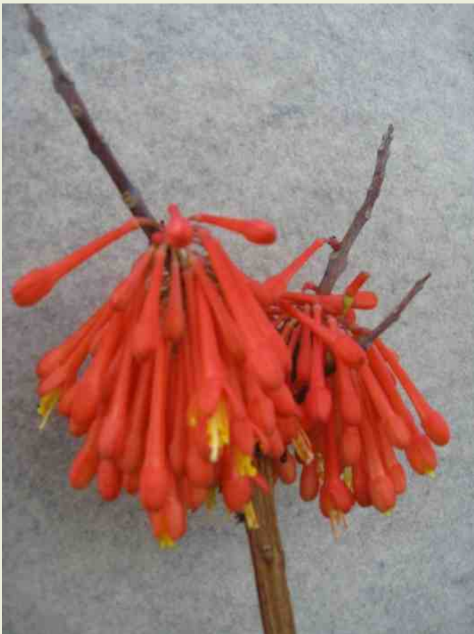
Fuchsia decida ; Deze fuchsia uit Mexico heeft wel een kroontje en is nu ingedeeld bij de sectie ELLOBIUM .

De leden van de sectie Hemsleyella zijn moeilijk te bestuderen omdat de al zeldzame planten gewoonlijk sterk seizoengebonden zijn en groeien op moeilijk bereikbare