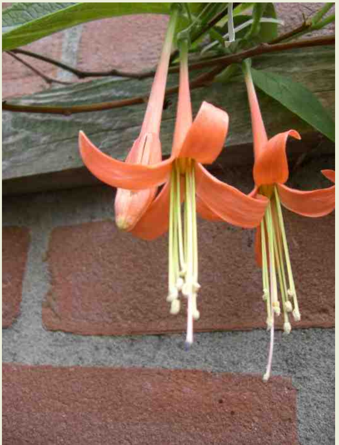
Fuchsia insignis een kroonloze fuchsia species