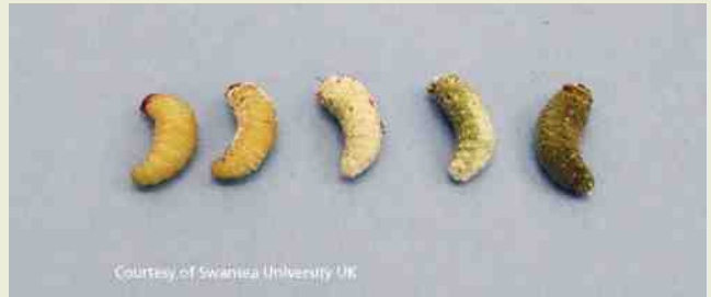
Stadia waarin de larven in de potgrond gevonden worden.

En de taxuskever zelf. Ook die is te bestrijden. Je kunt ze 's avonds gaan zoeken. Er zijn vallen met aaltjes die de kever aantasten maar prijzig. Maar zolang het in de tuin van de buurman drie huizen verder wemelt van de taxuskevers blijft het een ongelijke strijd. Je moet er in ieder geval voor zorgen dat alle taxuskevers tussen mei en september verdwenen zijn en ook niet vanuit de tuin van de buurman weer in de tuin komen. Misschien is er hoop. Er zijn onderzoekers bezig een geurstof te ontwikkelen die taxuskevers aantrekt. Als dat lukt, is er misschien perspectief dat alle kevers in de tuin op één plek verzamelen zodat ze kunnen worden vernietigd.