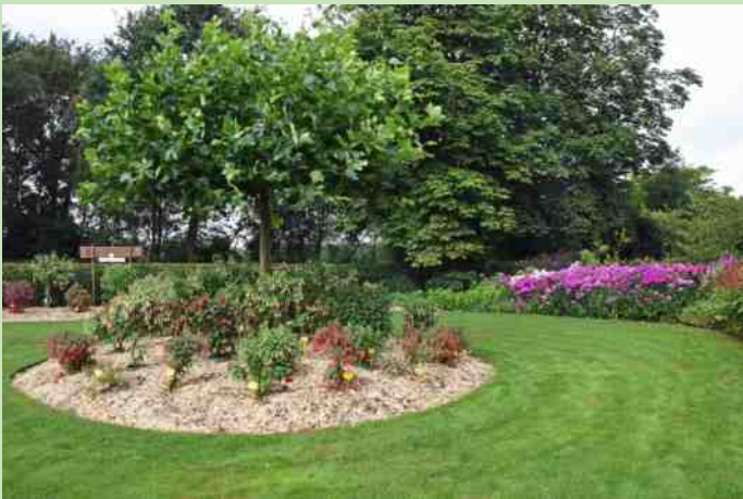
Open tuin fam. Davelaar in Voorthuizen