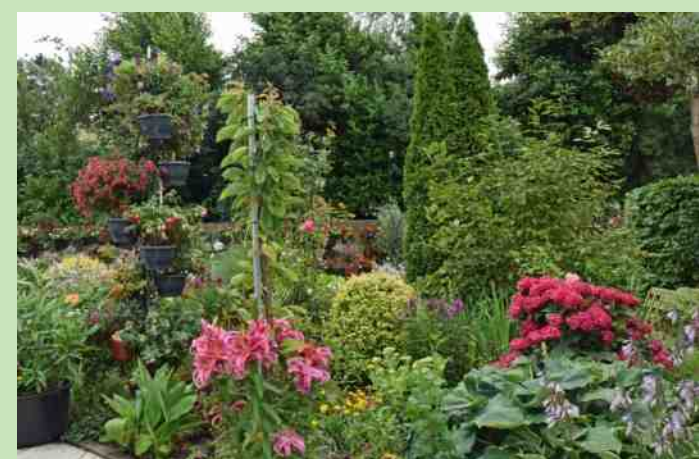
Open tuin fam. van den Bos in Nootdorp