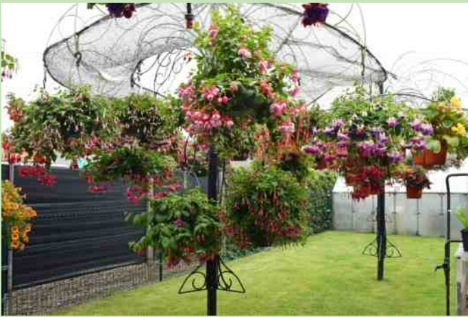
Open tuin fam. Leenhouts in Dussen