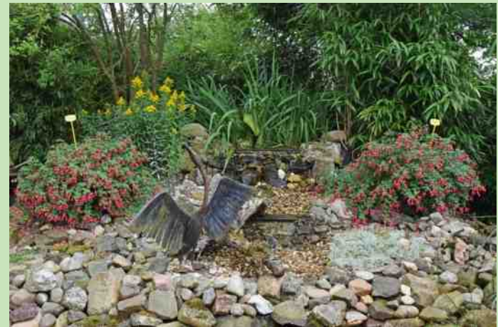
Open tuin fam. Davelaar in Voorthuizen