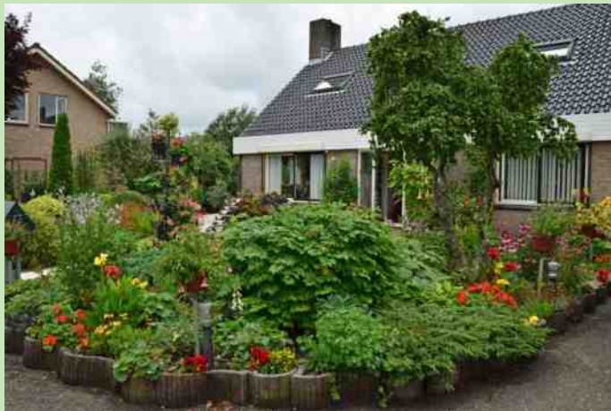
Open tuin fam. van den Bos in Nootdorp