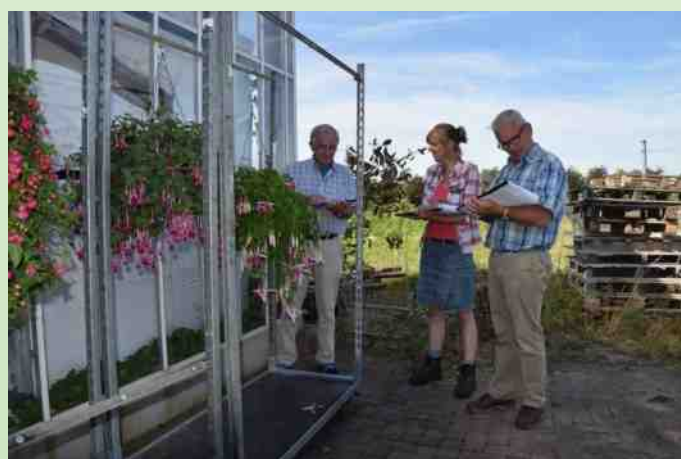
De jury hard aan het werk.