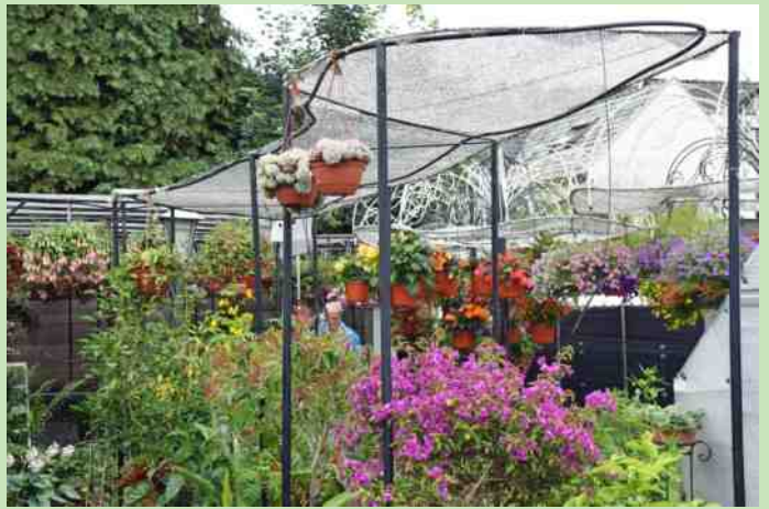
Open tuin fam. Leenhouts in Dussen