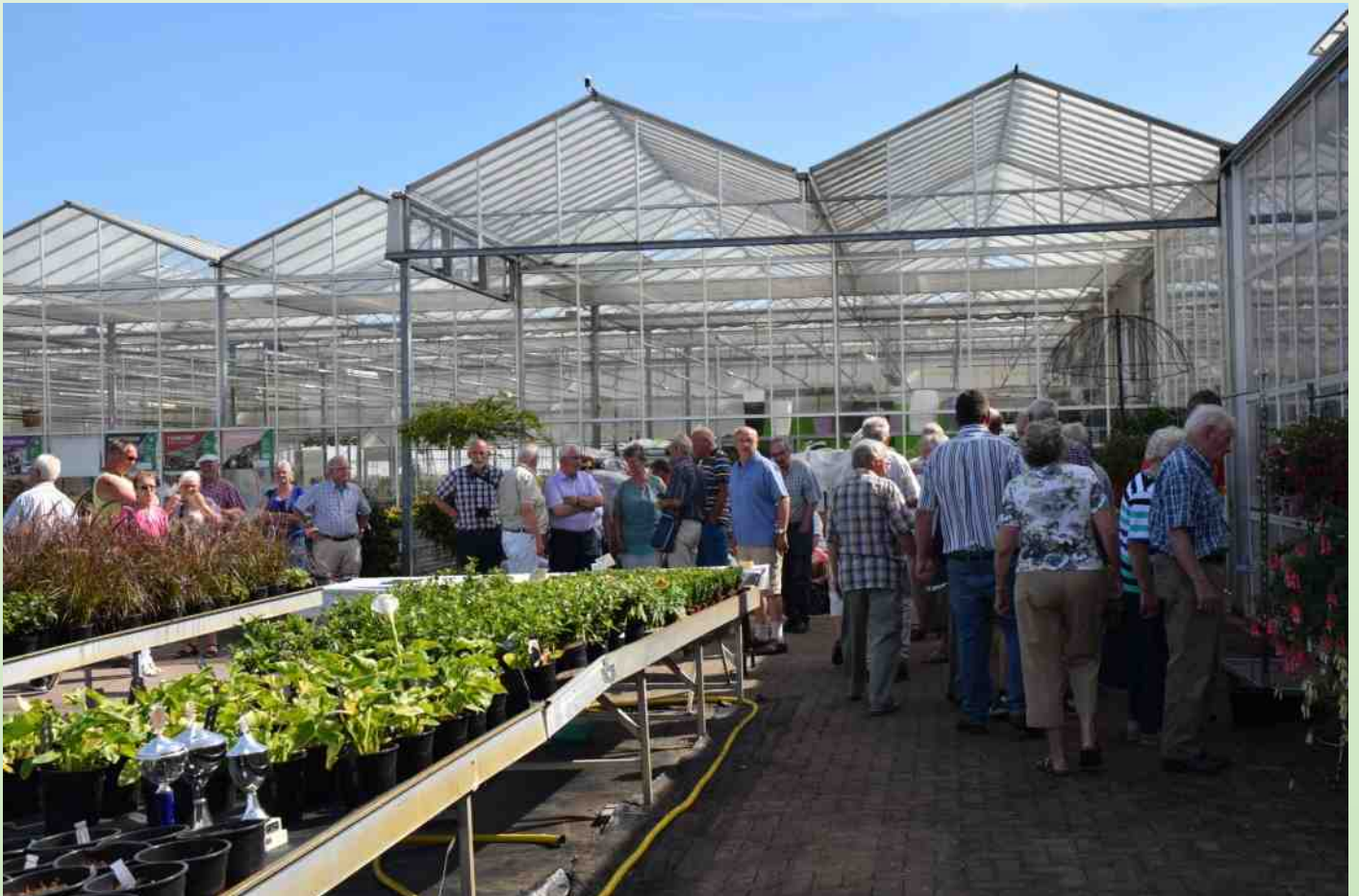
Veel belangstelling voor de wedstrijdplanten.