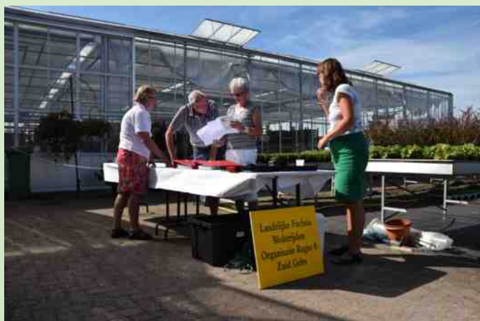
Het team van regio 8.