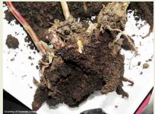
Larven zijn begonnen aan de wortels te vreten.

Overigens wordt BIO 2010 in Nederland vooral in de containerteelt veelvuldig gebruikt. Ook in Engeland, waarvan de geïmporteerde containers bekend stonden om het feit dat ze wemelden van de larven, wordt het middel op grote schaal gebruikt.