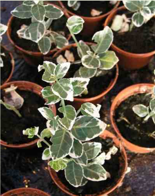
Vraat van de taxuskever. Er zijn stukjes uit de bladrand gevreten.

Er zijn ook aaltjes in de handel tegen de larven van de taxuskever. Niet goedkoop maar wel effectief als je de hele tuin er mee bewerkt.