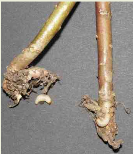
Een niet meer te redden aangetaste plant.

Door zoeken op internet kwamen we er achter dat het middel BIO 1020 bestond. Na verder zoeken kwamen we er achter dat een firma in Brabant het middel, gemengd door compost, in de handel bracht.