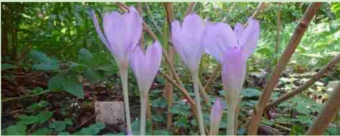
Herfsttijloos, Colchicum autumnale .

In de reeks rare jaren van de laatste tijd is het jaar waar we nu mee te maken hebben wel hoogst opmerkelijk. Achteraf weet ik dat het het eerste jaar was waarin ik mijn fuchsiacollectie beter buiten had kunnen laten staan. Dat had ook heel wat zweetdruppels gescheeld. De planten die als gewoonlijk in de kelder met kunstlicht overwinterden hebben zich normaal gedragen, maar de hangers uit de vrijwel niet verwarmde kas hebben, toen ze in het voorjaar weer buiten kwamen, deels staan kwarren. Maar wat wil je in een jaar waarin rozen, druiven en zelfs hydrangea's zich ondanks de hoge temperaturen ook niet prettig voelen. En toen kwamen deze zomer de weken met aanvoer van polaire lucht.