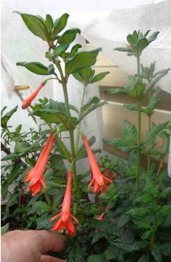
F. cinerea doet het ook erg goed