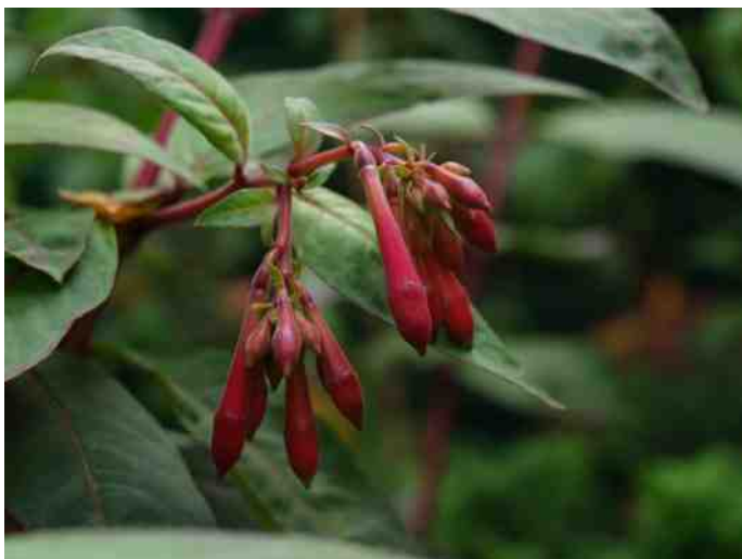
Fuchsia macropetala in knop

F. macrophylla is een opgaand tot klimmend struikje van 1-3 m hoog, met breed uitgroeiende zijtakken. De jonge twijgen zijn zacht behaard. De bladeren zijn tegenoverstaand tot drietallig, smal elliptisch tot ovaal. De onderste bladeren zijn groter dan de