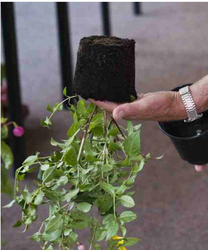
Keuren van het wortelgestel

Planten die geen goedkeuring hadden werden destijds niet opgenomen in de lijst van de NKvF en de AFS, totdat de heer Stoel in 1993 aantoonde dat inschrijving bij de AFS altijd mogelijk was. Hij vroeg inschrijving aan bij de AFS omdat een niet goedgekeurde plant, 'Zets Alpha' ( F. vulcanica x Citation), waar hij vooraf al de felicitaties voor kreeg, werd afgekeurd. De uitleg van de keurmeesters was dat F. vulcanica bijna niet bloeit. Dit schoot bij de altijd rustige heer Stoel schijnbaar in het verkeerde keelgat. Ik heb de planten op de keuring zelf gezien en het waren prachtige planten. Er is toen veel veranderd. Afgekeurde planten, die eerst bij kwekers geveerd werden op advies van de NKvF, werden vanaf toen wel in de catalogi opgenomen bij kwekerijen. Veel veredelaars lieten hun planten toen niet meer keuren of brachten afgekeurde planten wel in