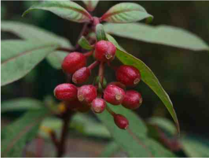
Fuchsia macropetala : Bessen