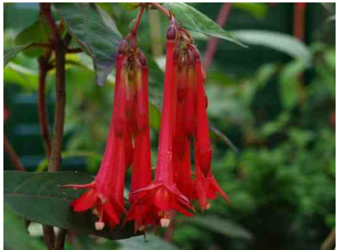
Fuchsia macropetala in bloei

bovenste. Tot 27 cm lang en 9 cm breed. Hij bloeit niet heel rijk aan korte zijtakken. De bloemen zijn totaal zo'n 3,5 cm lang. De buis en kelkbladen zijn rood met groene punten, de kroon is scharlaken-rood. De bessen zijn kort, 13 mm en 9 mm dik, en worden glanzend donker paars.