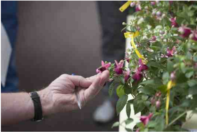
Keuring op nieuwigheid