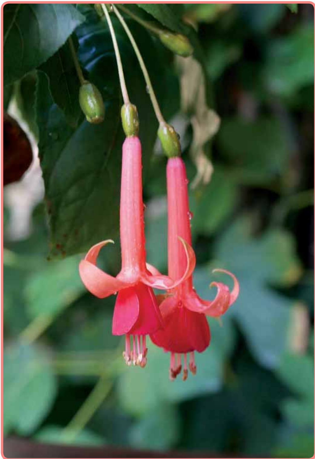
'Earl of Beaconsfield'