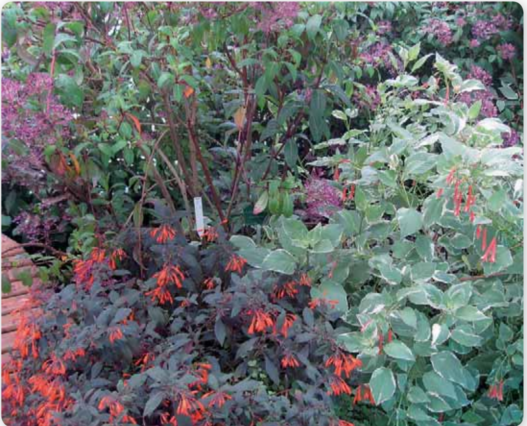
Foto 3 : Op de voorgrond F. triphylla en F. fulgens variegata en daarachter F. paniculata .

Voor ons was natuurlijk de botanische fuchsiacollectie van belang. De collectie van Margam Park (Fuchsia Research International) is vorig jaar overgebracht naar Chèvreloup en er was ook een aantal species te zien, dat in Peru, Ecuador en Venezuela zijn verzameld. De plastic