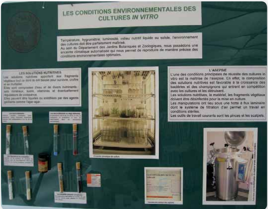
Foto 4: Door middel van weefselweek probeert men materiaal uit Zuid-Amerika in stand te houden en te vermeerderen.

Ter plaatse werden voor de gelegenheid botanische fuchsia's te koop aangeboden en we hebben daar interessant materiaal voor onze botanische groep kunnen bemachtigen, zoals F. cestroides , F. venusta , F. venusta x F. membranacea (natuurlijke hybride) en een nog onbekende niet op naam gebrachte species, door de fransen F. inconnu (= F. onbekend) genoemd. Ook van die laatste hebben we een plant gekocht; het is een plant met bloemen, die op F. juntasensis lijken, zonder kroonbladeren, dus tot de Hemsleyella -sectie behorend, maar met mooi blad en niet zo wild groeiend. Inmiddels is het materiaal met succes gestekt en wordt nu onder leden van de botanische groep verspreid.