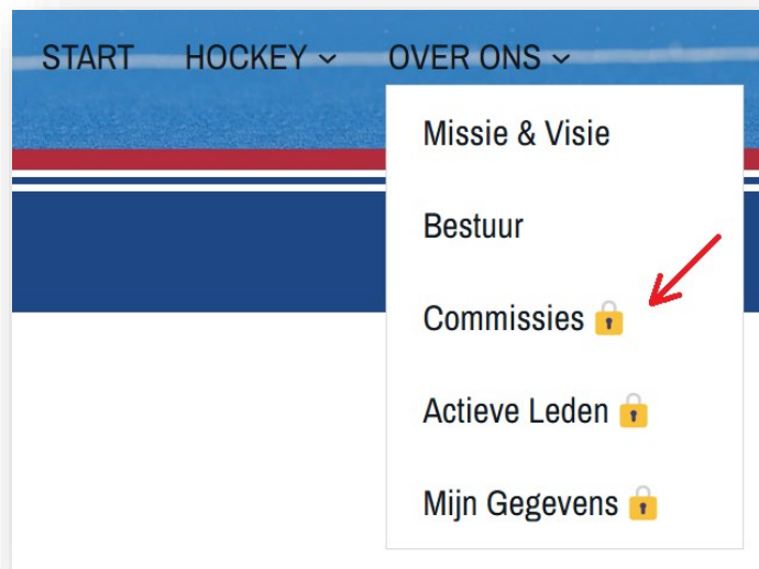
Figuur 1: Menu op de website met pagina's alleen voor leden