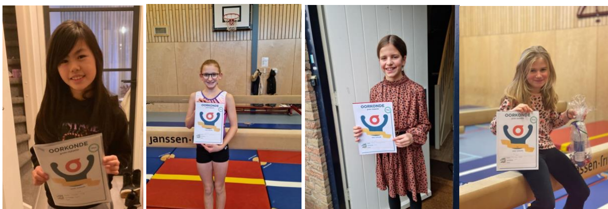
Figuur 7. Winnaars grote clubactie