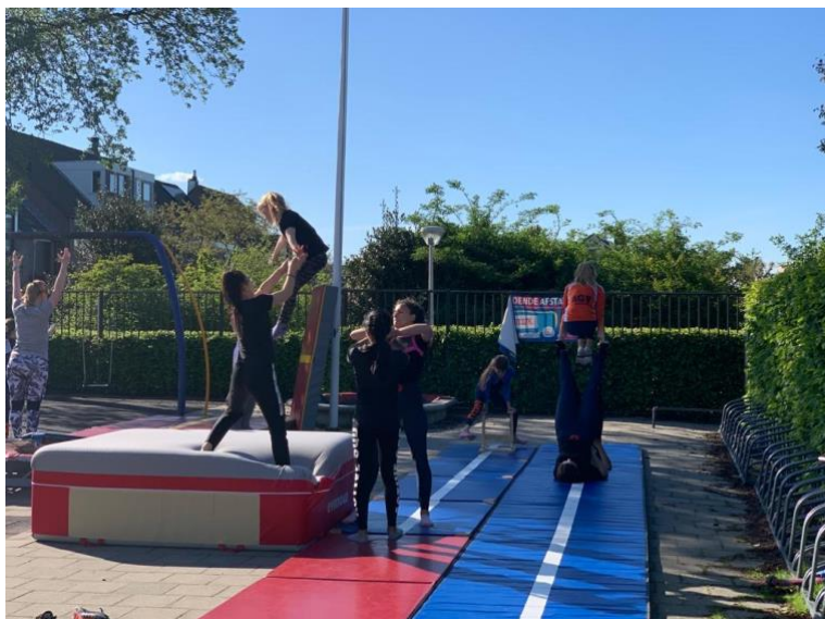
Figuur 9. Trainingen op het schoolplein