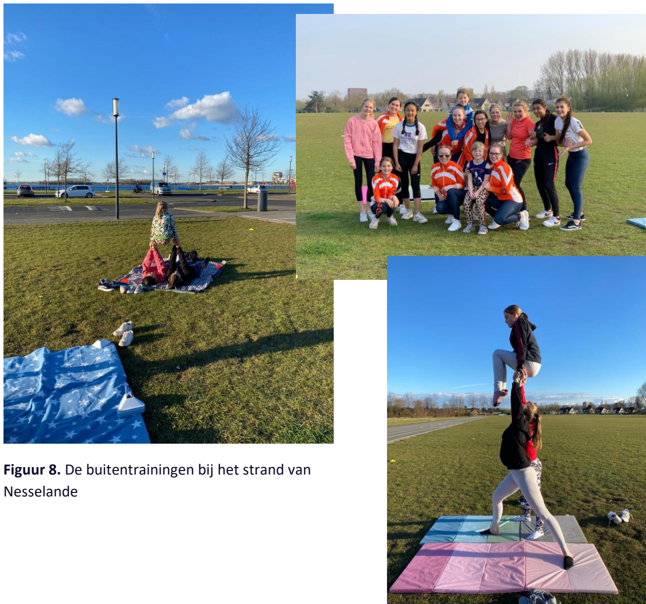
Figuur 8. De buitentrainingen bij het strand van Nesselande

Momenteel zitten we midden in het wedstrijdseizoen, wat gelukkig wel door kan gaan dit jaar. Het harde werk van de meiden van afgelopen jaar, wordt eindelijk beloond met leuke wedstrijden. En ze doen het super!