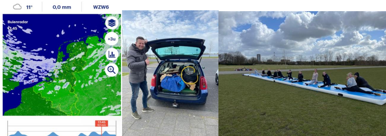
Figuur 2. Sporten m.b.v. de buienrader in Rotterdam Nesselande bij de Zevenhuizerplas

Eind april kon op het schoolplein aan de van Beethovenlaan getraind worden waarbij andere toestellen, waaronder de evenwichtsbalk, weer tevoorschijn gehaald konden worden. Vanaf mei was het binnensporten weer mogelijk mits geldende corona maatregelen in acht werden genomen. In het najaar werden opnieuw maatregelen afgekondigd. Vanaf 28 november mocht er maar tot 17.00 uur gesport worden. Voor deze periode is voor alle groepen een alternatief rooster opgesteld (figuur 3). In hoofdstuk 2 staan een aantal afzonderlijke verslagen vanuit een aantal groepen.