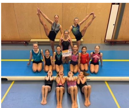
Figuur 6. Opbrengst Grote Club Actie