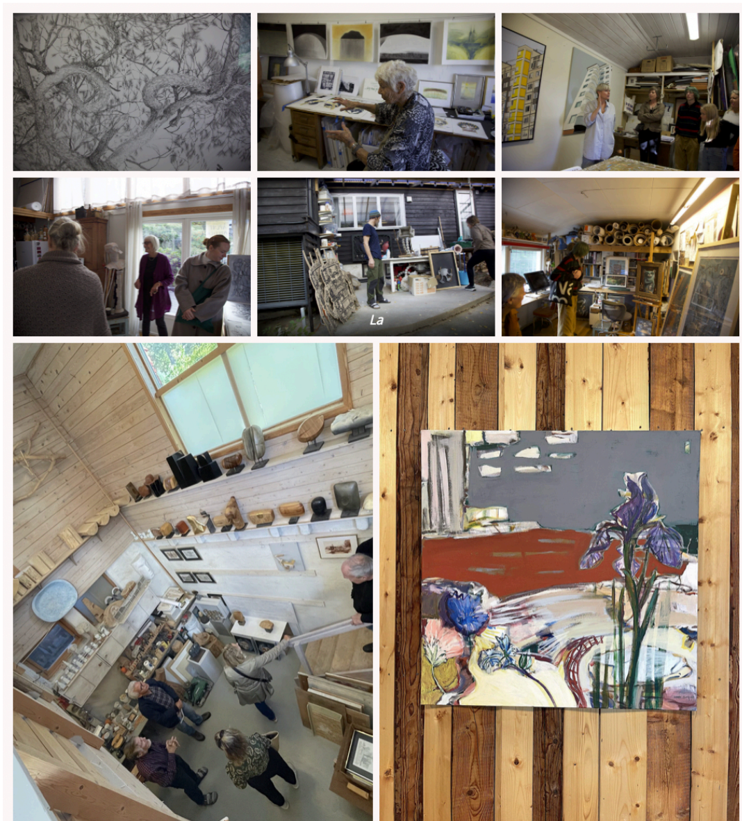
Foto: Tegning av Hedvig Llen Rytter, Ingrid Ousland atelier, Lise Steingrim atelier, to bilder fra Lars Aurtande atelier, Nils Aasland atelier og maleri av Unni Svaboe på Naustet.

Takk for et godt år! Hilsen styringsgruppen.