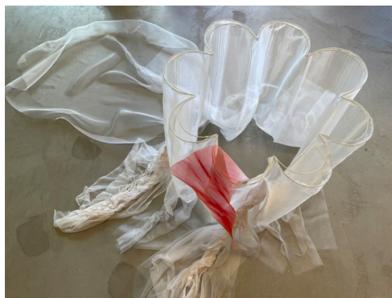
Foto av Veronica Cheann's arbeider under Nesodden Åpne Atelier 2022

Nesodden Kunstnere mottok i 2022 kr. 50 000,- fra Nesodden Kommune til å gjennomføre Kunstfestival og utvikle tilhørende KunstHub.