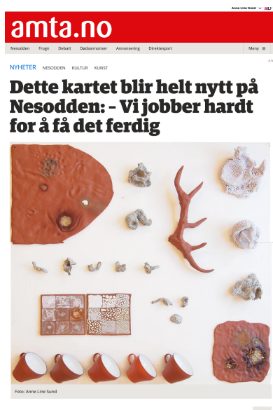
Nå jobber Nesodden Kunstnere på sprenget for å få ferdig det helt nye kartet som skal hjelpe alle kunstnere på Nesodden.

Pressearbeid Med hensyn til Åpne Atelier startet på forsommeren, med nær kontakt og oppfølging i særdeleshet med Amtas journalister. Artikkel kom både i Amtas digitale utgave og i Papiravisen.