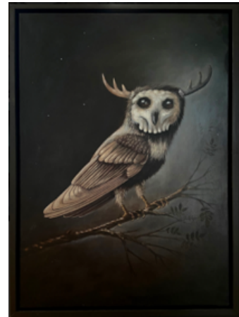
Lars Aurtande, maleri

NESODDEN KUNSTNERE KUNST OG KUNSTNERE PÅ NESODDEN