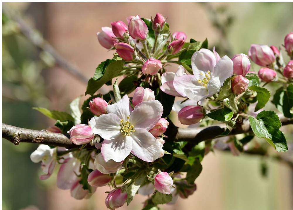
Billedtekst: Blomstrende æblegren