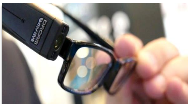
Billedtekst: Billede af OrCam MyEye placeret på HØJRE SIDE af brillestellet.

Okay, der er altså blevet arbejdet i kulissen og vi kan nu præsentere en ny måde at bruge OrCam på, men også en ny måde at bestille den på. Lad os starte med det sidste: