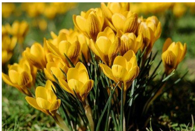
Billedtekst: Gule krokusblomster

Kontaktinformationer: Vores e-mailadresse er info@instrulog.dk . Du kan også ringe på telefonnummer 44 97 94 77. Vi har telefontid mandag til torsdag fra klokken 08:30 til 14:00 samt fredag fra klokken 08:30 til 13:00. Vores kontor, hvor vi også har et showroom med vores produkter, er beliggende i Rødovre, på Bjerringbrovej nummer 116. Ring og aftalt en tid, så finder vi den helt rigtige løsning til dig.