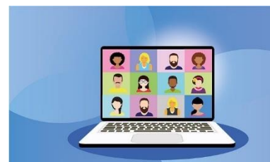
Billedtekst: Computerskærm med mange onlinemøde

Har du spørgsmål, er du velkommen til at kontakte os.