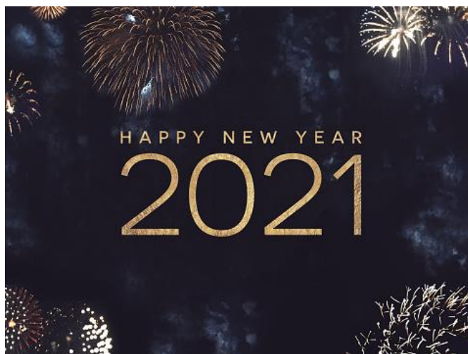
Billedtekst: Nytårsfyrværkeri med tekst happy new year 2021