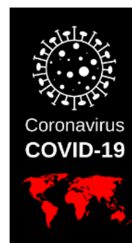
Billedtekst: Billede med Coronavirus - COVID-19

En ny dato vil blive annonceret så snart samfundet åbner op igen. Vi håber, at der er forståelse for denne beslutning.