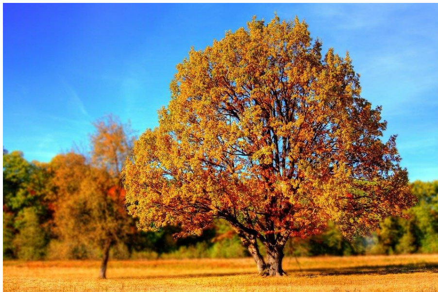
Billedtekst: Træer på en mark i efterårsfarver

Husk du har altid mulighed for at komme i kontakte nedsatsyn.dk. Vores telefon er åben tirsdag og fredag mellem kl. 10 og 14. Ringer du udenfor dette tidspunkt er du velkommen til at lægge en besked og vi ringer tilbage snarest muligt. Du er selvfølgelig også velkommen til at sende en e-mail på nedsatsyn@gmail.com