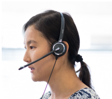
Foto: kvinde med telefon headset

Efter at have besøgt All Ears et par gange mere, blev jeg kun endnu mere positivt overrasket. Jeg må ærligt indrømme, at jeg havde frygtet, at All Ears ville være en ”blindearbejdsplads”. Men selvom de gør en stor indsats for at skabe arbejdspladser for mennesker med synshandicap, arbejder der også mange uden nedsat syn. Der er folk i alle aldre, personlighedstyper og ikke mindst synsstyrker, og folk har alle mulige forskellige uddannelses- og erfaringsmæssige baggrunde.