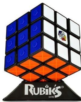
Billedtekst: Billeder af Rubiks Touch Cube

Se meget mere på www.vidata.dk - Mail: support@vidata.dk - telefon: +45 42 72 14 79 - Facebook side: http://facebook.com/vidata.dk