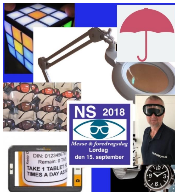
Billedtekst: nogle af præmierne

Der vil også være 5 medlemskaber i Nedsatsyn.dk på spil. Værdi 5 x 200 kr.