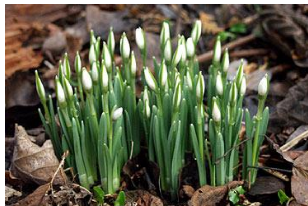
Billedtekst: Billede af vintergækker

Vi i Nedsatsyn.dk er også lidt kåde, snart bliver vores første arrangementer til virkelighed.