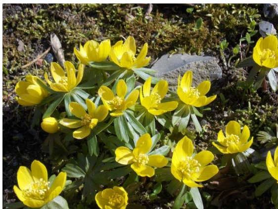
Billedtekst: Billede af erantisblomst

Kan kun opfordre dig til at tilmelde dig hurtigst muligt , der er begrænset deltagere antal og med den store forhåndsinteresse bliver der rift om pladserne. Se hvordan du tilmelder dig på næste side og følg med på vores hjemmeside www.nedsatsyn.dk her vil det færdige program ligge. Du kan også følge med på Facebook nedsatssyn.dk.