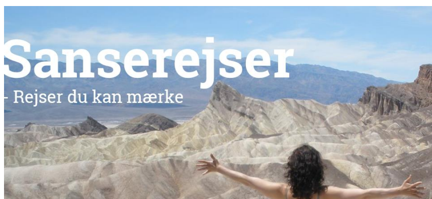
Billedtekst: Billede af Sanserejser

Sanserejser er et helt nyt koncept og en ny måde at rejse på. Sanserejser er en nystartet virksomhed, med en vision om, at tilbyde spændende og eventyrlige grupperejser hvor seende, svagtseende og blinde kan mødes og dele rejseoplevelser.