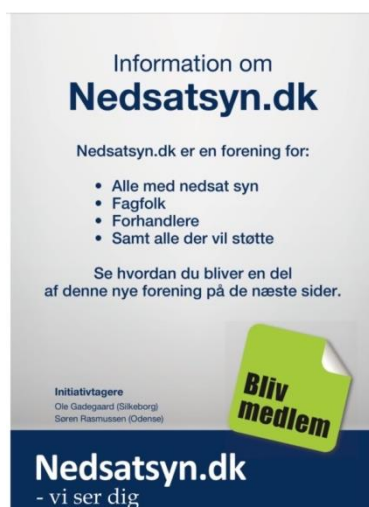
Billedtekst: Billede af folder

Kunne du tænke dig at lægge nogle foldere hos lægen, øjenlægen, biblioteket, sportsklubben osv., så skriv en mail til kontakt@nedsatsyn.dk og vi sender dig en stak foldere.