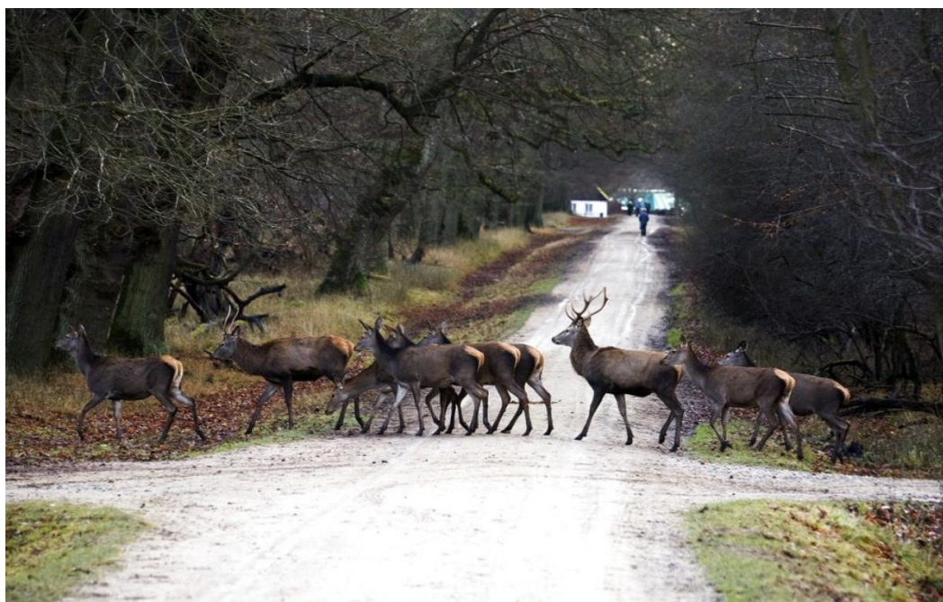
Billedtekst: billede fra Dyrehaven

Budskabet med dette arrangement vil være at vise vores omgivelser, at blinde og svagsynede også har mulighed for at komme ud og nyde naturen, hvis de har en førerhund eller følges med en ledsager. Der vil være et mindre deltagergebyr som går til dækning af arrangementets udgifter.