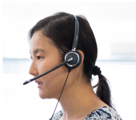
Foto: kvinde med telefon headset

Efter at have besøgt All Ears et par gange mere, blev jeg kun endnu mere positivt overrasket. Jeg må ærligt indrømme, at jeg havde frygtet, at All Ears ville være en ”blindearbejdsplads”. Men selvom de gør en stor indsats for at skabe arbejdspladser for mennesker med synshandicap, arbejder der også mange uden nedsat syn. Der er folk i alle aldre, personlighedstyper og ikke mindst synsstyrker, og folk har alle mulige forskellige uddannelses- og erfaringsmæssige baggrunde.