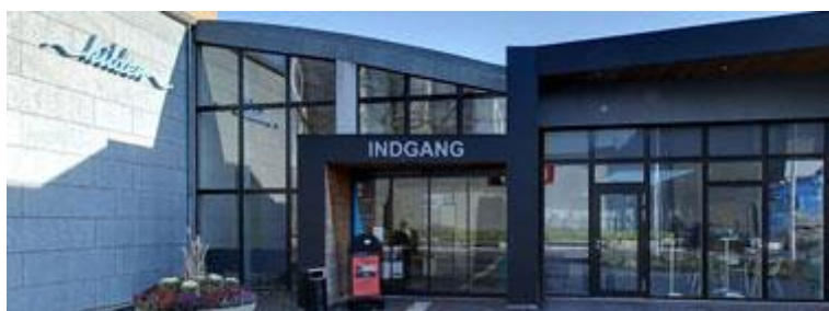
Billedtekst: Kulturhuset Kilden

Mere information i kommende nyhedsbreve.