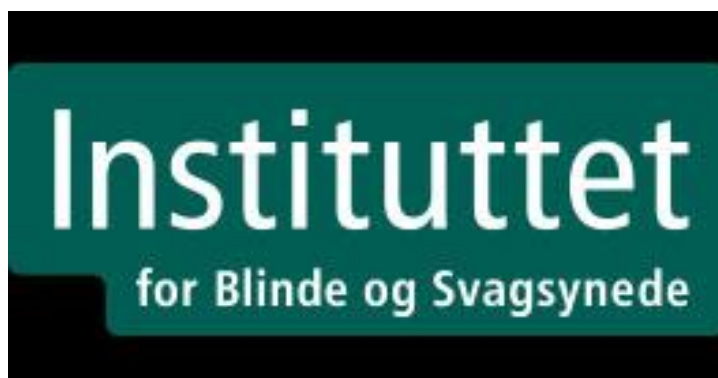
Billedtekst: Logo Instituttet for Blinde og Svagsynede

Der vil også være mulighed for at købe mad og drikke, og nyde musikalsk underholdning af musikere med synshandicap.