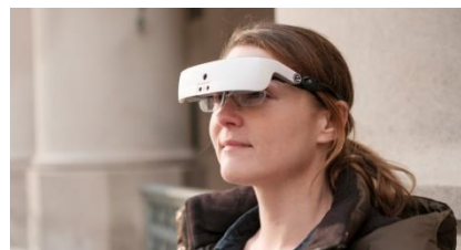
Billedtekst: eSight brille

eSight er et svagsynsteknologisk gennembrud, der gør det muligt for mange svagtseende at udnytte restsynet til rent faktisk at se mere igen.