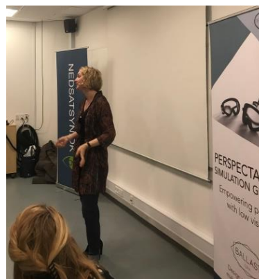
Billedtekst: Billede af foredragsholdere