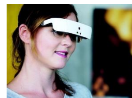
Billedtekst: eSight briller

Foreningen Nedsatsyn.dk inviterer til Inspirationsaften i Borgernes Hus i Odense, som ligger ved siden af Odense Banegård. Arrangementet er gratis. Tilmelding er nødvendigt pga. af begrænset antal pladser. Tilmelding på mailadressen: