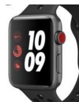
Billedtekst: Apple Watch

For mig er Apple Watch et fuldt tilgængeligt smart watch, som jeg tror rigtig mange med nedsat syn kunne have stor glæde af.