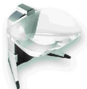
Scribolux Art.. Nr. 156512