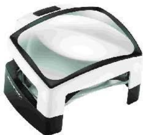
Visolux Art. Nr 1566