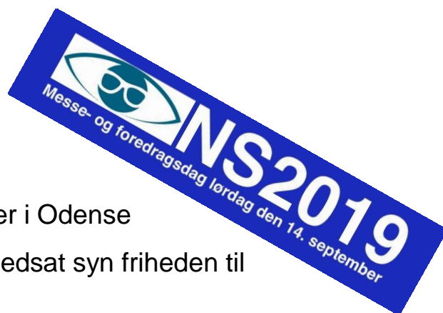
Billedtekst: Logo NS2019