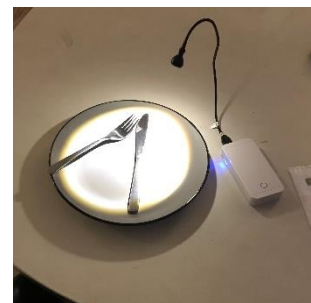
Billedtekst: Tallerken med mobil lampe

Mobil lampe Har du brug for en lille handy lampe når du fx skal i byen og spise? Det kan gøres rimelig nemt og billigt. Du skal bruge en powerbank, som er et ekstra batteri som man kan lade fx mobiltelefoner med. Udover en powerbank, skal du bruge en usb lampe. En lille lampe som lyser når den sættes i et USB stik. Sådanne lamper kan købes mange steder. I IKEA koster den på billedet 29 kr. Hvor lang tid lampen kan lyse, kommer an på batteriets størrelse.