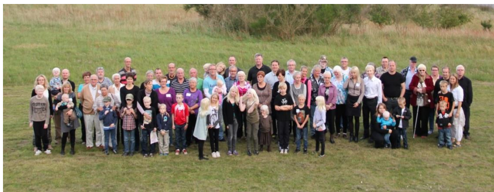
Billedtekst: Logo og Gruppebillede af medlemmer

For den type albinisme der findes i både hud, hår og øjne er de typiske karakteristika det lyse hår og meget lyse hud, mens personer med den form, der kun sidder i øjet har normal hår- og hudfarve. Men for begge former betyder manglen på pigment i øjnene, at personen er svagtseende, ofte har nystagmus og er meget lysfølsom. Personen har sin normale øjenfarve - modsat hvad der ses i dyreverdenen - men mangler pigment i både regnbuehinde og nethinden. Derfor kommer der for meget lys ind i øjet, så mennesker med albinisme har ofte solbriller på udendørs, også selv det er overskyet. Den største udfordring er naturligvis, at sygdommen medfører, at personen er svagtseende eller stærkt svagtseende. Vi har derfor et stort behov for at bruge forskellige former for hjælpemidler i hverdagen og bruger vores forening til at dele tips og tricks om, hvordan hverdagen som svagtseende bliver lettere. Men da vi er en lille forening, håber vi, at vi igennem NedsatSyn vil kunne dele erfaringer med langt flere mennesker i Danmark, som har nogle af de samme udfordringer som os. Vi ser derfor frem til et spændende netværk med både andre foreninger og forhandlere, da dette virkelig har manglet i Danmark.