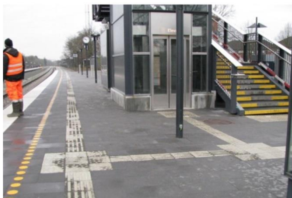
Billedtekst: Perron med ledelinjer

Tilgængelighed for alle er vigtigt, så det er noget vi i Nedsatsyn.dk vil arbejde videre med.