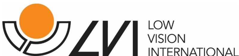
Billedtekst: LVI logo