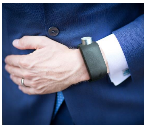
Figur 1 - Hånd med Sunu Band om håndleddet.

Rejs verden rundt med Sunu Band som tilbehør til Din Hvide Stok eller sammen med din førerhund! Sunu Band er udstyret med en ultralydssensor der registrerer fysiske forhindringer foran dig. Det betyder at du langt nemmere og langt mere sikkert kan navigere rundt, både udenfor og indenfor, netop fordi Sunu Bands ultralydssensor opdager fysiske objekter, også i hovedhøjde.