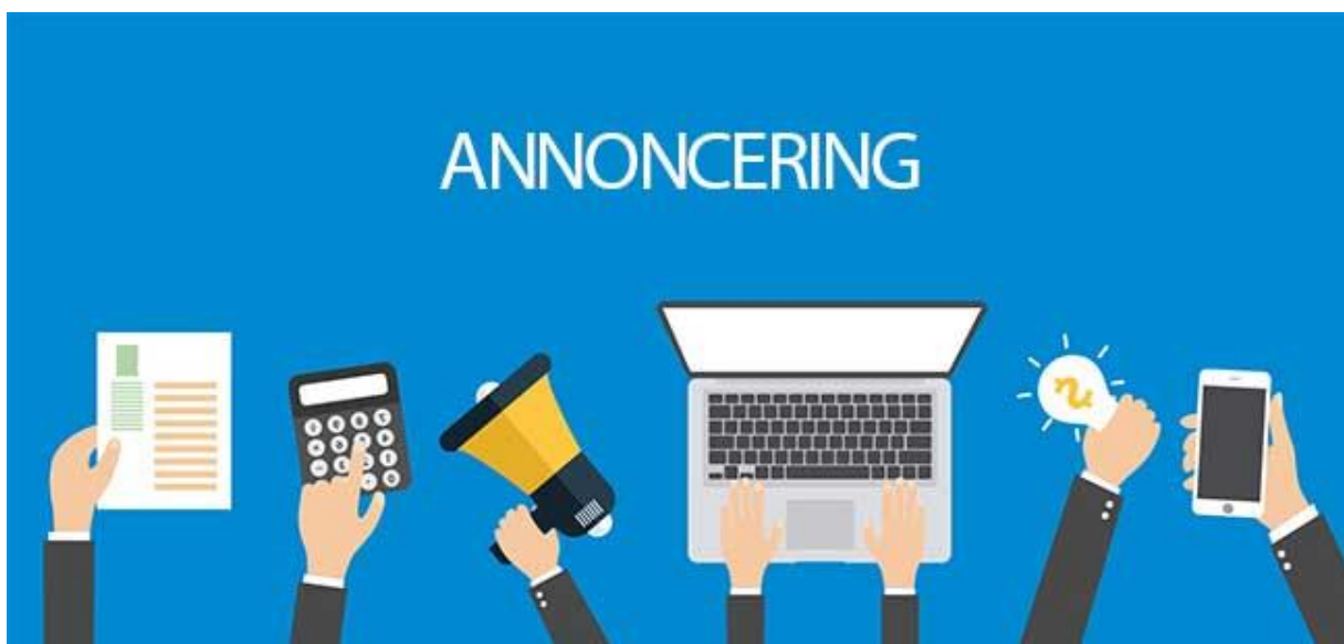
Billedtekst: Annoncering på forskellige måder