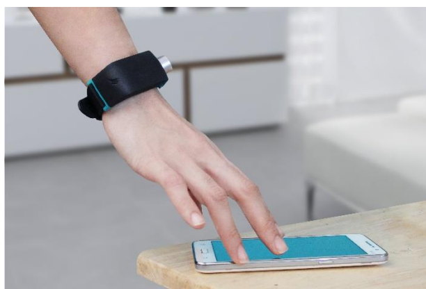
Figur 2 - Hånd med Sunu Band bruger iPhone

Sunu Band er et armbånd. Et diskret armbånd specielt designet til blinde og svagtseende, fyldt med herlig elektronik. Armbåndet består af en rem og en overflade, præcis ligesom et helt almindeligt armbånds-ur. Her stopper sammenligningen da også.