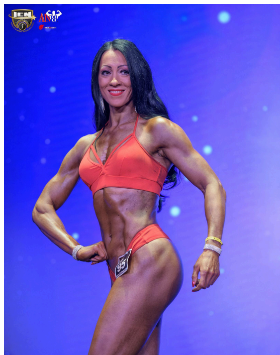
Side quarter turn pose