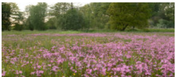
Heikant - Wim Verschraegen

Onze memoranda vind je terug op onze website: https://www.natuurpuntmarkvallei.be/over-ons/beleid/