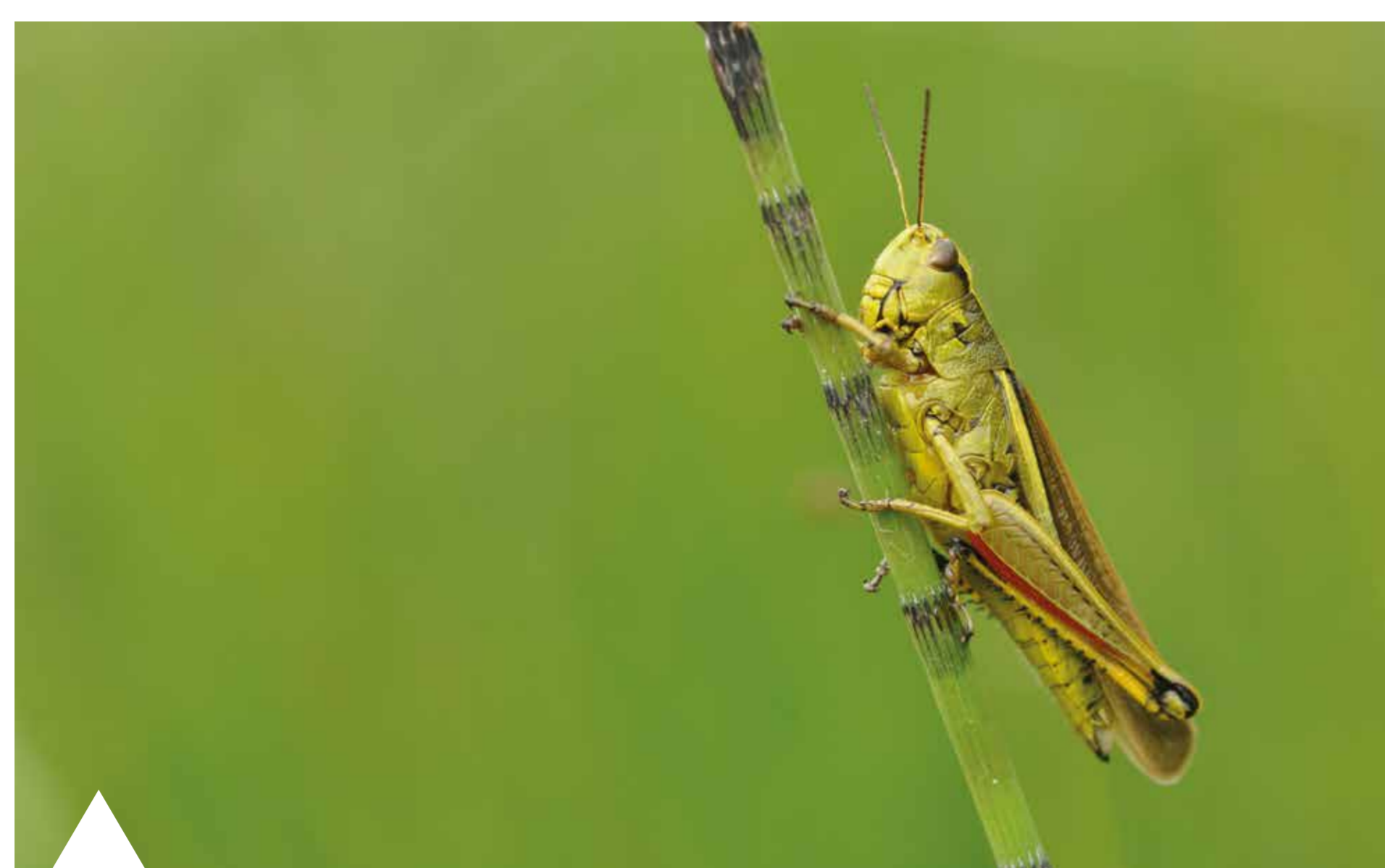
Moerassprinkhaan Wim Verschraegen