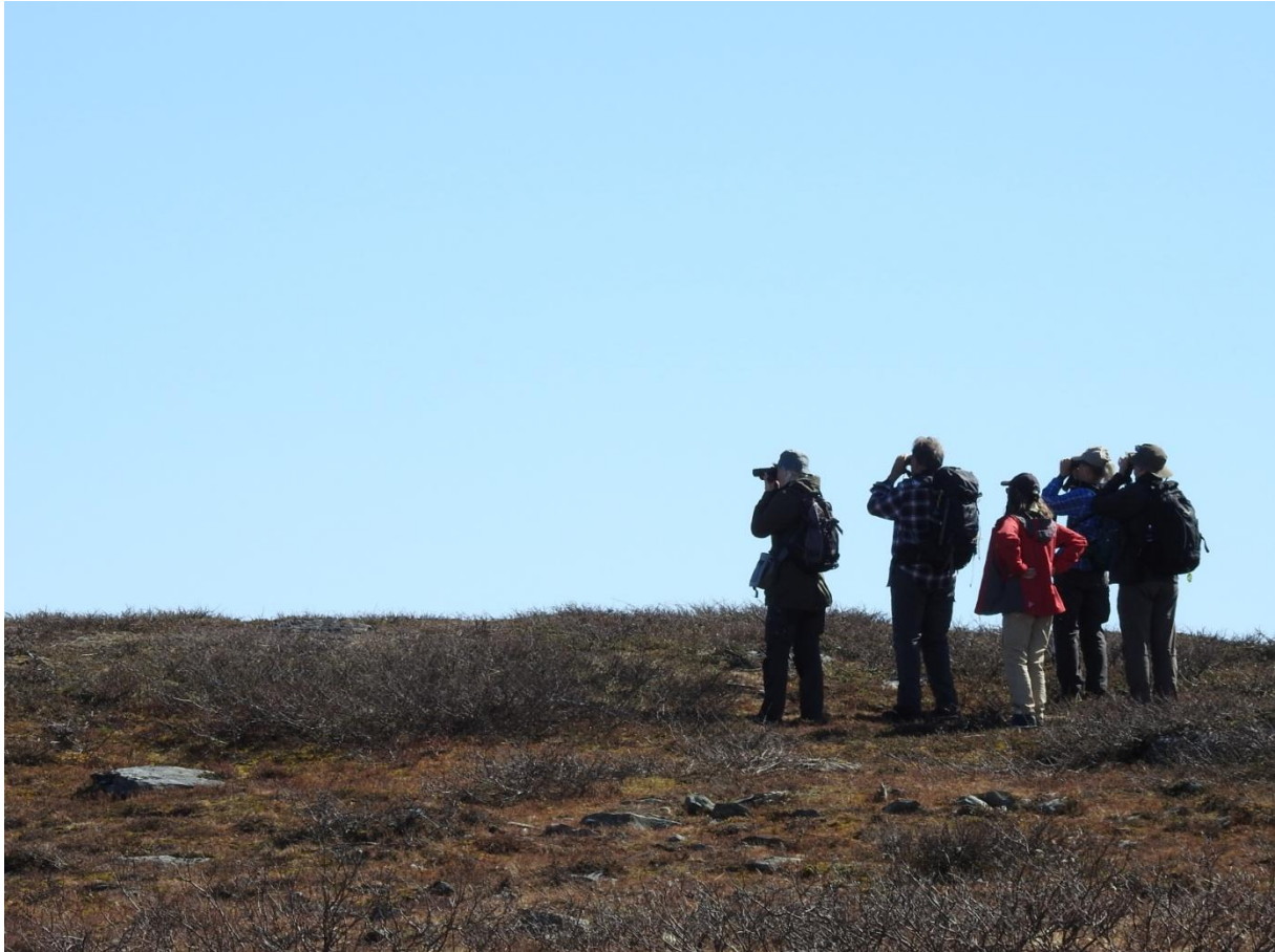
Uppe på heden.

göktyta kved på lite håll. En talltita var en trevlig överraskning. De är inte så vanliga i fjällbjörksskogen. När vi nådde hyllan mot Geppejaures sjöar tog vi en längre sittpaus. Längre fram sjöng en ringtrast, som också visade sig. Lappsparvar stöttes då och då och ängspiålrkor och ljunpipare hörde till ljudbilden. Liksom några smackande stenskvättor som bevakade sina revir rån någon upphöjd position. Sjöarna var nästan helt frusna, men i de växande vakarna såg vi alfågel, bergand och sjöore. Därtill några smalnäbbade simsnäppor. Myrspov hördes bjäbba, men vi fick inte korn på den. Sedan ett femtontal år tillbaka finns en liten population med häckande myrspov här. Fantastiskt! Resans enda kärrensäppa hördes spela. Silvertärnor satt stiligt på iskanterna i sjön och plötsligt for sammanlagt fyra fjällabbar runt. Vi åt vår medhavda lunch med underbar utsikt mot det karaktäristiska berget Stubebakte. Promenaden tillbaka gick lite snabbare, men det var bara Göran som hann se en dalripetupp slinka iväg.