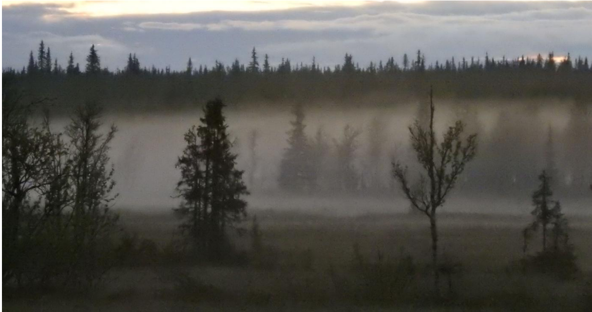
Midnatt på stormuren. Dimrådena lever sitt eget liv

Efter lunch kunde vi äntligen köra vägen upp till Höbäcken. Vägen hade inte säsongöppnat förrän idag på förmiddagen. Detta till följd av hög vårflood tidigare under säsongen, vilket gjort vägbanan mjuk. Detta stämde mycket väl då gruppens chaufför aldrig tidigare kört på en sådan vattensjuk väg. Hjulen ville liksom åka lite som de själva ville. Vi kunde i alla fall besöka "Värstingen". Den minst 900 år gamla tallen. Vi följde också den lilla körvägen norrut längs Vindelån. Men i fågelväg gav detta lite.