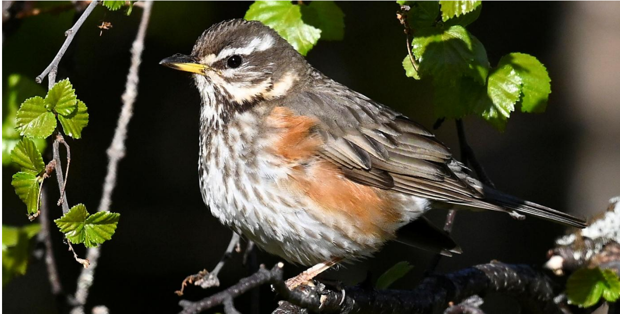
Rödvingetrasten är en karaktärsart i Ammarnäsområdet.