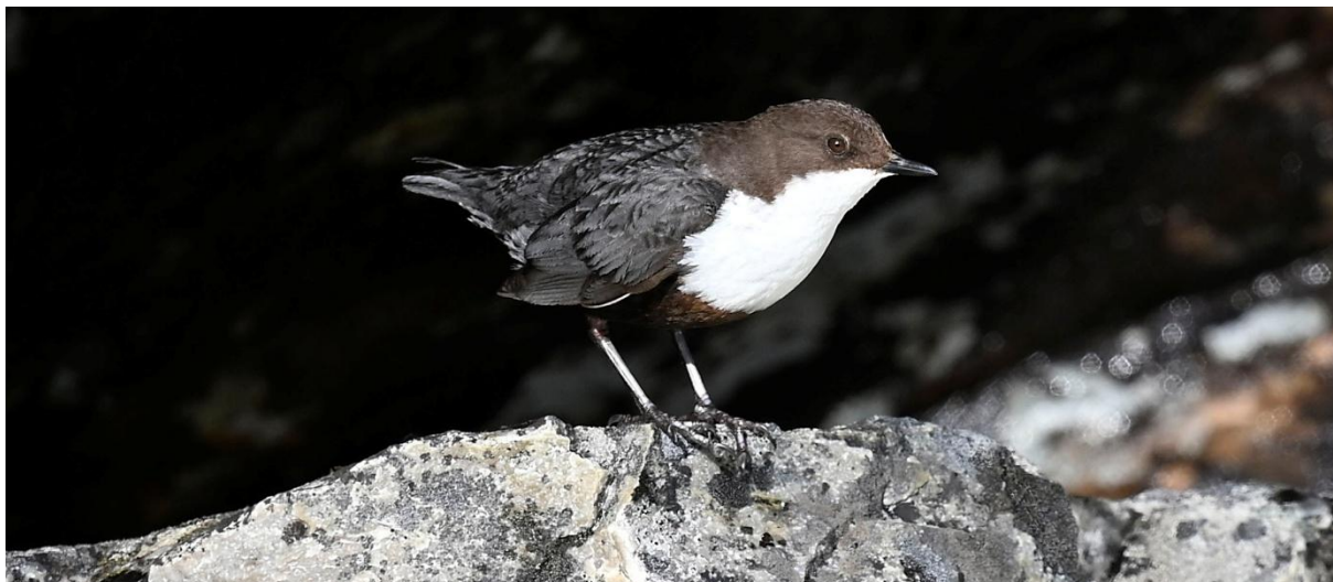
Strömstare vid Tjulån.