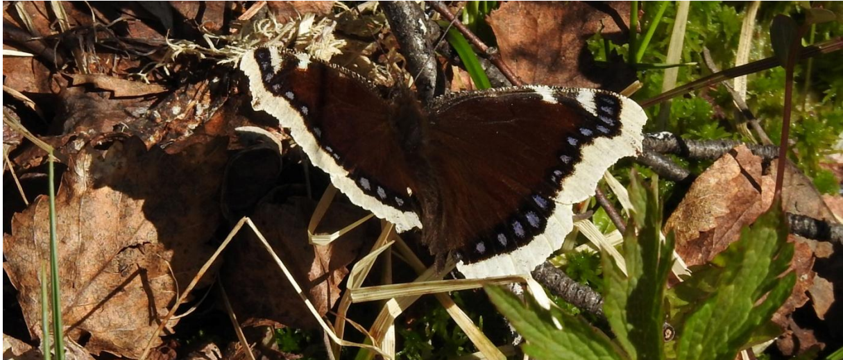
Sorgmantel på Gaissats sluttingar.