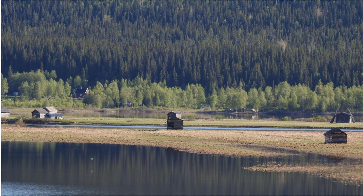
Deltat i Ammarnäs.

Vi fortsatte i Kristers sällskap till Rosfors bruks naturreservat. Här skulle det vankas nötväcka, men det blev istället 4 rosenfinkar och en bivråk. Resans enda trädkrypare kunde också noteras här. Vi tog nu farväl av Krister och for vidare västerut.