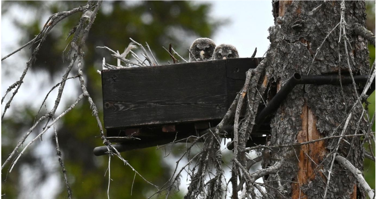
Lappuggleungarna utanför Luleå.