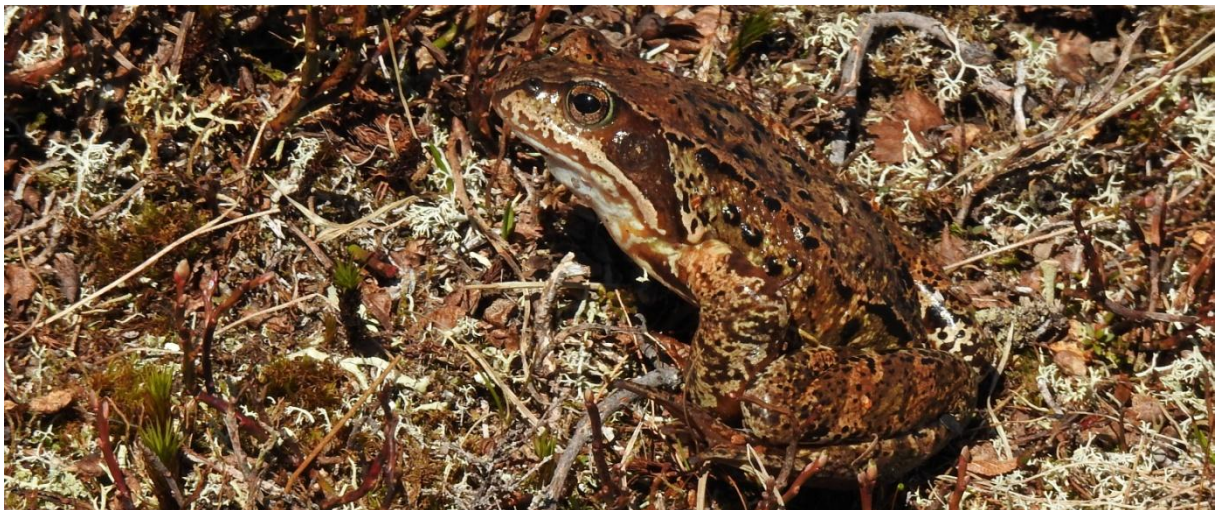
Vanlig groda vid Geppejaure. Man undrar ju hur gamla grodorna blir på kalvfället.