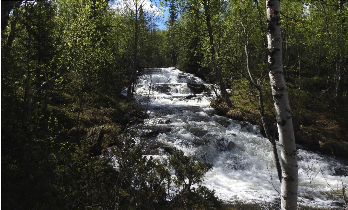
Vårbäckarna blir till små floder inne i granurskogen. Kungsleden.

noll under gårdagen). Det är ändå en fin led att gå. Små strida vattendrag som går ner till Tjulån, drar fram genom granurskogen.