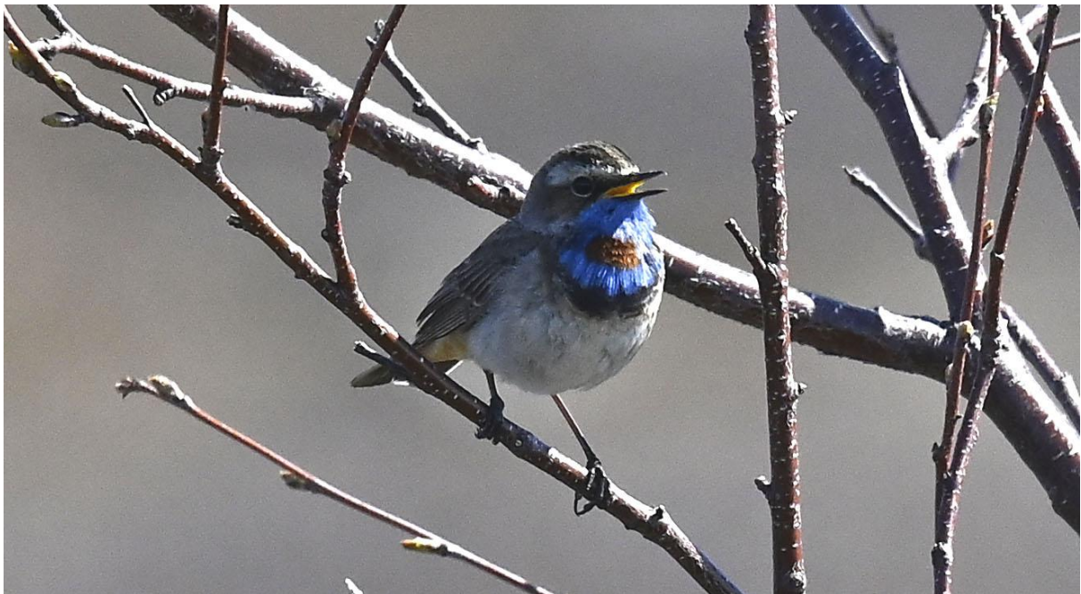
Blåhaken är en av fjällvärldens mest åtråvärd fåglar.