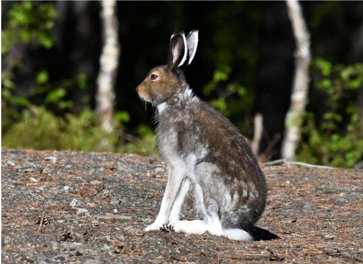
Skogsharen har kvar en hel del vinterpäls även i mitten av juni månad.