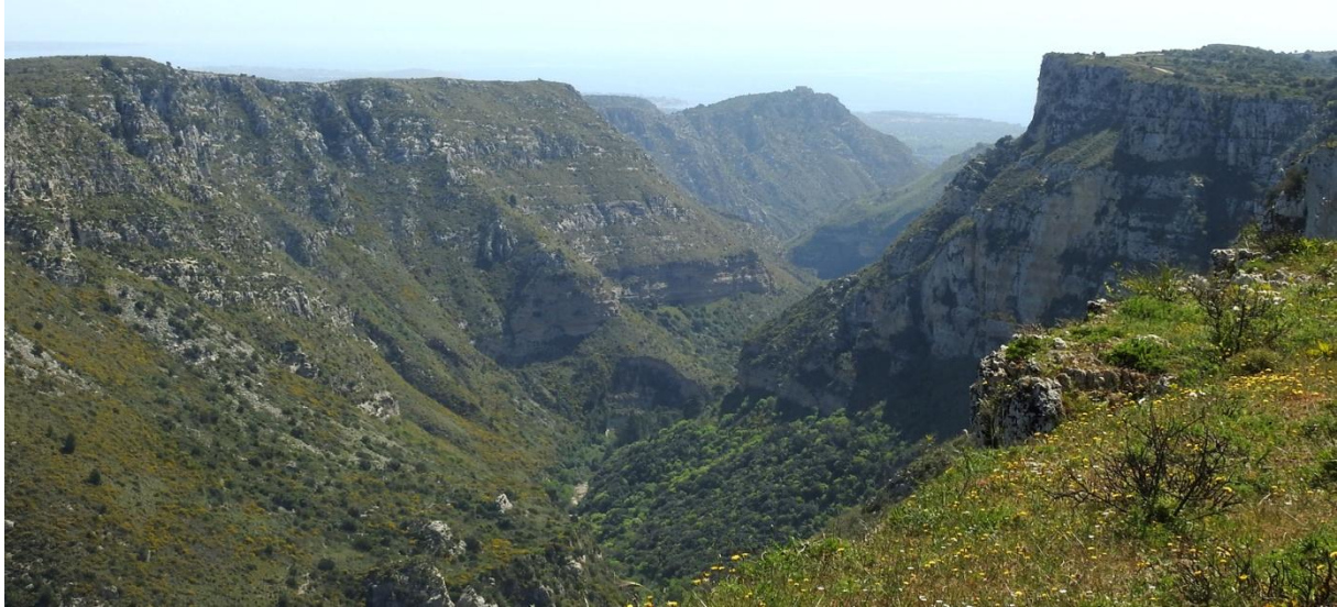
Cava Grande i Ibleibergen. En mycket fin avslutningsdag på resan.

Hotellens restaurang (som för övrigt drevs av ett separat företag), som med trevande försök hade försökt tillfredsställa våra smaklökar, ratades idag till fördel av ett närliggande hotells restaurang. Det blev ett bra val! Därtill ropade tre dvärguvar i grannskapet.