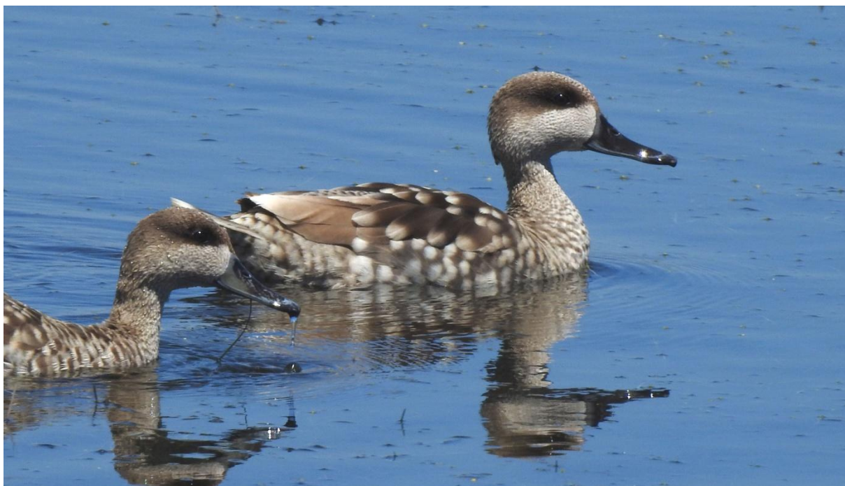
Marmoränder. Pantano Longarini .