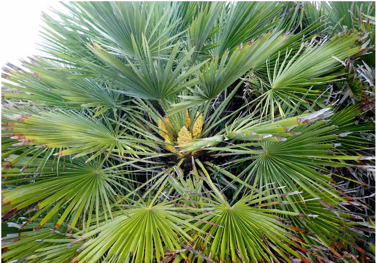
Dvärgpalm Chamaerops humilis . En av Europas två naturligt förekommande palmer.