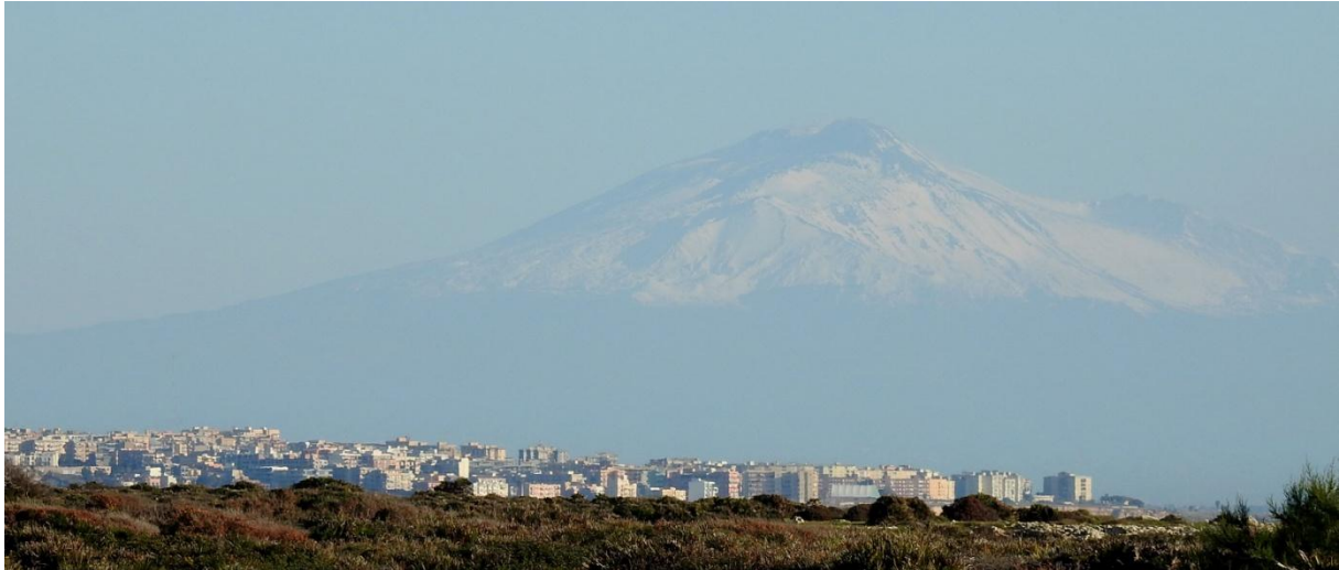
Etna är ett ovanligt landmärke. Europas högsta fastlandsvulkan, 3 357 m ö h.