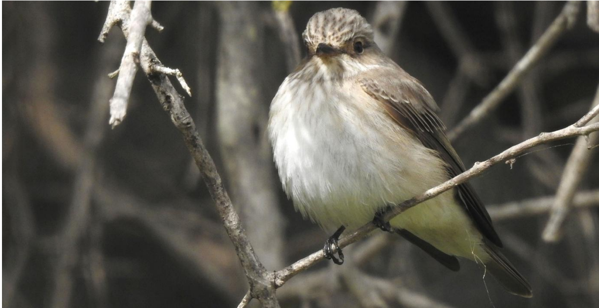
Tyrrensk flugsnappare, en överraskning.

Första plats togs av två överraskande Tyrrenska flugsnappare! Andra flugsnappare här var svartvit flygsnappare och många sjungande sydnäktergalar.