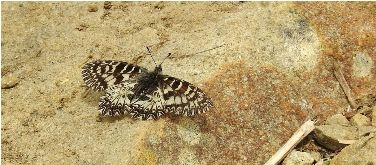
Italian Festoon finns (nästan) enbart i Italien.