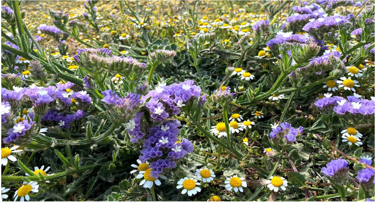
Blårisp Limonium sinuatum .