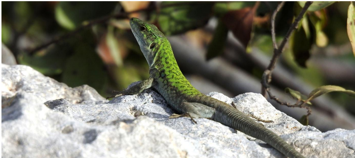
Siciliansk murödla finns enbart på Sicilien och några kringliggande småöar.