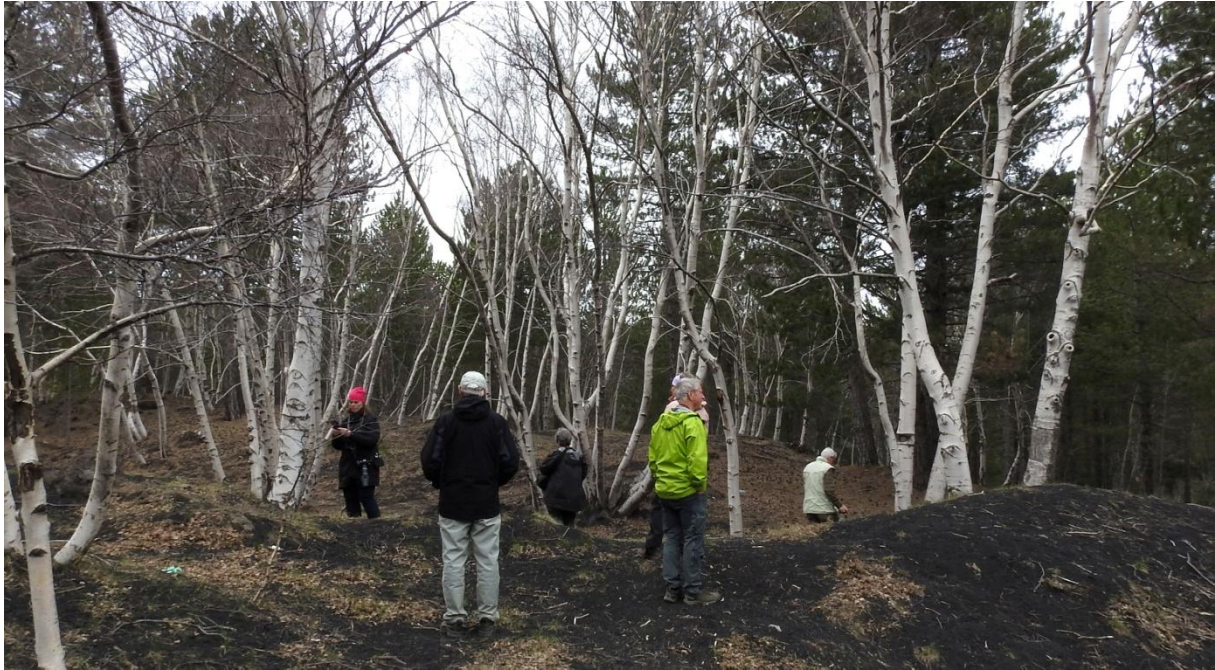
Närstudier av Etnas egen björk – etnabjörken.

Eftermiddagen tillbringade vi på vulkanen Etnas högre sluttningar. Vi stoppade på flera strategiska platser och lyssnade efter fåglar. Bl a trädgårdsträdskrypare hördes av några i gruppen. Längre upp blockerades vägen av en pågående cykeltävling. Trodde vi. Tävligen var faktiskt över men alla följbilarna blockerade vägen tills polisen släppte på avspärningen. Nu kunde vi titta på mindre korsnäbb av formen poliogyna , klippsparvar och den endemiska etnabjörken.