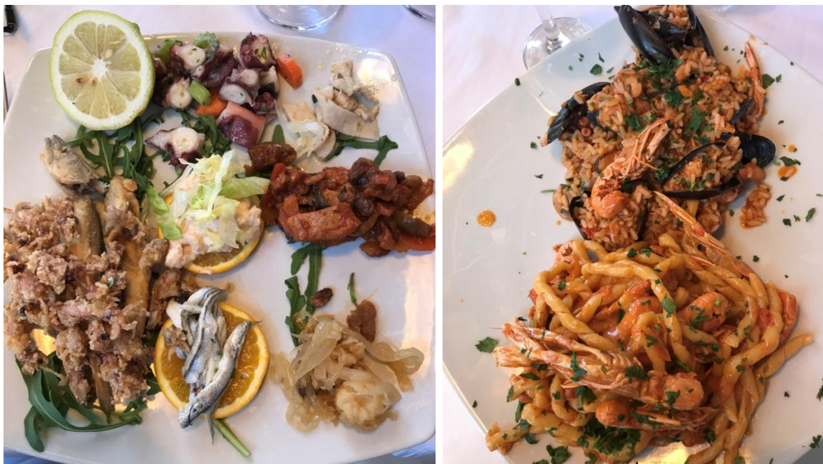
Lunch i Portopalo di Capo Passero. Först antipasto, sedan primo och secondo piatto