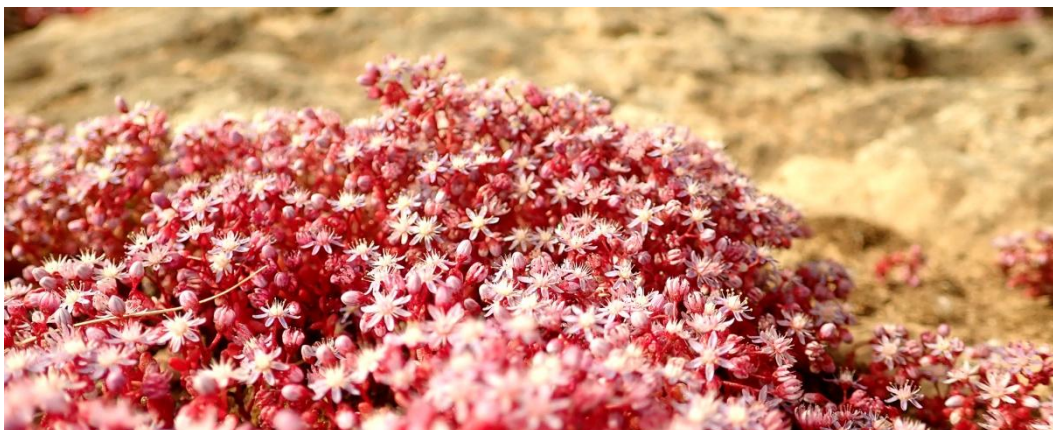
Blå fetknopp Sedum caeruleum .