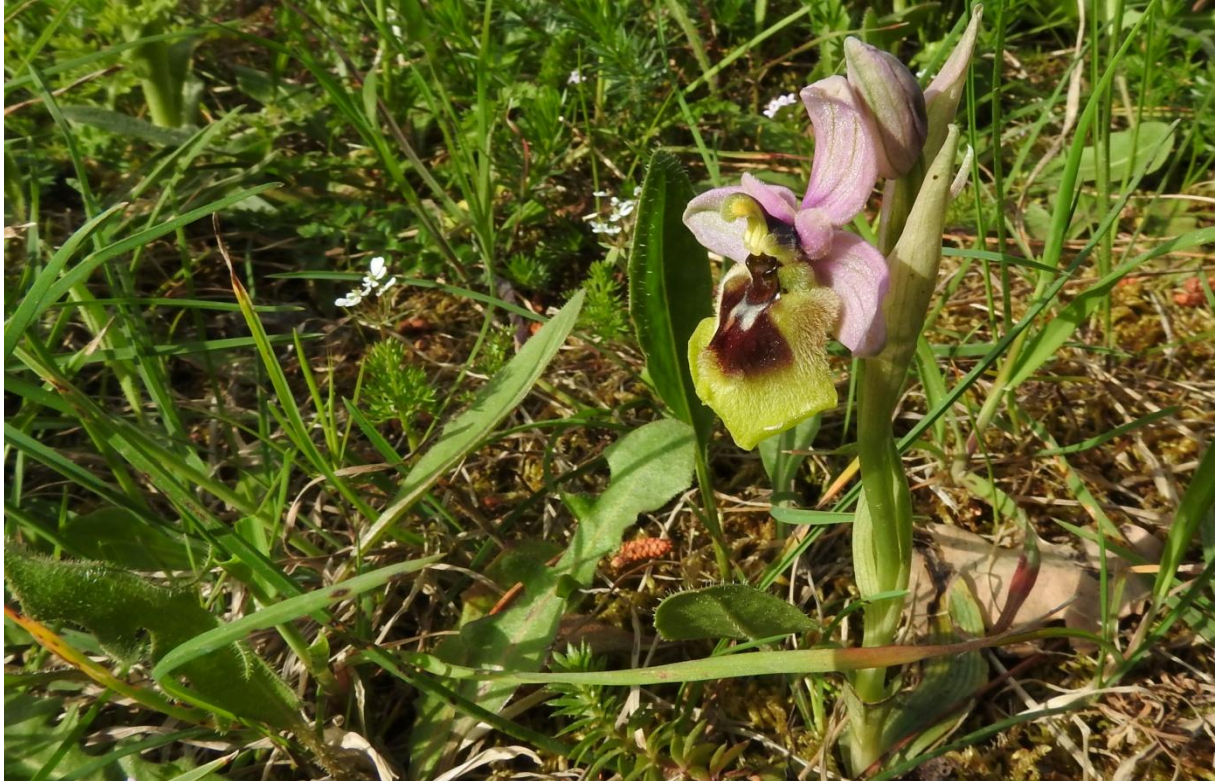
Sawfly Orchid Ophrys tenthredinifera . Ibleibergen.