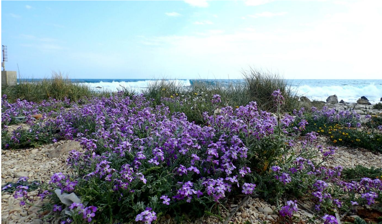
Marviol Cakile maritima .