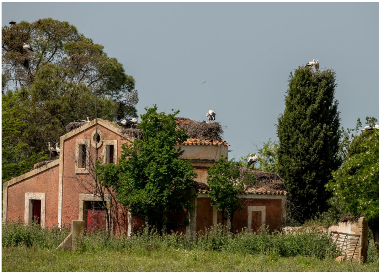
Utsikt från lunchplatsen 30 april. Stäppen väster om Trujillo.