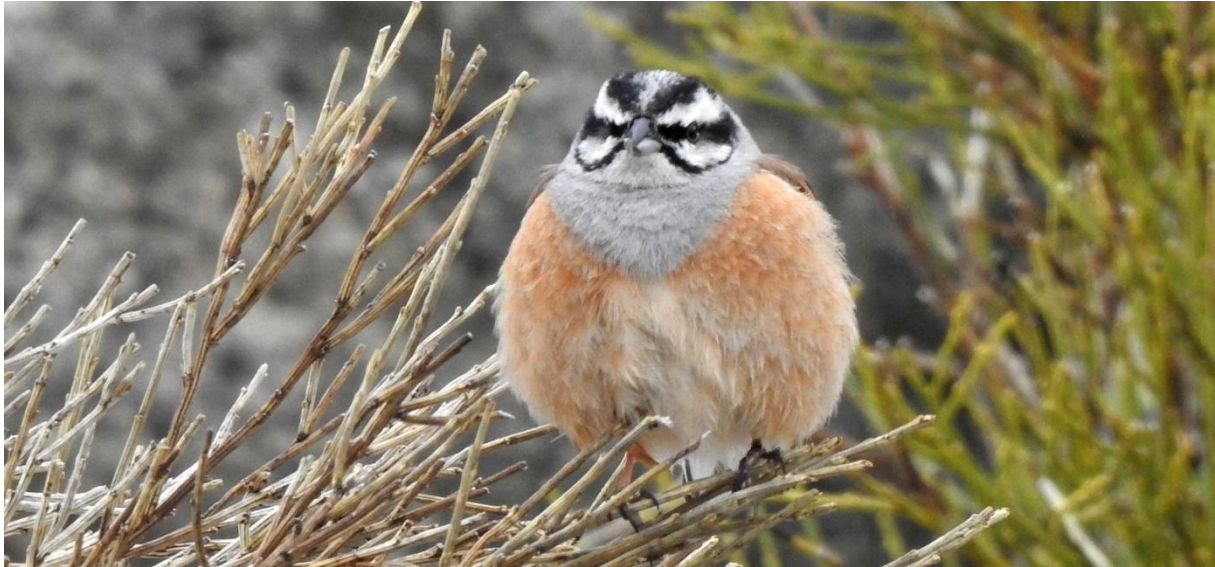
Klippsparv i Gredosbergen .