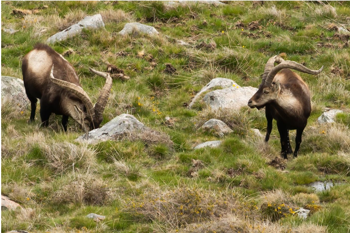
De iberiska stenbockarna låter sig väl smakas. Gredosbergen.