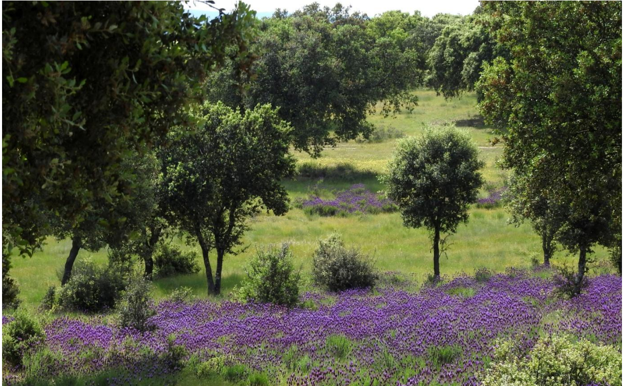
Korkekslundarna vid Lanzahita är ljuvliga att promenera i.

skuggan av några korkekar och åt här vår medhavda lunch. Utöver fint kretsande omörn såg vi också mindre hackspett. En ovanlig art i Spanien.