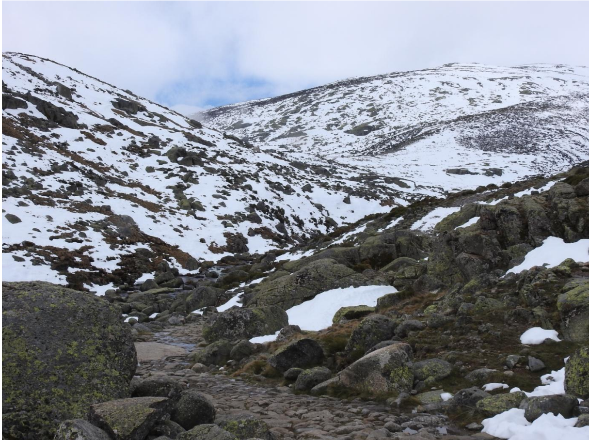
Mycket snö i Gredosbergen.

lunchen fann vi strömstare och forsärla i Tormesfloden och en trädgårdsträdskrypare visade upp sig bra för alla i gruppen.