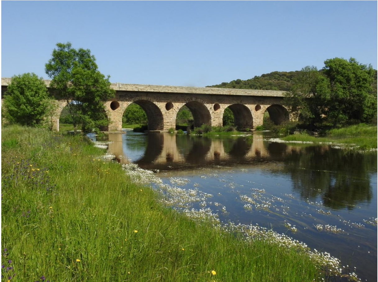
Vid Río Almonte spelade iberisk sjögroda.