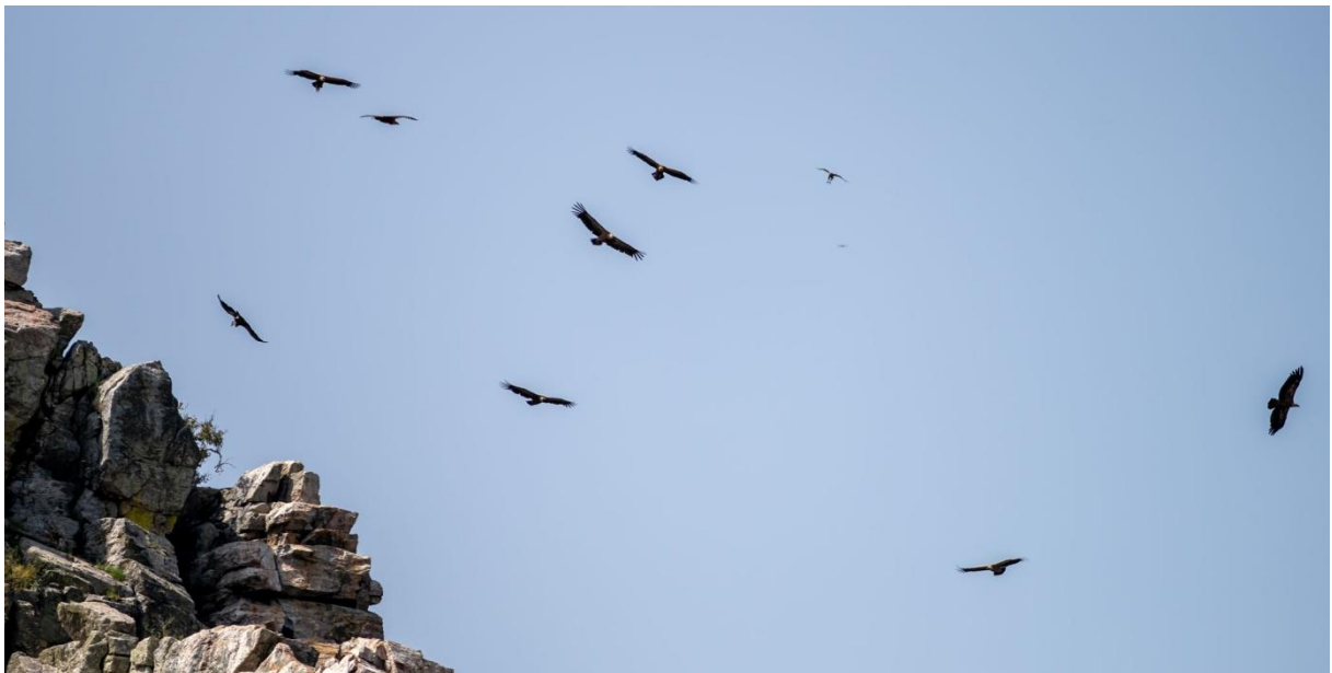
Gåsgamar vid Penafalcoklippan, Monfragüe NP.