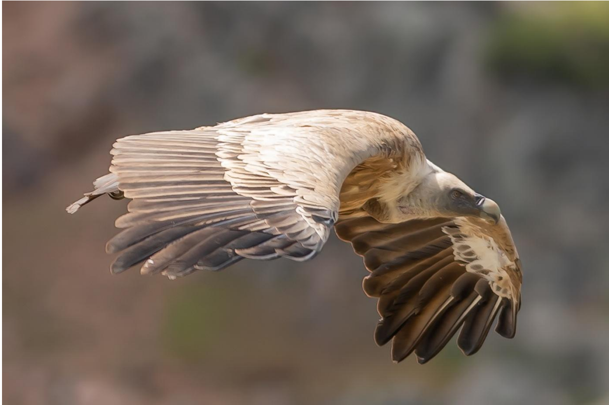
Gåsgam – inte bara resans vanligaste gam, även resans i särklass vanligaste rovfågel. Monfragüe NP.

grupp stensparvar som tyvärr försvann hastigt. Det fanns också en målart här, nämligen bergsångare. Två fåglar sjöng och den ena visade sig också bra.