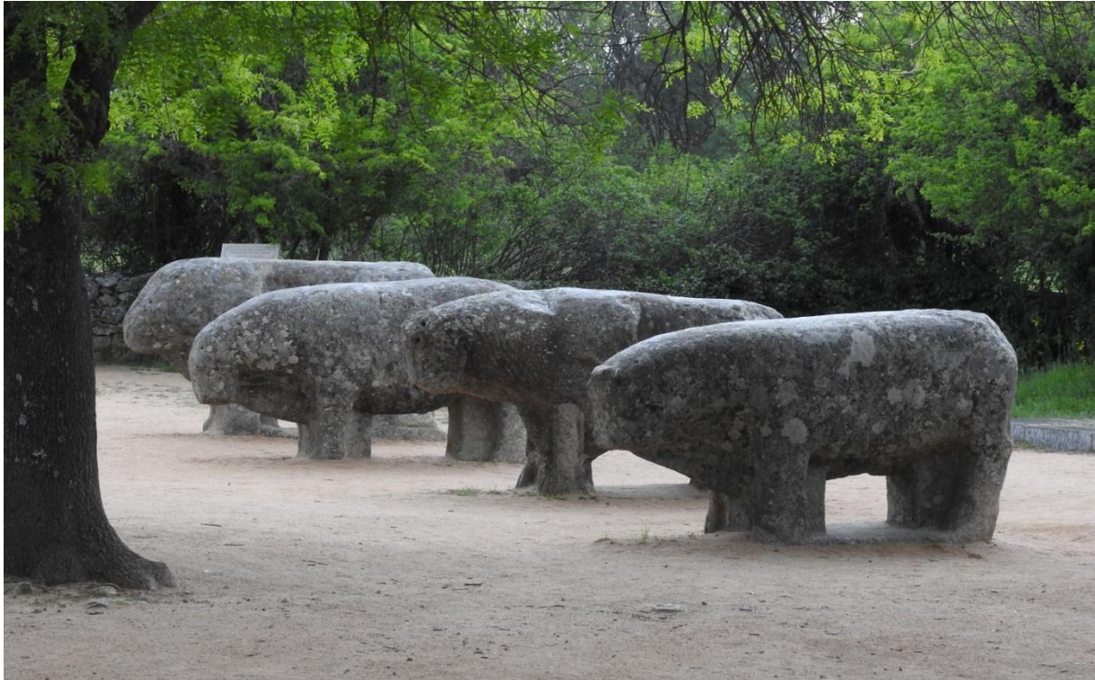
Toros de Guisando.

Det började närma sig lunch och denna tog vi i La Adrada på ett lokalt lunchhak. Bra service och helt okej rätter serverades oss. Lagom när vi satte oss i bussarna för vidare färd kom regnet. Bra planering där! När vi nådde Toros de Guisando var det fortfarande regn i luften. Men inte mera än att vi gick ut och besåg de över 2 000 år gamla granittjurarna som markerar platsen för det moderna Spaniens födelse.