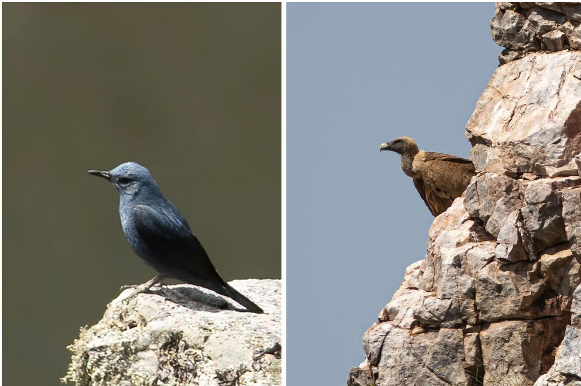
Blåtrast, hane, och gåsgam vid Monfragüe NP.