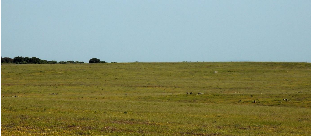
Beléns enorma betesmarker är ett eldorado för trappar, lärkor m m.

grässångare. Därtill fick vi ett från-sidan-perspektiv på den gamla stenbron som landsvägen följde över floden.