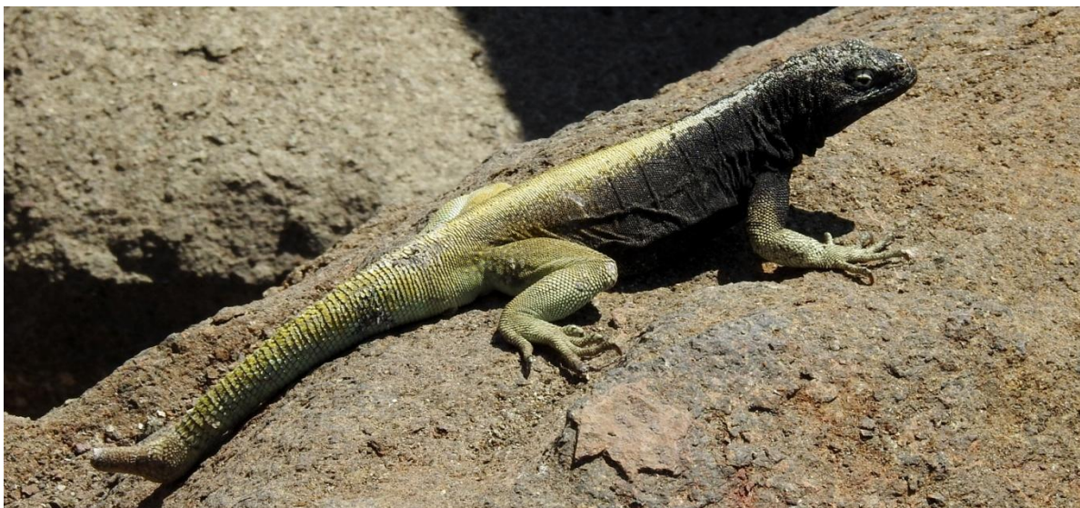
Four-banded Pacific Iguana. Cuevas de Anzota, Arica