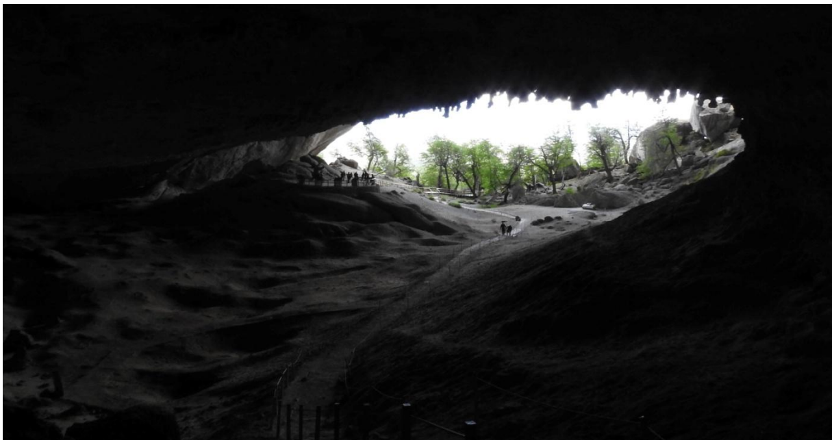
Grotta Cueva di Melodon.