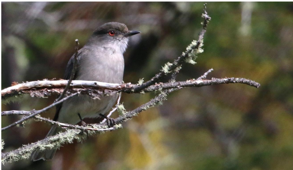
Fire-eyed/pyrope. Torres del Paine.