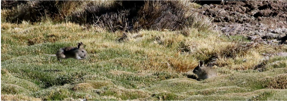
Bolivian Big-eared Mouse. Guarderia Las Cuevas, Lauca NP