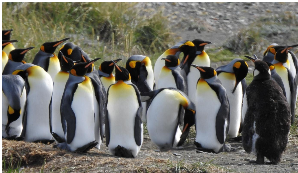
Kungspingvinerna häckar återigen på Tierra del Fuegos fastland.

I staden la vi märke till en figur på alla gatuskyltarna – en symbol för Eldslandets ursprungsbefolkning, som utrotades av chilener och européer, som tog mark i besittning för fåruppfödning mm. Fåren var mycket lättare att jaga jämfört med de vilda guanacos de brukade jaga.