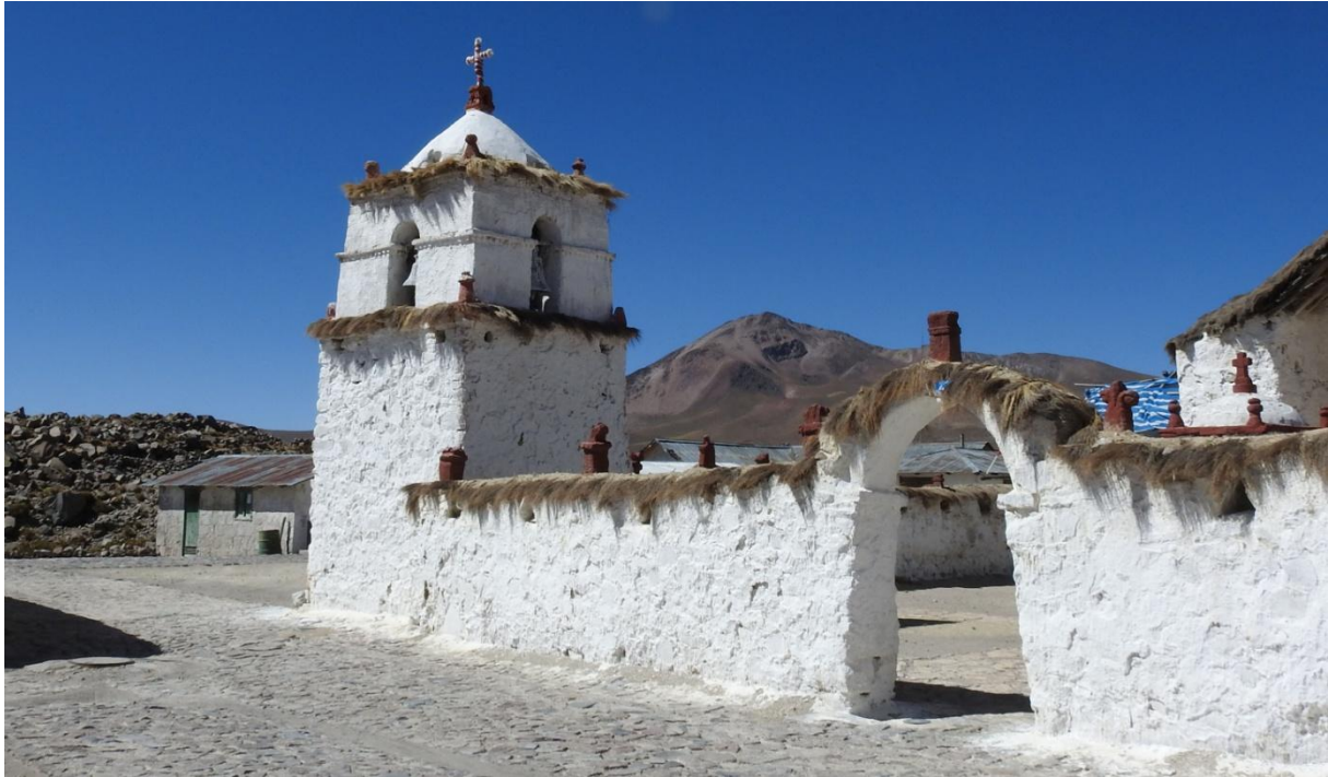
Klockstapeln till den gamla kyrkan i Parinacota.