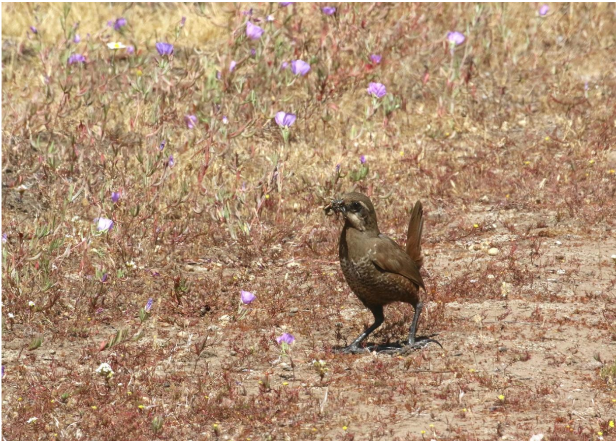
Moustached Turca i Quirilluca.