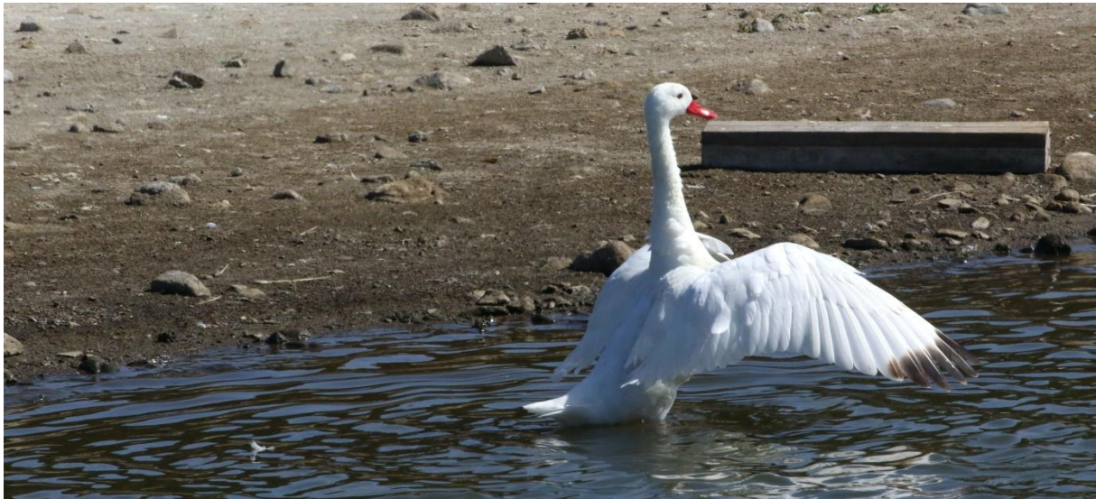
Coscoroba Swan. Estero Mantagua.