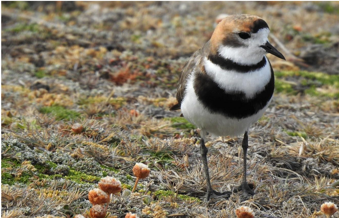
Two-banded Plover. Tierra del Fuego.