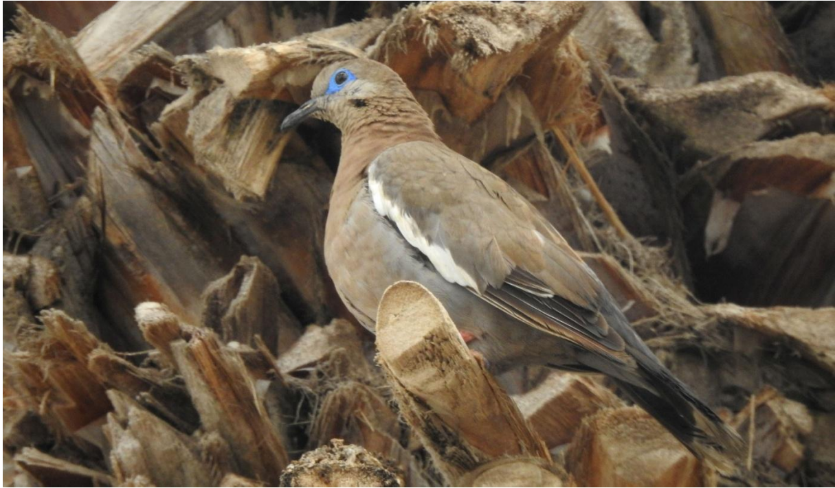
West Peruvian Dove. Arica.