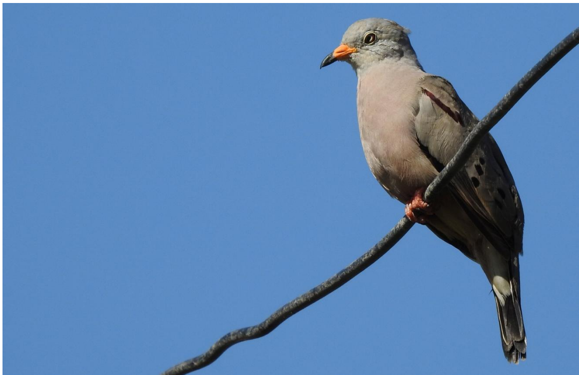
Croaking Ground Dove. Azapa Valley.