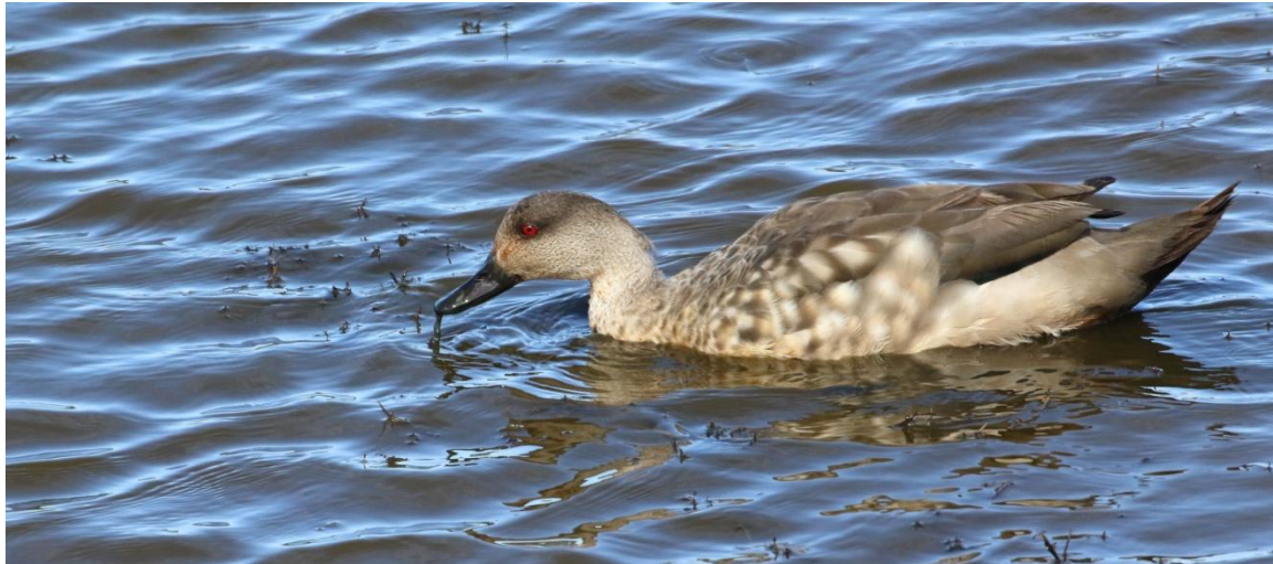
Crested Duck/ specularioides . Punta Arenas.