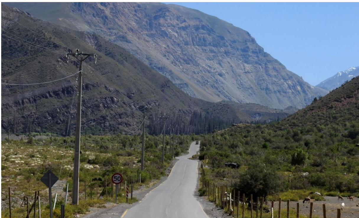
Vägen in i Yeso Valley.

På morgonen vid stranden nedanför hotellet räknade vi in ca 70 Willets innan vi åkte till flygplatsen och flyget till Santiago. Utanför lunchrestaurangen vid flygplatsen i Santiago såg vi Chimango Caracara och Chilean Mockingbird , innan vi kom iväg mot Maipo Valley på em. Southern Lapwing och Austral Thrush sågs längs vägen och så gott som alla dagar framöver. Framme vid Cascade Lodge ser vi att den är något alldeles extra: de små husen för boende såg ut som tjockfotade svampar med hängande tak. Inredda med mycket träsniderier, rustikt inpassade i vitputsade väggar. Likt Gaudi-stil. Många valnötsträd i trädgården, vinrankor längs gångvägarna.... Middagen intogs i restaurangen nere vid floden. Pisco Sour smakade bra före maten! Medan vi väntade hittade Hasse två Torrent Duck (ungfåglar) som vilade på en sten nere i floden. God mat och dryck!