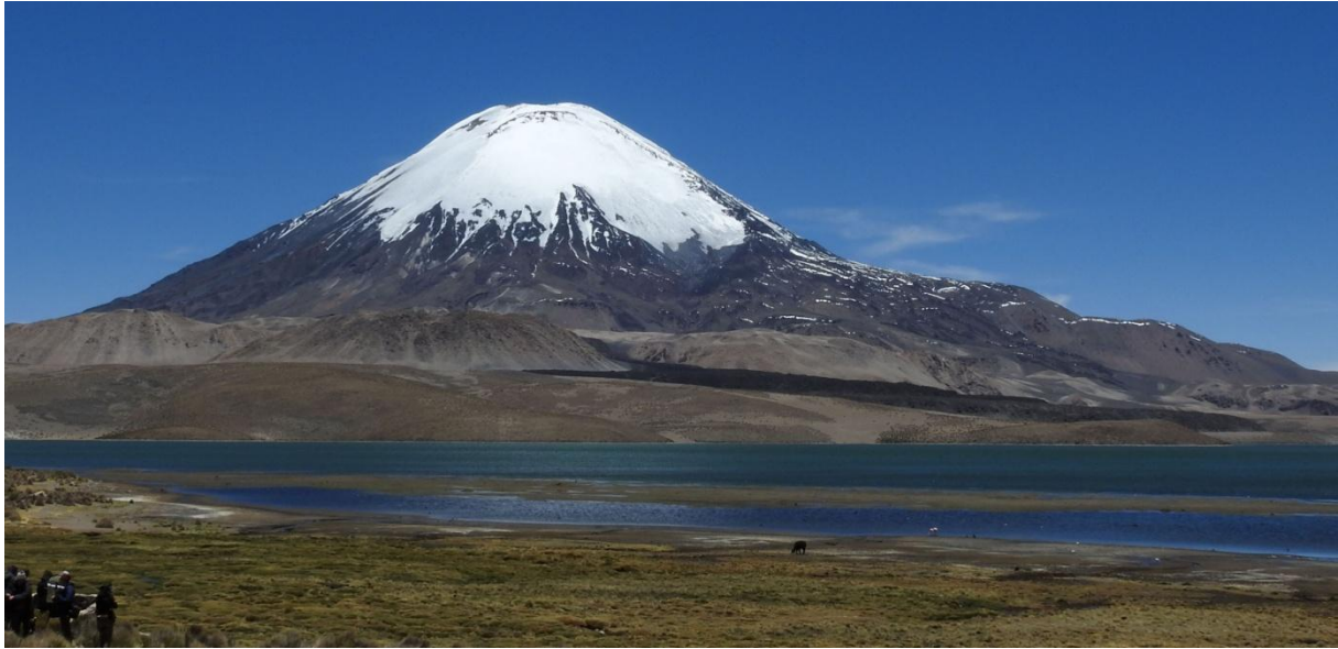
Vulkanen Parinacota, vid gränsen till Bolivia: Foto. Göran Pettersson

Samling på torget. Fin gammal kyrka med grästak (pampasgräs). Black-winged Ground-Dove ses innan vi ska åka tillbaka. Då upptäcks en flock Mountain Parakeet som flög upp mot kullarna bakom byn. Vi väntade, men de kom inte tillbaka. Åter till Putre för middag "på stan".