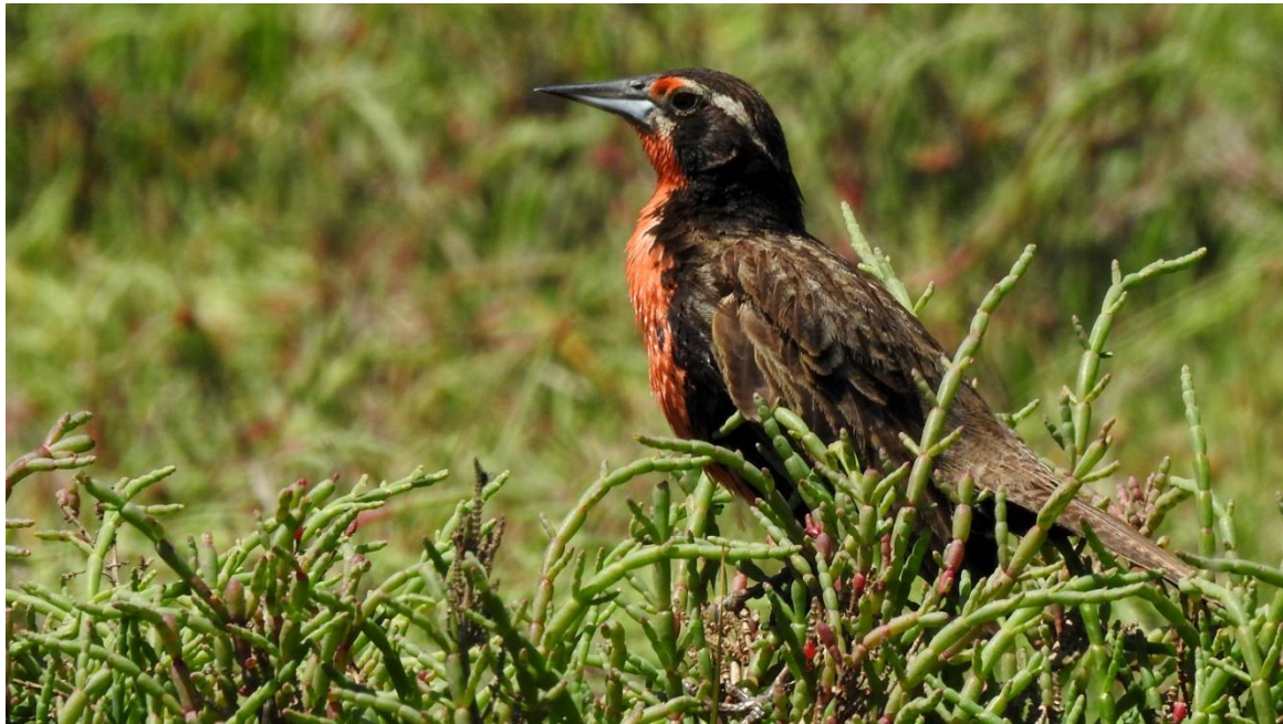
Long-tailed Meadowlark. Estero Mantagua.

1 Maipo Valley 4.12, 4 Quirilluca 5.12, 1 Estero Mantagua 6.12, 1 Puerto Montt 8.12, 1 Chiloé Island 9.12, 3 Punta Arenas 10.12 och 5 Tierra del Fuego 11.12. Observerad 11 dagar totalt