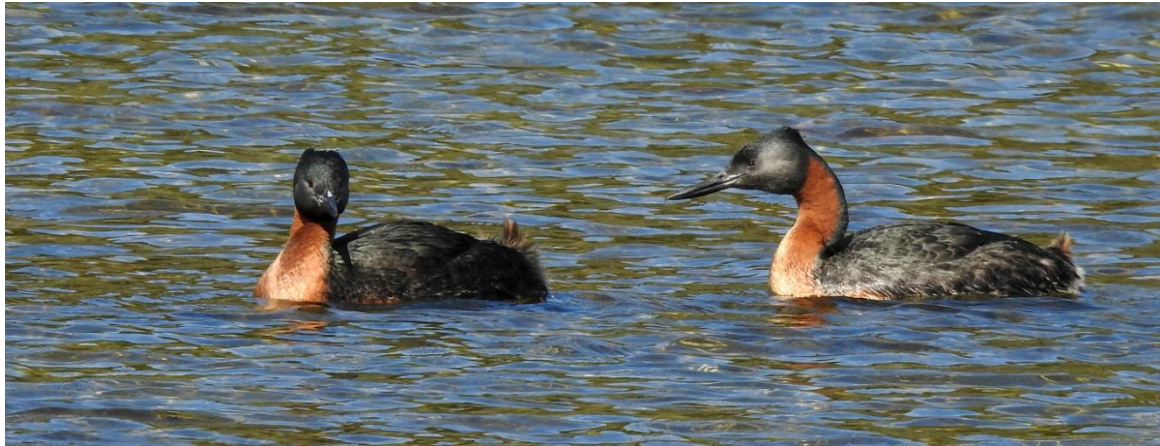
Great Grebe/navasi. Torres Del Paine.

42 Great Grebe Podiceps major major : 2 Mantagua marshes 5.12, 1 Estero Mantagua 6.12, 1 Puerto Montt 8.12 och 3 Delgada Ferry 12.12 navasi : 3 Tierra del Fuego 11.12 och 5 Torres del Paine NP 13.12