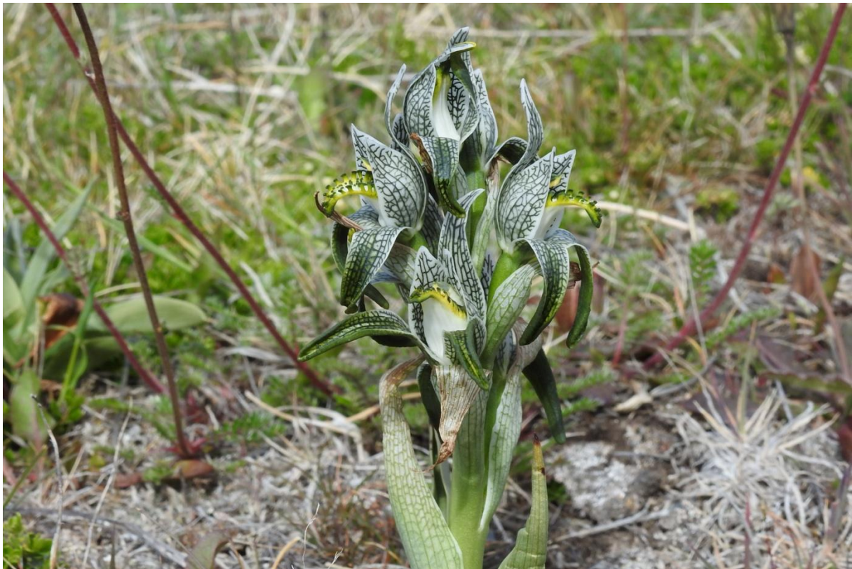
Orkidéen Chloraea magellanica . Torres Del Paine.

Framme vid lodgen: Hotel del Paine, som ligger på slätten i deltat med Rio Serrano. Trevligt och fina rum med utsikt över Torres del Paine och hela bergsmassivet! När vi packar ur bussen kommer fyra kondorer ut över bergen bakom vårt hus! Verkligen njutbart! Dessutom ser vi en Ringed Kingfisher nere vid vattnet. En promenad på eftermiddagen till skogsområdet nära hotellet. Fire-eyed Diucon , Black-chinned Siskin , Thorn-tailed Rayadito , White-throated Treerunner och Patagonian Sierra-Finch . Calafates-buskar (en berberis) med bär som vi provsmakar, syrliga! En brun jättehymla flyger omkring – Bombus dahlbomii , endem, som fått sitt latinska namn från entomologen Anders Gustaf Dahlbom. Arten har minskat i antal och anses nu som starkt hotad.