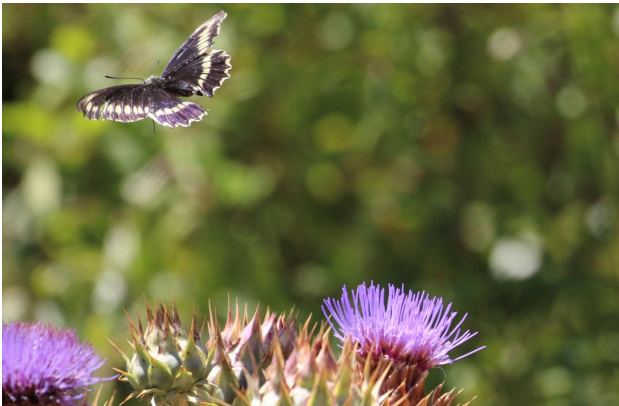
Battus polydamas flog vid Quirilluca: Foto. Hasse Andersson

Lunch på en lokal restaurang nära hamnen, mycket fisk på menyn. Flera provade Locos: "havsöron", som egentligen var Chilean false locos. Fräscht och gott tyckte alla!