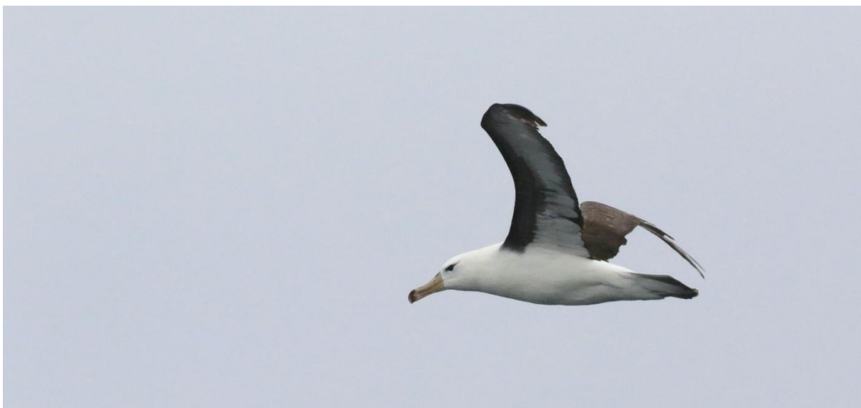
Black-browed albatross. Quintero pelagic.