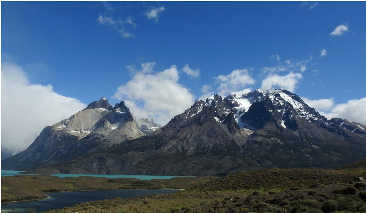
De häftiga bergen i Torres Del Paine.

Många kalhyggen passeras – betesmarker? Hård blåst så bussen kränger på raksträckorna. Alla träd och buskar lutar åt samma håll, alltid samma vindriktning. Två Andean Condor ses alldeles innan vi kör in till Puerto Natales. Middag på italiensk-inspirerad restaurang, gott och vällagat. Här fick vi Calafate Pisco – vinröd av calafatejuicen. Gott, inte lika surt som Pisco Sour!