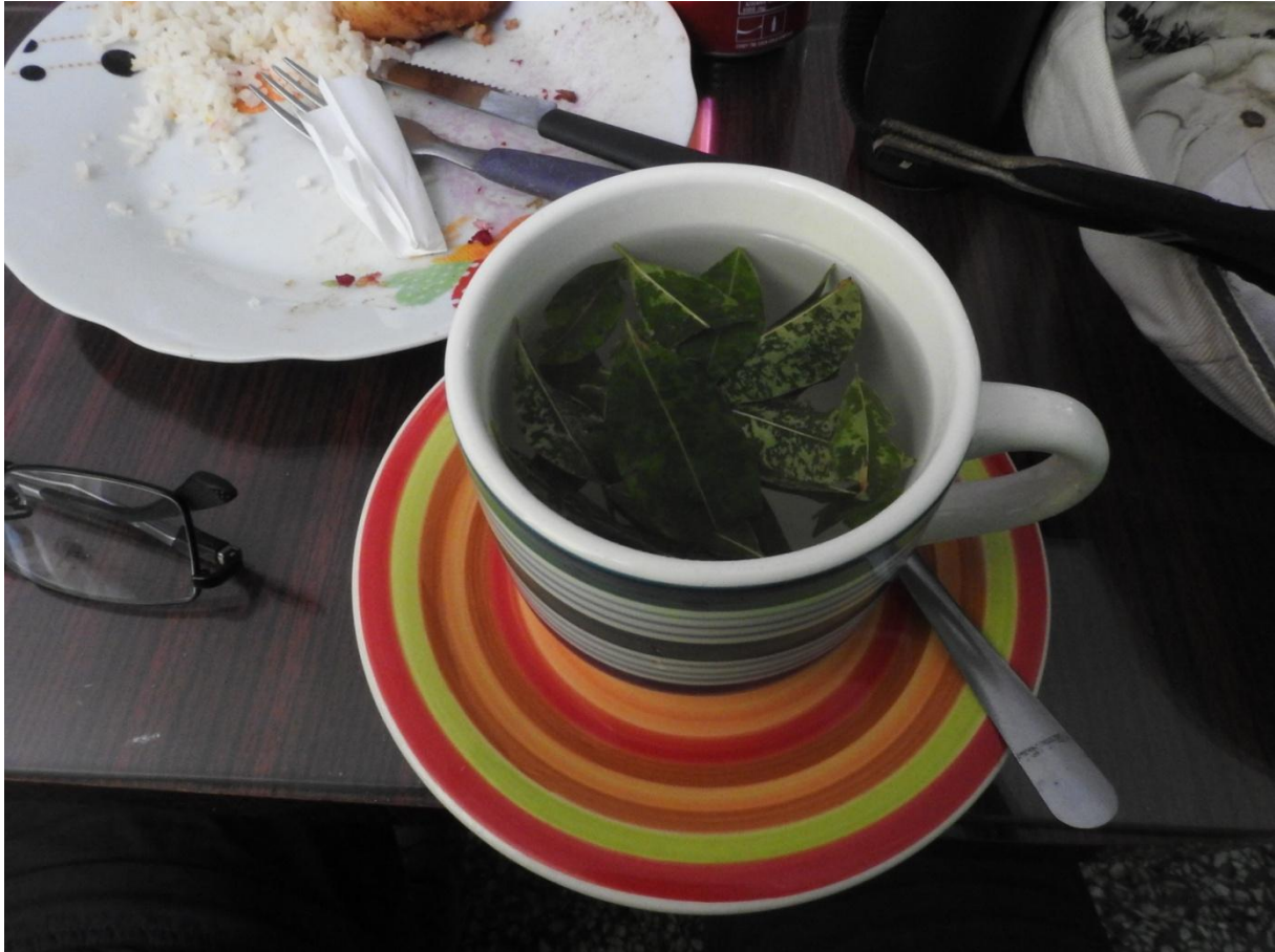
Vi bjuds på coca-te.