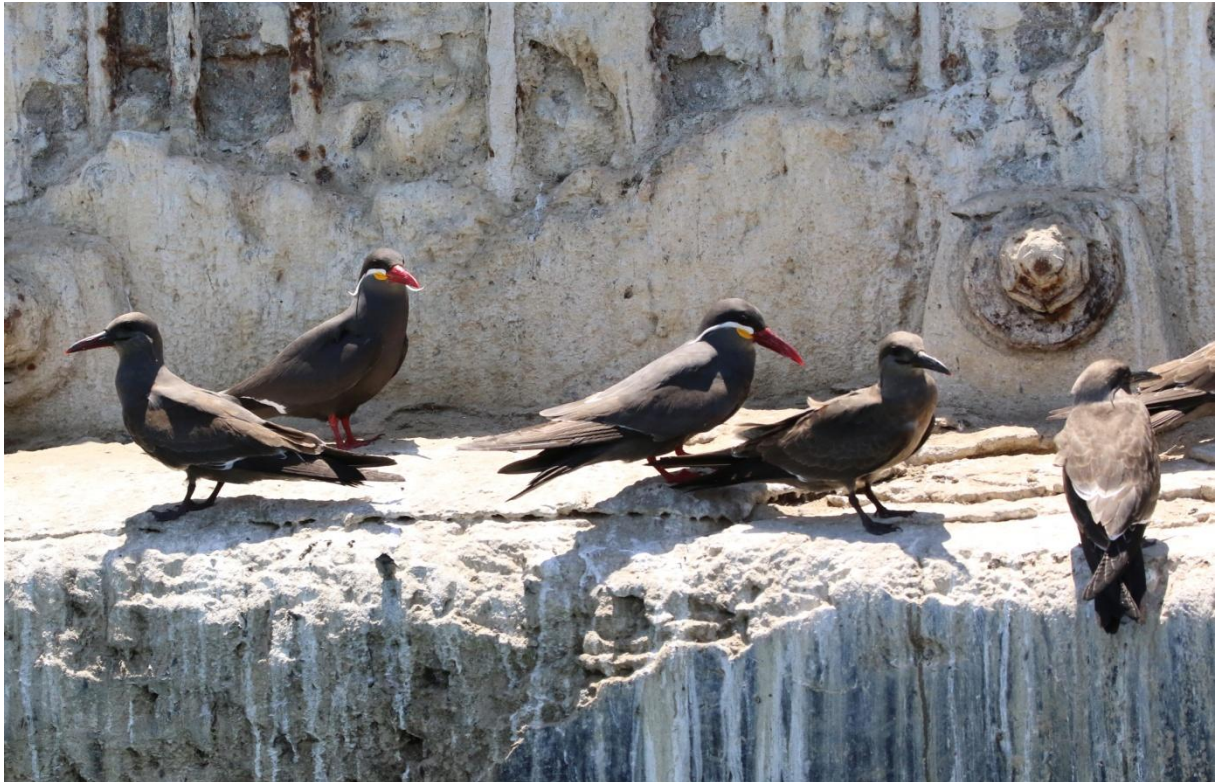
Inca Terns. Arica.