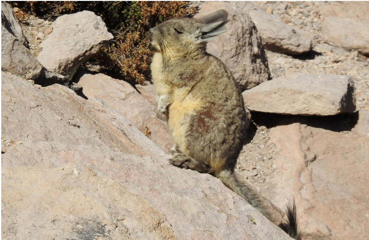
Northern Mountain Viscacha var ett mysigt inslag.

gråa buskar, där de går bland vikunjorna. Puna Ibis , Mountain Caracara och American Kestrel noteras. Resans första Andean Condor upptäcks av Totte! Alla glada! Vi ser ut över slätterna från Misitunes. Många vulkaner i Anderna och flera är aktiva. Vi kunde se en där vi stod, det pyste ånga från en topp långt bort.