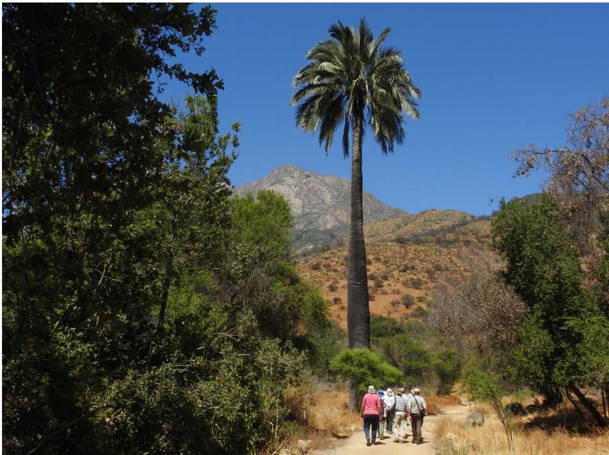
Den endemiska Chilean Palm växer ståtligt i La Campana.

Kortstopp vid Rio La Laguna (Estero Catapillo i Mantenillo). En stor sandrevell mitt i floden. White-winged , Red-gartered och Red-fronted Coot , Lake Duck , Black Skimmer , American Oystercatcher , White-necked Stilt , Hudsonian Whimbrel (stor flock), Brown-hooded och Franklin's Gull , Coscoroba Swan , Great Grebe och Yellow-winged Blackbird . Hemåt till Viña del Mar.