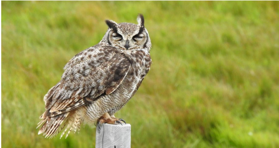
Lesser Horned Owl. Tierra del Fuego.