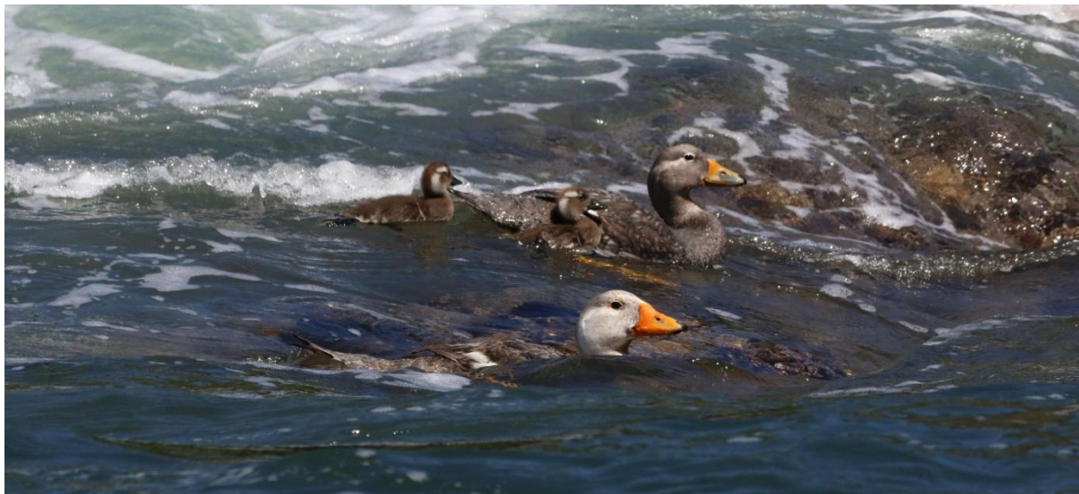
Fuegian Steamer Duck på Chiloé Island.

klipporna sågs fyra Humboldt Penguin . Koloni med Red-legged Cormorant , där fåglarna satt som klistrade på en berghäll. Rock Shag blev ny art för många av oss. Imperial Shag fanns också härute. Ett litet sjölejon låg på en klippa, skadad konstaterades, vilket även en Turkey Vulture gjort, den satt en liten bit ifrån sjölejonet... Två Chilean Dolphin visade sig nära båten. Kul! Efter en lyckad tur på sjön åt vi lunch på restaurangen längst in i viken. Fisk förstås! Utanför huset kunde vi se Kelp Goose -paret nedanför terrassen, två små duniga ungar låg i tången. Snygga fåglar och roligt att få se så bra!