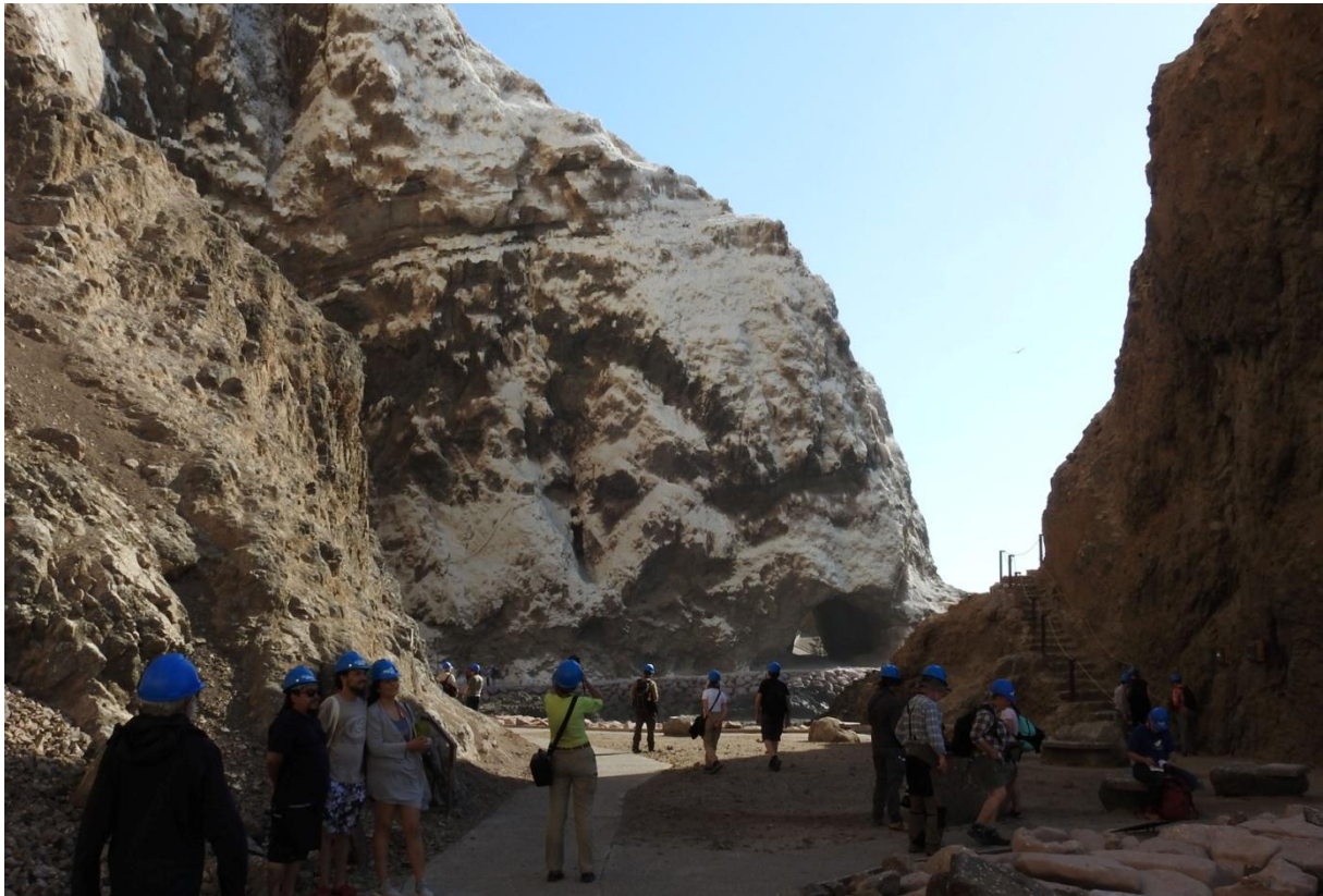
Cuevas de Anzota. Arica.

stim med hoppande, silverglänsande "Bonitos" lockade några Humboldtpingviner. En rolig obs var två juvenila fisktärnor , som satt på en tångruska! Till slut fick alla se en sillval, som upptäcktes av Rodrigo! Den blåste, dök och kom upp igen, dök och försvann – "footprints" på vattenytan. Efter en stund återupptäcktes valen nära båten, jubel förstås innan den dök ner och försvann för gott. Hemfärden blev lugnt surfande på dyclingarna. Guanay Cormorant noterades på piren i inloppet. Längs kustremsan sågs vita berg, som låg i Anzota-området. Lunch i hamnen, på lokal fiskrestaurang. Serverades Bonito, god vitfisk. Mycket smakligt!