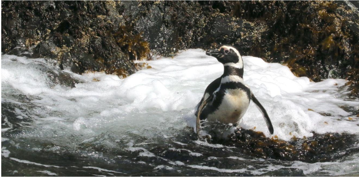
Magellanic Penguin, Chiloé Island.