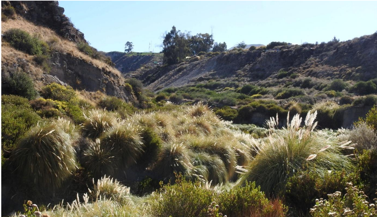
Fågelrik dalgång vid Putre.

Putre nästa. 3660 m.ö.h. Liten fin stad med många fina välskötta hus, där de flesta invånarna är aymaraindianer. Vi kommer till hotellet på eftermiddagen. Alla uppmanas att sova, absolut inget skådande eller mobilkollande! Viktigt för kroppen att få vänja sig vid den höga höjden! Att röra sig långsamt var nödvändigt, det kändes direkt om man gick som vanligt! Middag i byn, gott och vällagat. Oliver från Azapa var förrätt, verkligen goda! När vi kommer tillbaka till hotellet ses en Tschudi's Nightjar flyga upp i strålkastarljuset från bilen! (Enda nattskärnan i området)