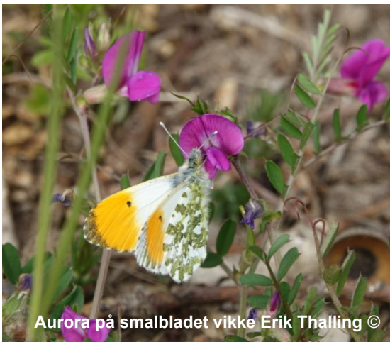
Aurora på smalbladet vikke