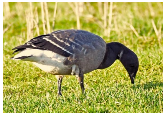
Knortegås, Ølsemagle Revle