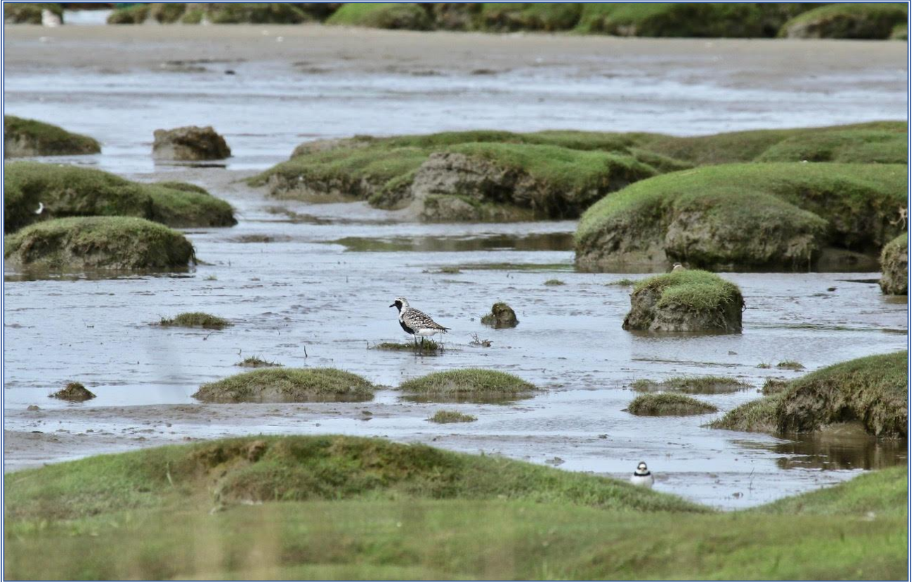
Naturhistorisk Forening for Nordsjælland Tur til Vadehavet 26. – 29. maj 2019