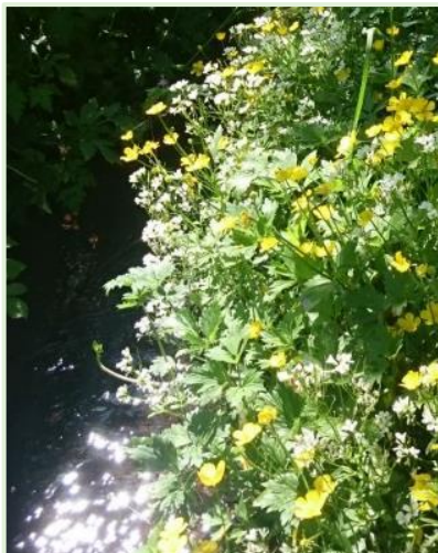
Vandkarse og Lav ranunkel

Hyldebladet baldrian Tigger-ranunkel Tyndskulpet brøndkarse (?) Småblomstret gulurt