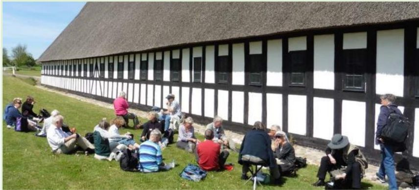
Frokost i det grønne ved Karlsladen

Første stop med Vipperød Bus efter et kort ophold ved Infoteria Lillebælt var Kalø Besøgscenter, hvor frokost blev indtaget. Enkelte nåede rundt om Kalø Hovedgård for at se Jagtslottet, som i dag er hovedsæde for Nationalpark Mols Bjerge.