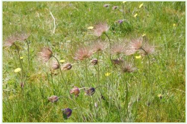
Næste stop Tre Høje med fremvisning af opret kobjælde