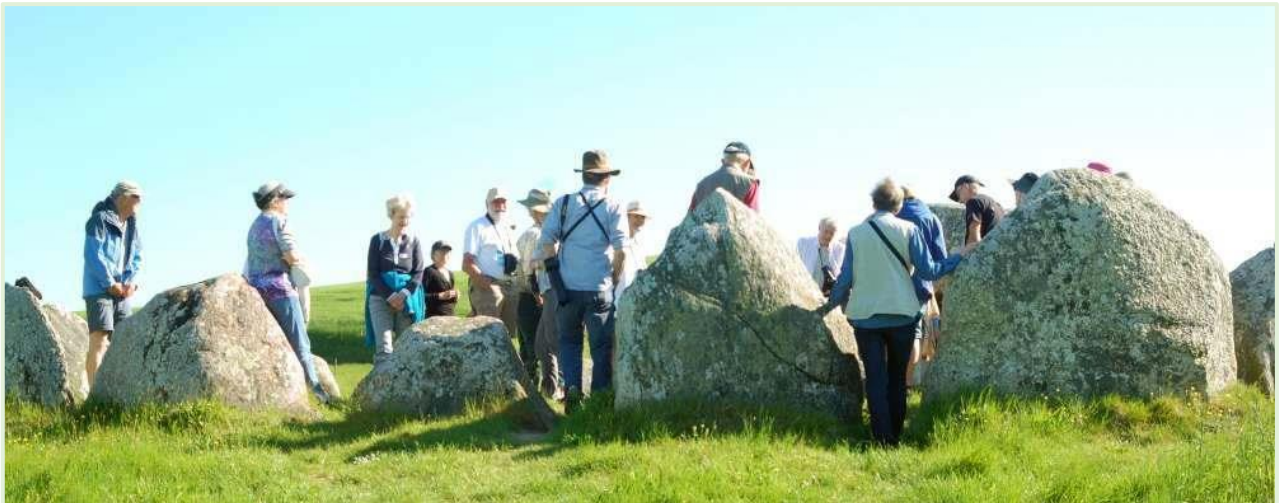
Første stop: Poskær Stenhus

Om formiddagen tog vi en tur rundt til de forskellige seværdigheder i Nationalpark Mols Bjerge under projektleder i Nationalpark Mols Bjerge, biolog Jens Reddersens ledelse.