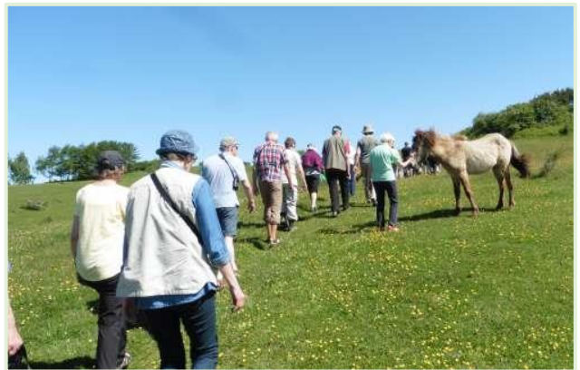
Gåtur gennem smukke overdrev