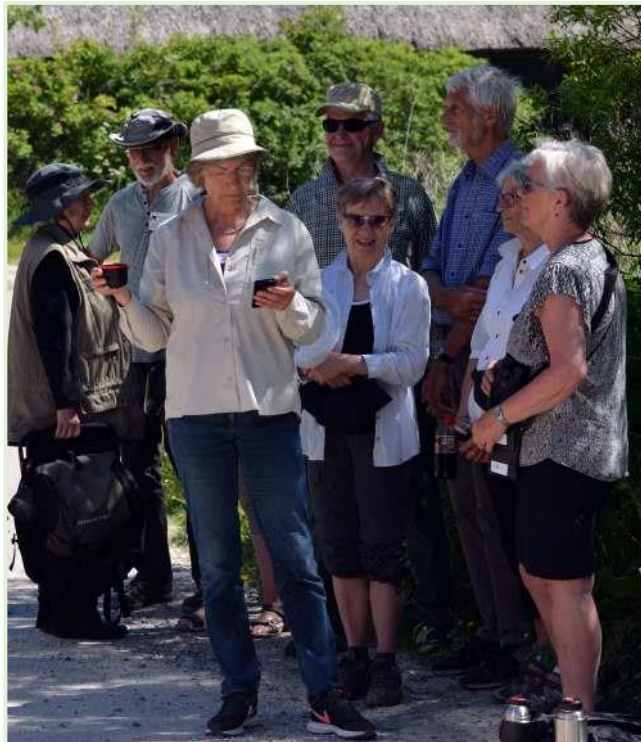
Der ventes i skyggen

Vi takker deltagerne for, at turen blev vellykket og forløb helt uden problemer.