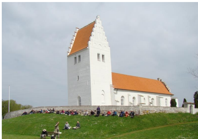
Frokost ved kirkemuren