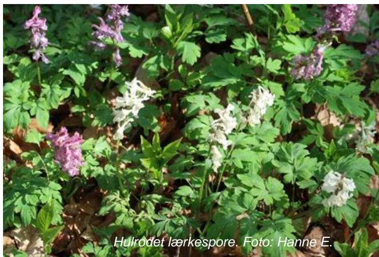
Hulrødet lærkespore.

Småsøerne mellem Bastrup Sø og Bure Sø er en lokalitet, vi igennem årene har besøgt adskillige gange, et ekstremrigkær med sjældenheder som melet kodriver og bredbladet kæruld og ikke mindst en fin bestand af maj-gøgeurt. Vi var der 18. maj.