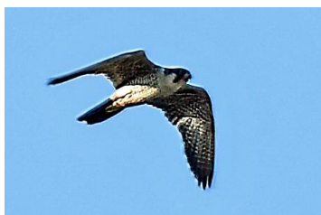
Vandrefalk