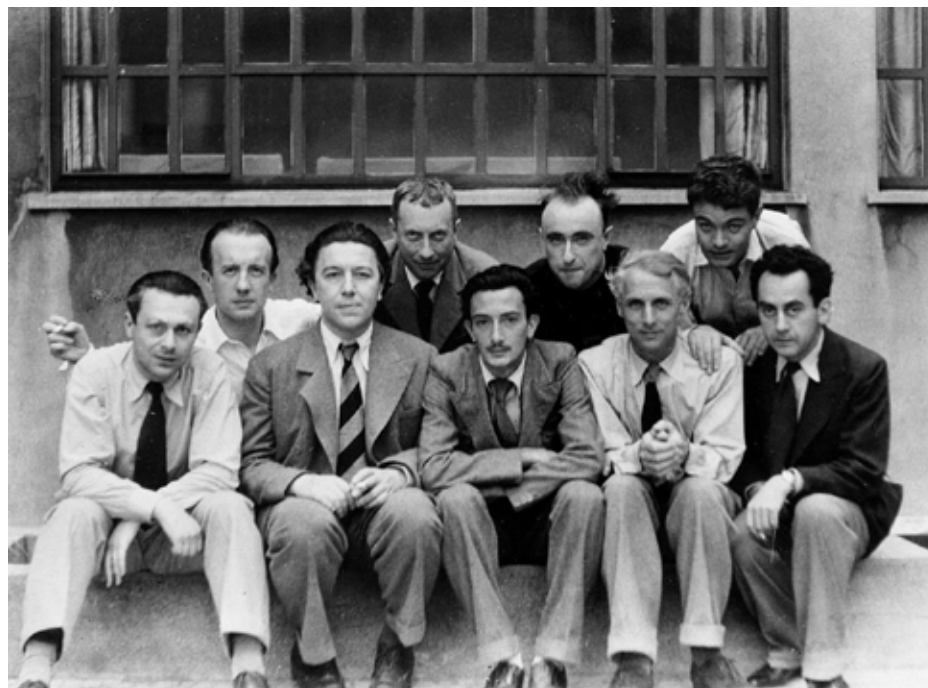
NI SURREALISTER I PARIS CA 1933. FRA VENSTRE TIL HØYRE: TRISTAN TZARA, PAUL ÉLUARD, ANDRÉ BRETON, JEAN ARP, SALVADOR DALÍ, YVES TANGUY, MAX ERNST, RENÉ CREVEL AND MAN RAY.

For avantgarden stod det klart, at 'en anden verden' eksisterede og at avantgarden sammen med socialister af enhver slags også delte den overbevisning, at 'en