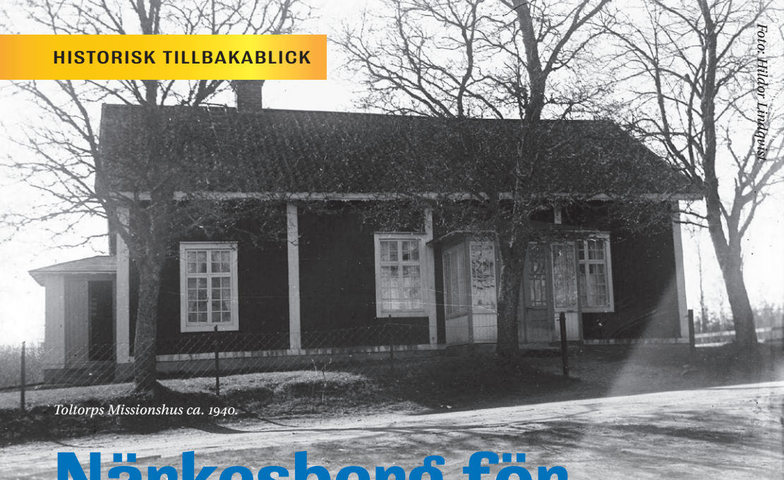
Toltorps Missionshus ca. 1940.