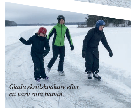
Glada skridskoåkare efter ett varv runt banan.