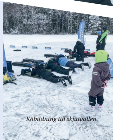
Köbildning till skjutvallen.