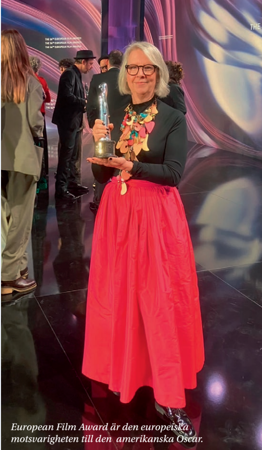
European Film Award är den europeiska motsvarigheten till den amerikanska Oscar.