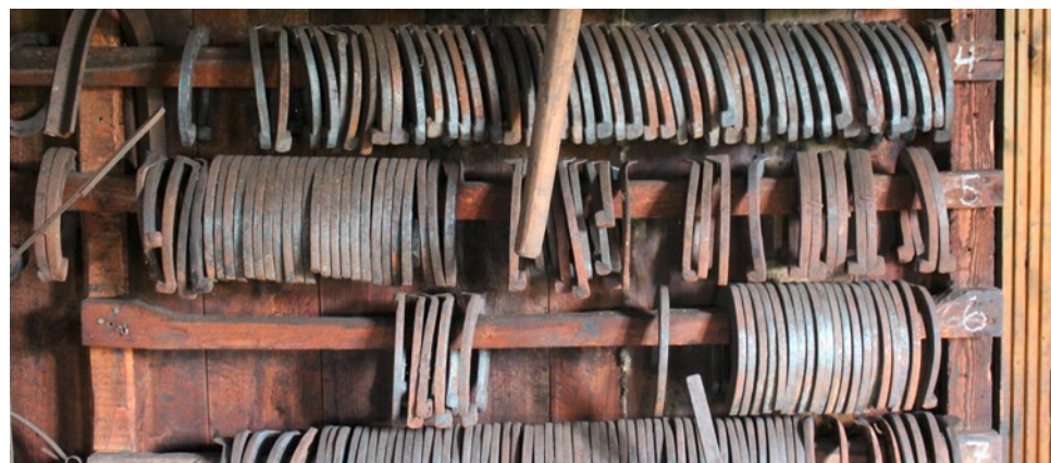
Hästskor i väntan på användning.