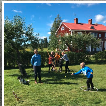
Det fanns även andra aktiviteter för barn. Bland annat kast med boll samt stylltor.