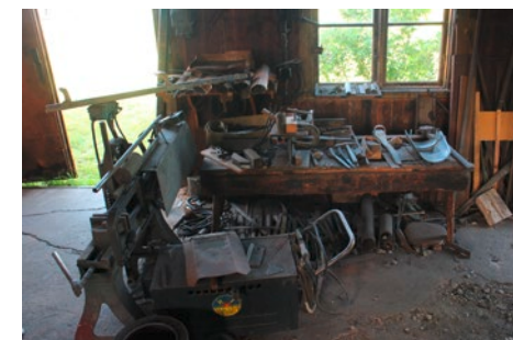
Utrustning för smides- och svetsarbeten.