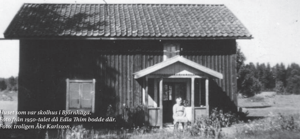
Huset som var skolhus i Björnhaga. Foto från 1950-talet då Edla Thim bodde där.