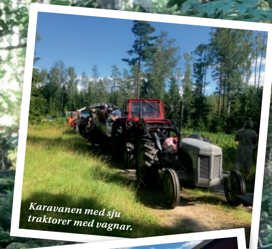
Karavanen med sju traktorer med vagnar.