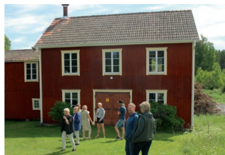
Nisses och Olles smedja.