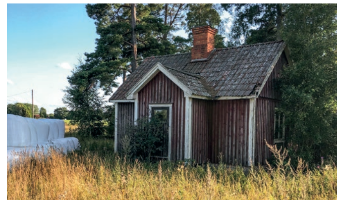
Idag står bastun tom och övergiven.