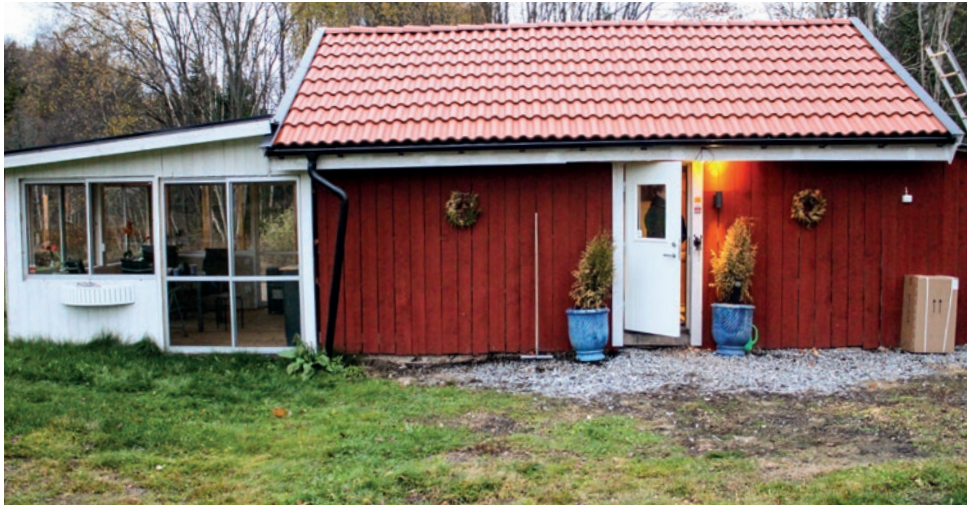
Den gamla drängstugan har gjorts om till bostad och innehåller: ett rum, kök, hall och badrum.