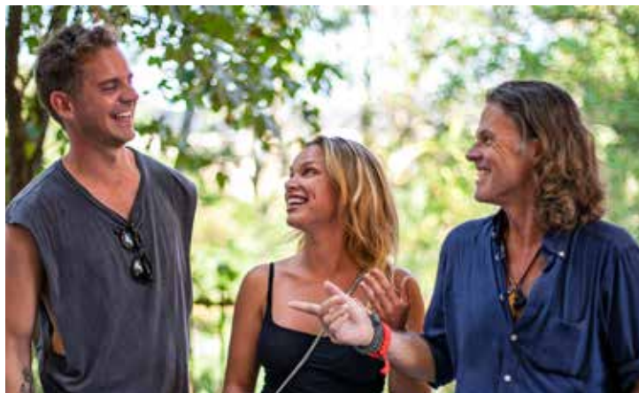
Huvudrollsinnehavarna slappnar av mellan tagningarna.

för Stockholm och ett häftigt uteliv med killar, nattklubsbesök och jobb på en reklambyrå. När pappan hör av sig och vill att hon ska komma hem, åker hon motvilligt tillbaka efter tio år. Madde har en massa fördomar om livet på landet och ser ner på dem som blev kvar, men väl där upplever hon en mängd saker som får henne att ändra uppfattning.