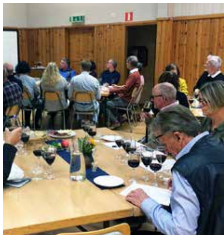
Här syns några av det 30-tal personer som deltog i årets vinprovning.