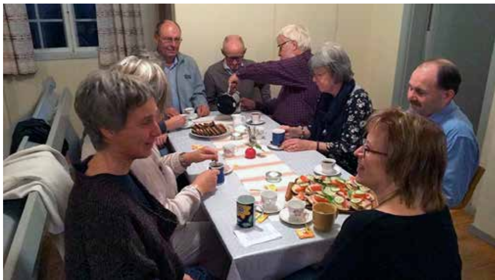
Efter förhöret bjöds det på fika.