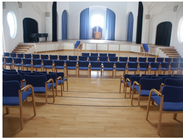
Store sal, plads til 300