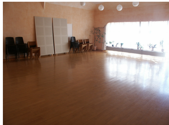
2 stk. Møde lokaler, plads til ca. 60 – 70