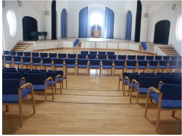
Store sal, plads til 300