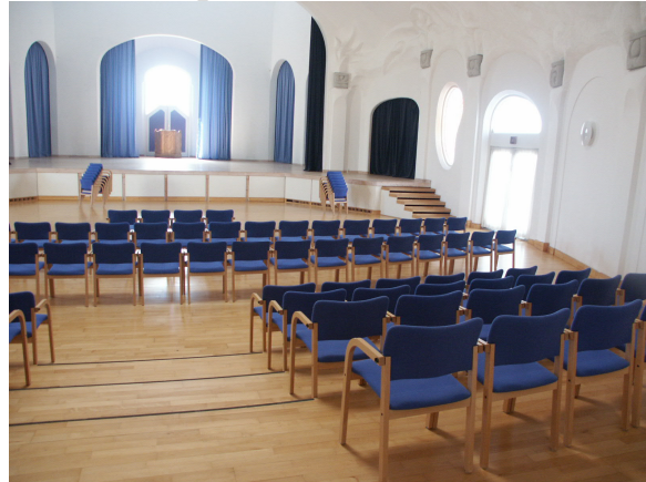
Store sal, plads til 300