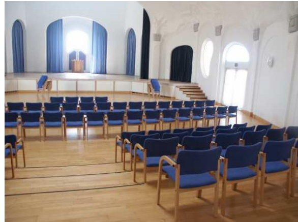
Store sal, plads til 300