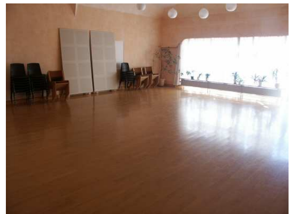
2 stk. Møde lokaler, plads til ca. 60 – 70