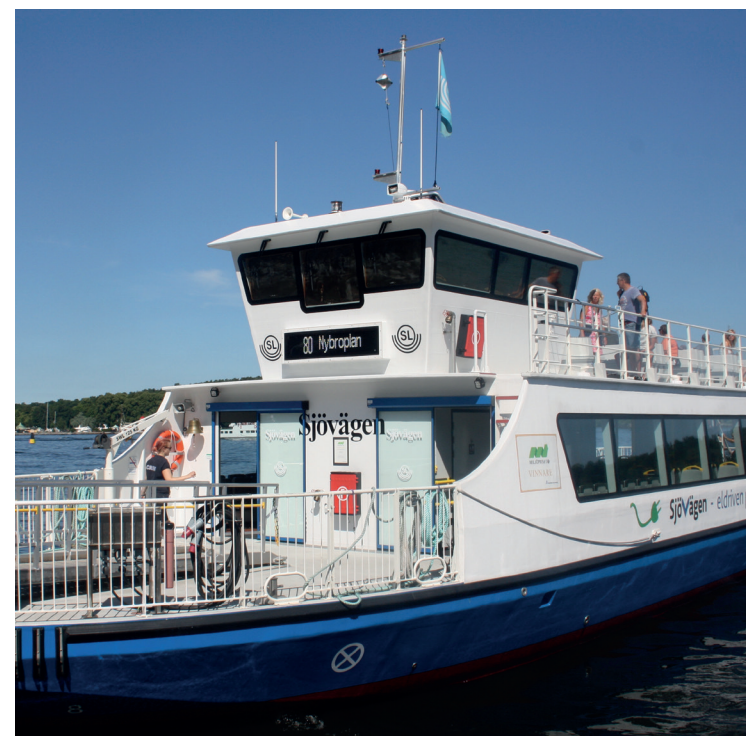
Med SL-kortet kan resenärerna numera ta sig fram även med Waxholmsbåtarna.

Att kunna ta båten på SL-kortet innebär en stor ökning av valfriheten för Nackaborna. Nu kan man ta buss en dag, båt en annan, kanske ta med cykeln ombord för att cykla till slutdestinationen, eller för att cykla hem, något som inte är möjligt i den övriga kollektivtrafiken idag.