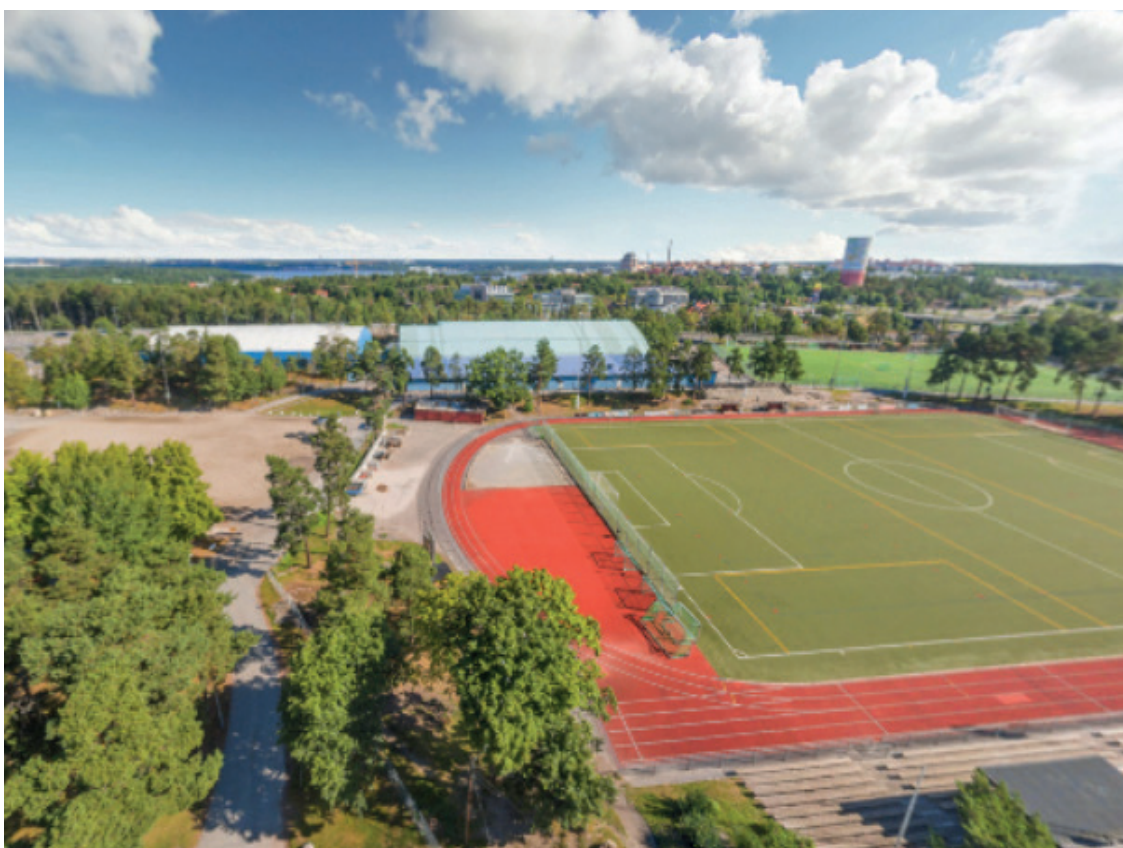
Ishallarna vid Nacka IP kommer att rivas, men inte förrän det har ersatts av nya anläggningar.

-Någon exakt plats är ännu inte utpekad, det kan bli någonstans på Järlahöjden eller på annan plats i kommunen. Vi har en dialog tillsammans med hockeyföreningarna för att hitta ett så bra alternativ som möjligt.