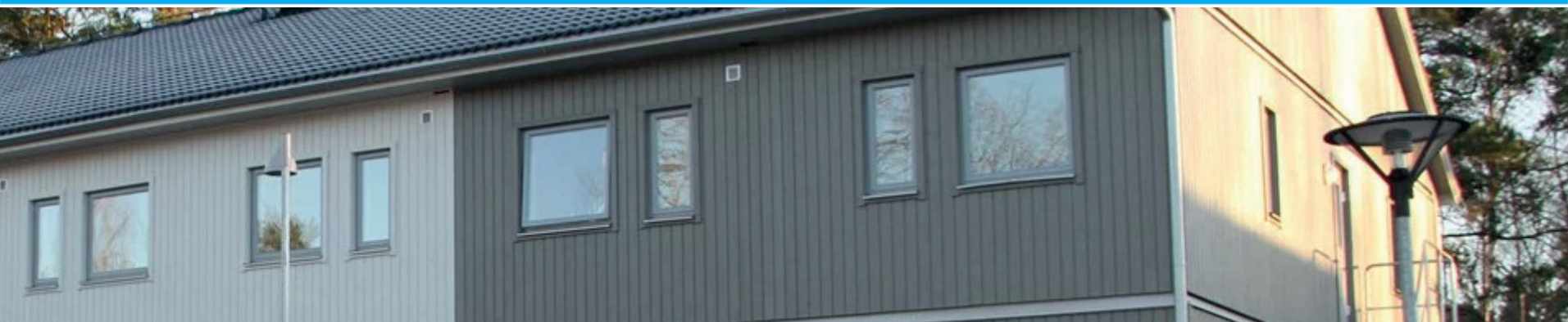
Modulbostäderna i Nacka, en av lösningarna som kommunen har ordnat för att hantera flyktingmottagandet.