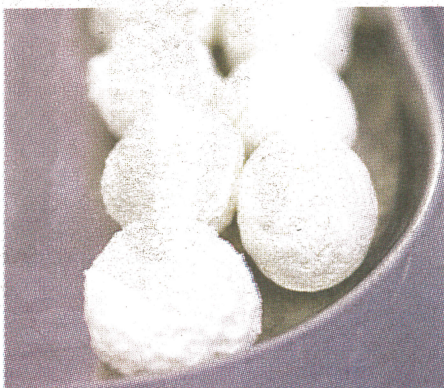
Yoghurtbullarna är en specialitet, gjorda på pastöriserad komjölk, yoghurtkultur, salt, solrosolja, olivolja och ibland smaksatta med timjan.