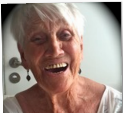
SÅNG GER ENDORFINER