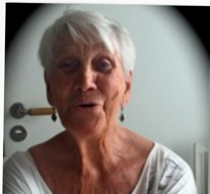
SÅNG VÄCKER KÄNSLOR